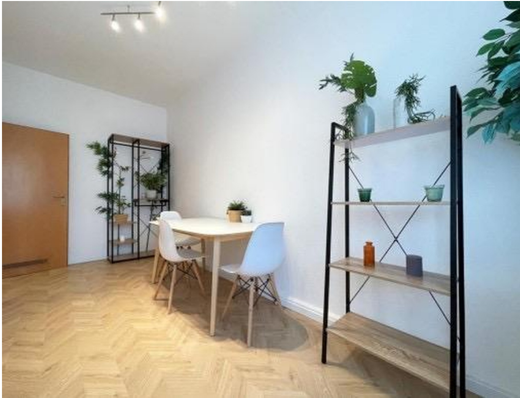
Büro / Kinderzimmer