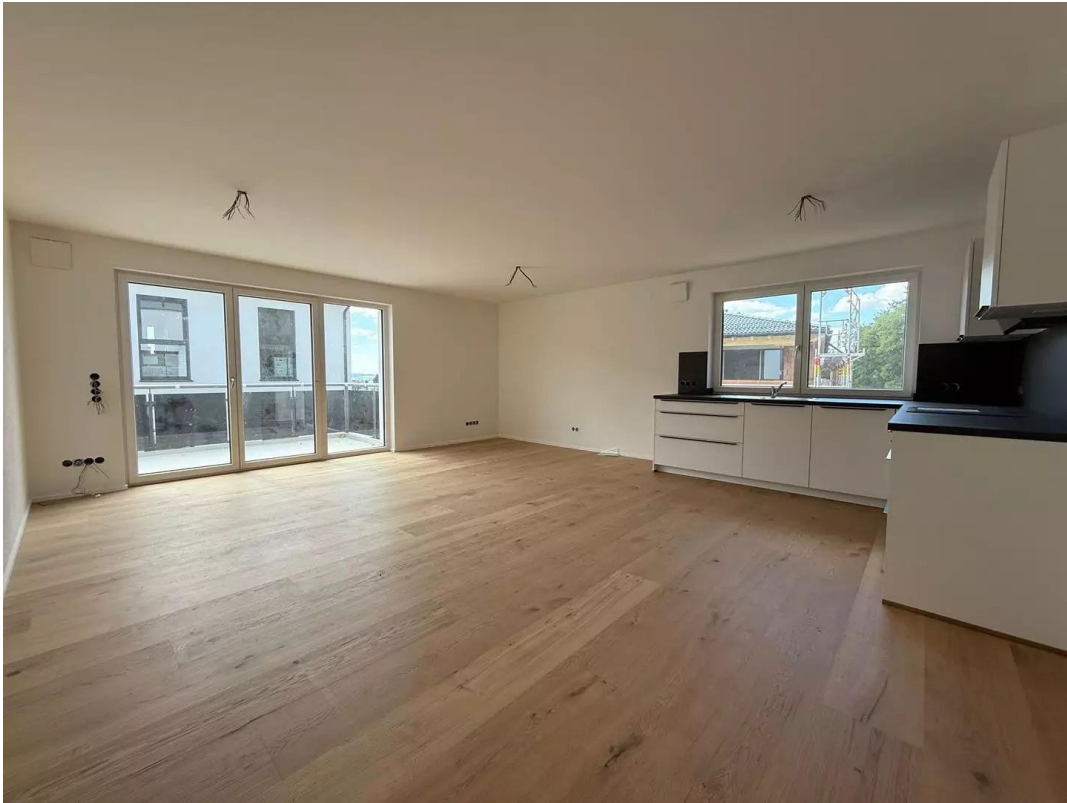
Wohn- & Essbereich