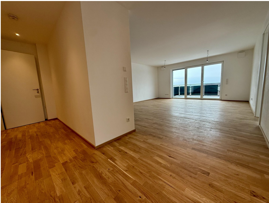
Wohn- & Essbereich