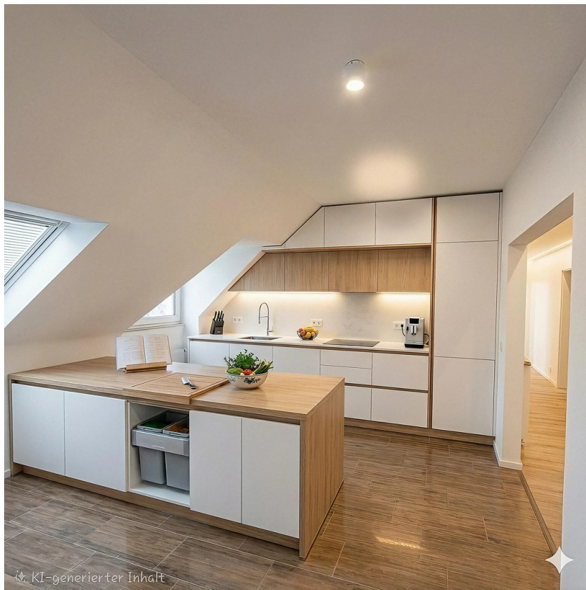
Einbauküche nicht vorhanden