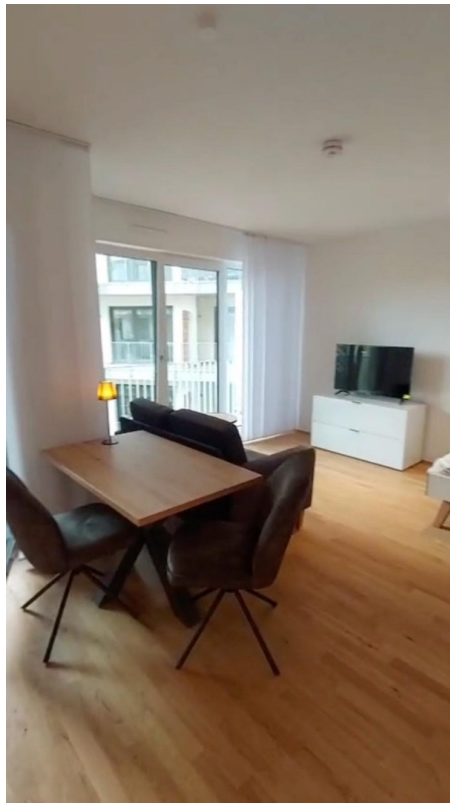
Esstisch / Schreibtisch