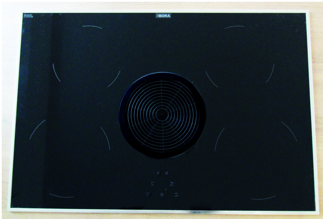
BORA - Induktionskochfeld