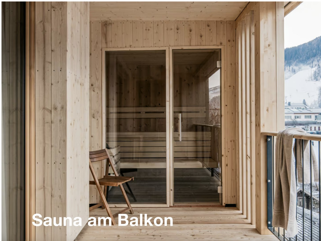
Sauna am Balkon