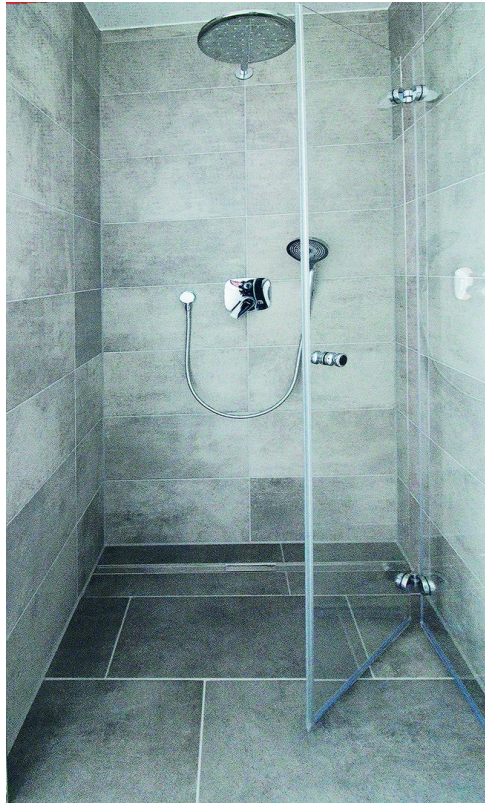
Sehr großzügiges Duschbad