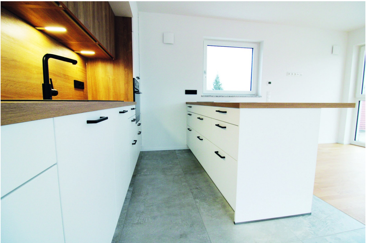
Küchen-Insel als Treffpunkt