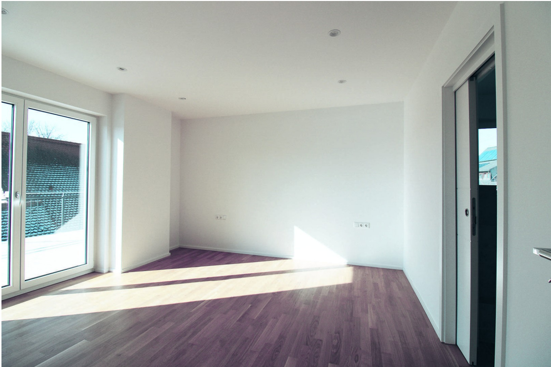
1 von 2 Schlafzimmer