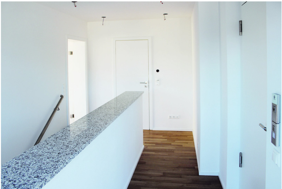
Ablage evtl. für Schranksystem