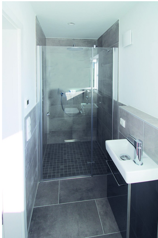
2. Gästebad incl. WC