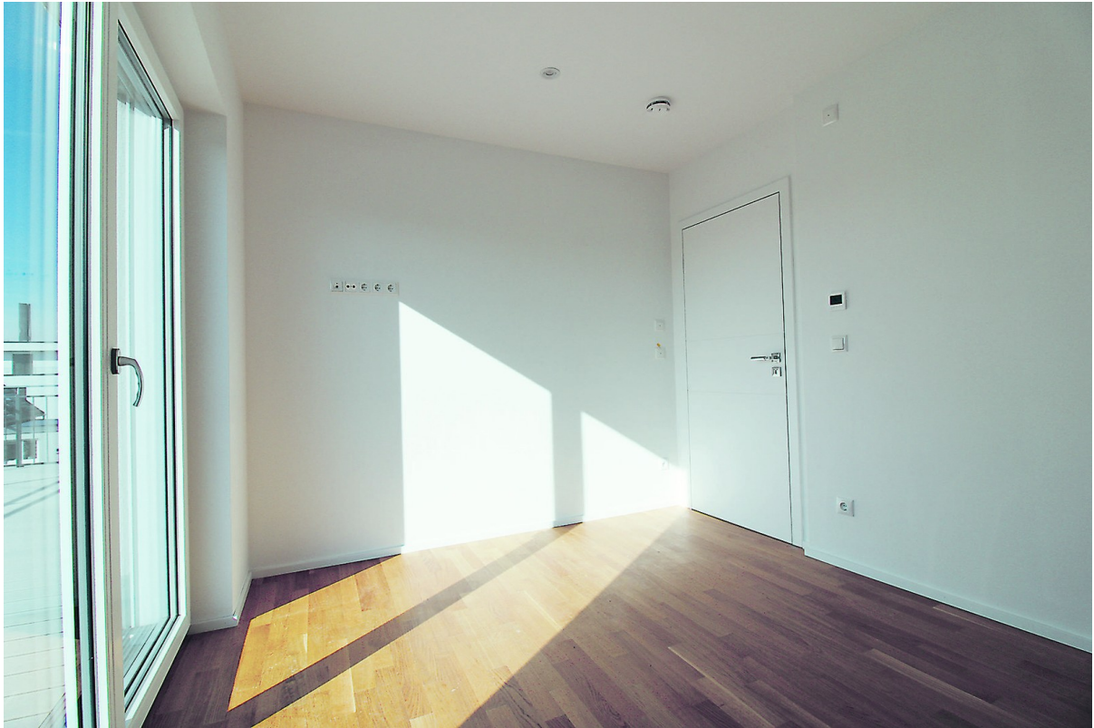
Büro oder Gästezimmer