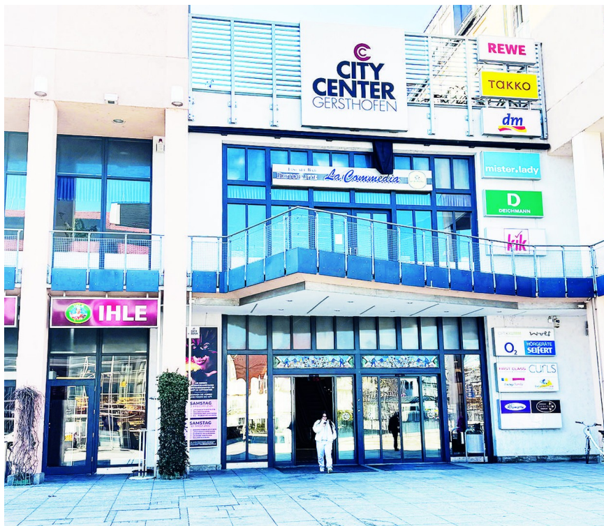
Über 50 Geschäfte fußläufig