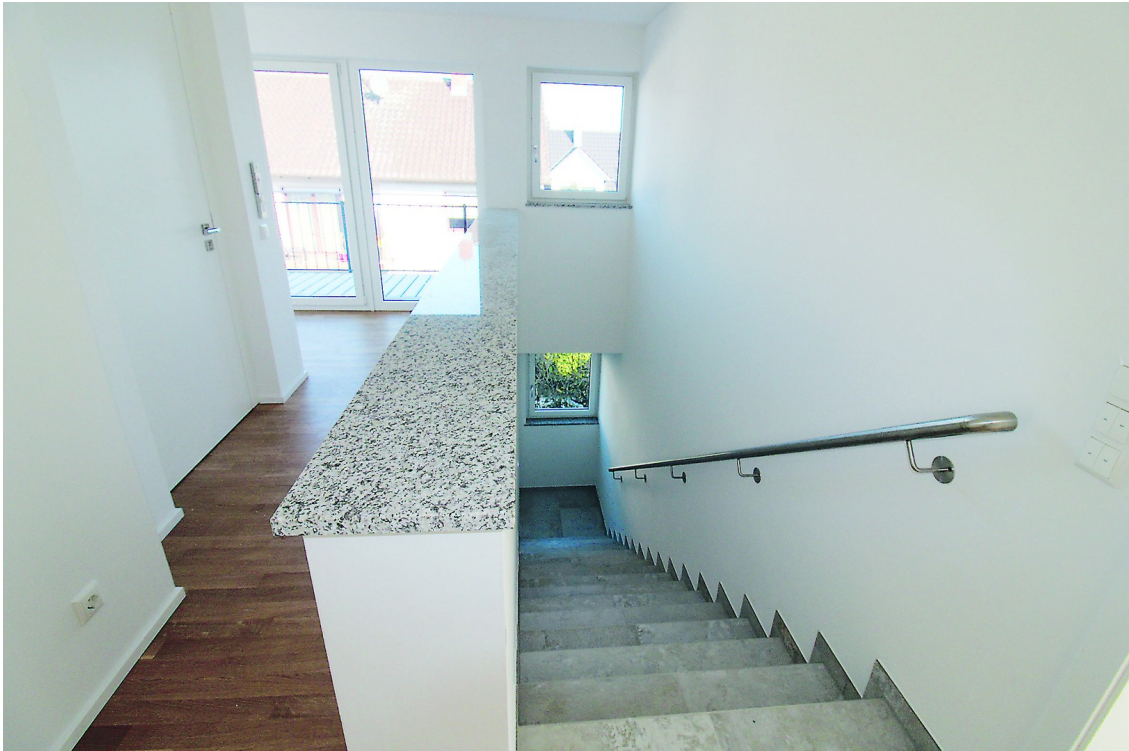
Treppen-Aufgang als Nutzfläche