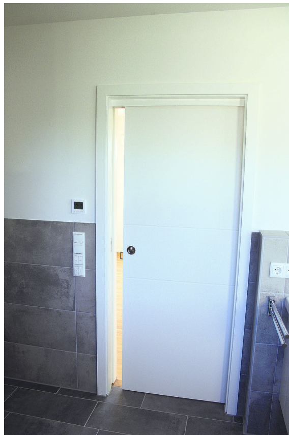
Schiebetüre vom SZ ins Bad