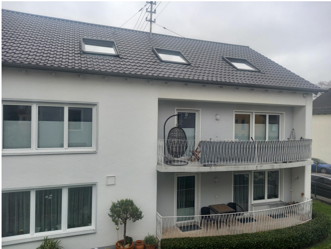
Südseite des Hauses