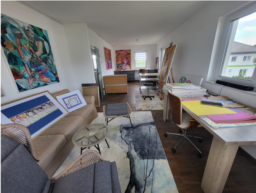
Doppelzimmer 1 OG