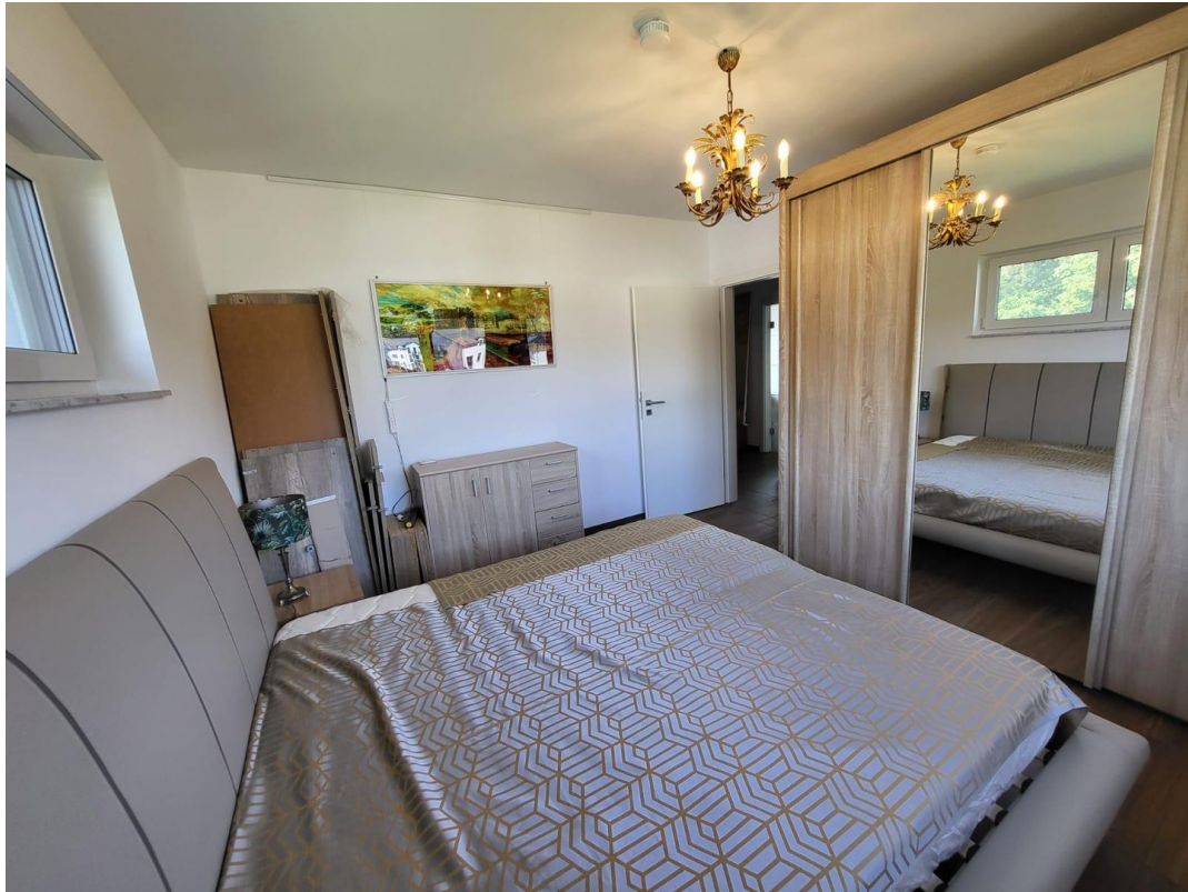
SZ 1. OG