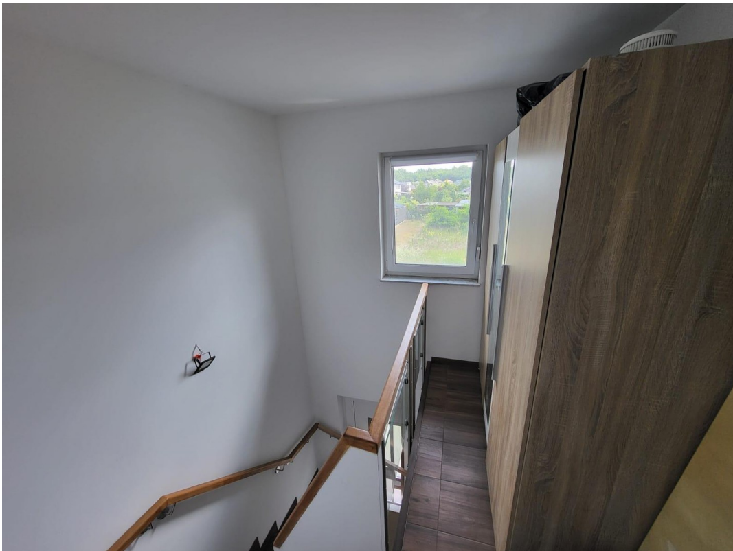
Flur 1 OG