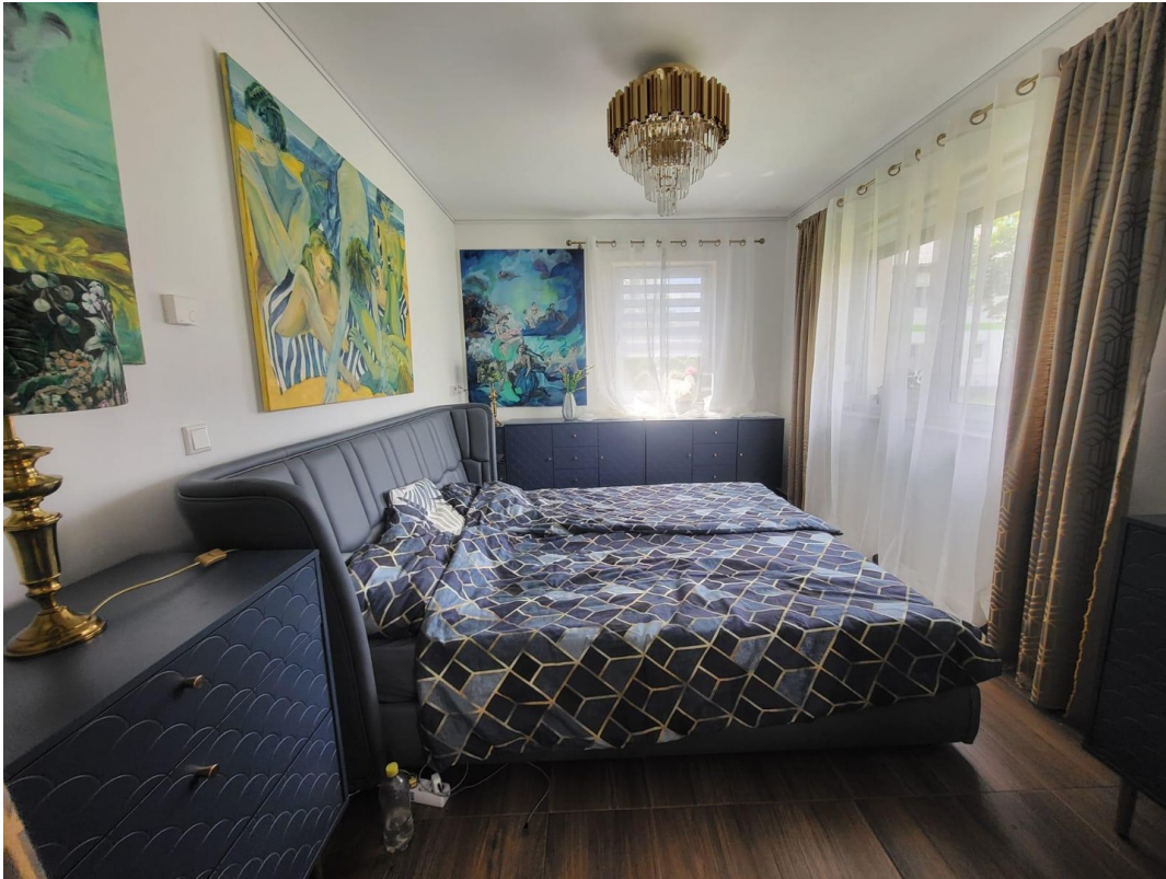
SZ im EG