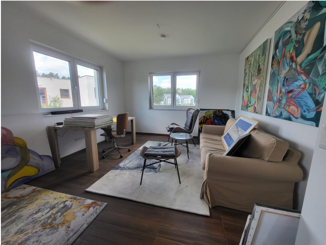
Doppelzimmer 1 OG