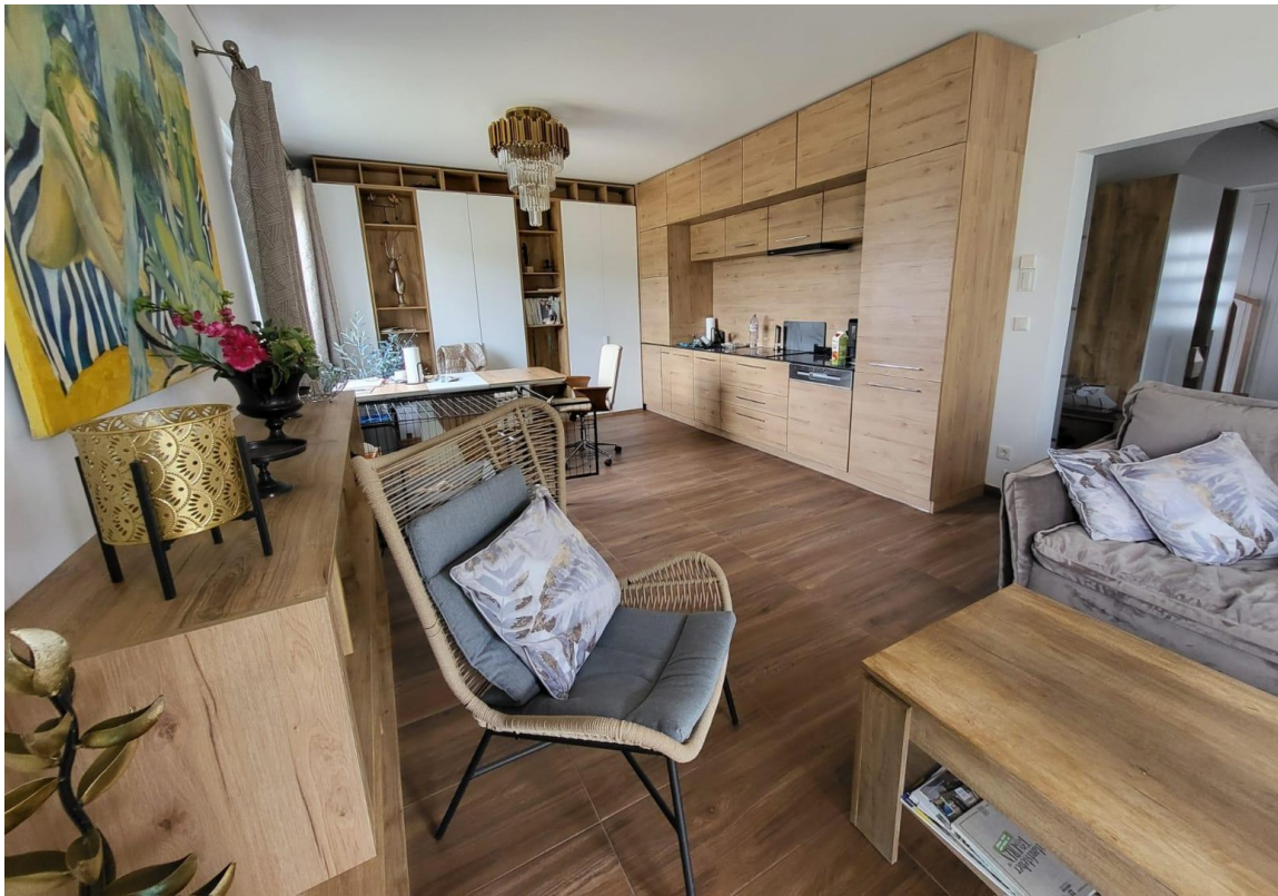
WZ mit EBK im EG