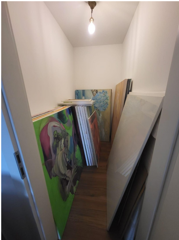
Stauraum 1. OG