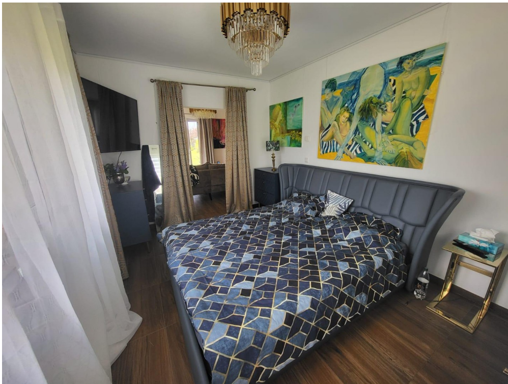
SZ im EG