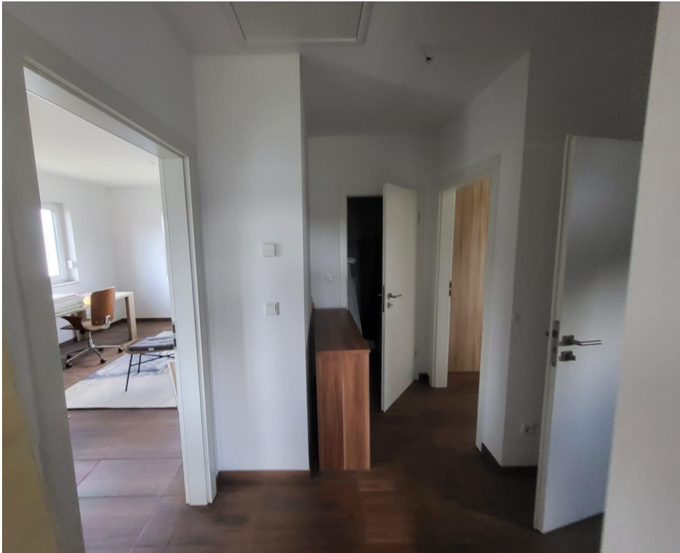
Flur 1 OG