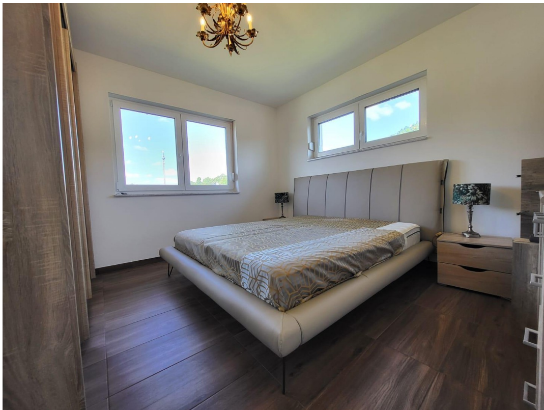
SZ 1. OG