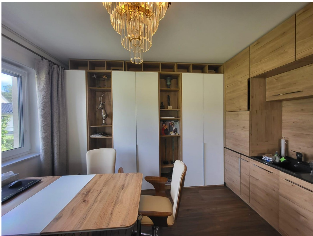
WZ mit EBK