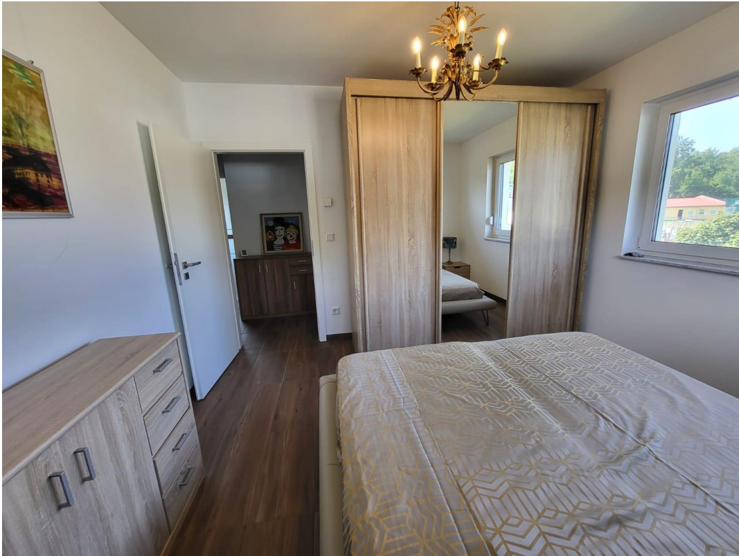
SZ 1. OG