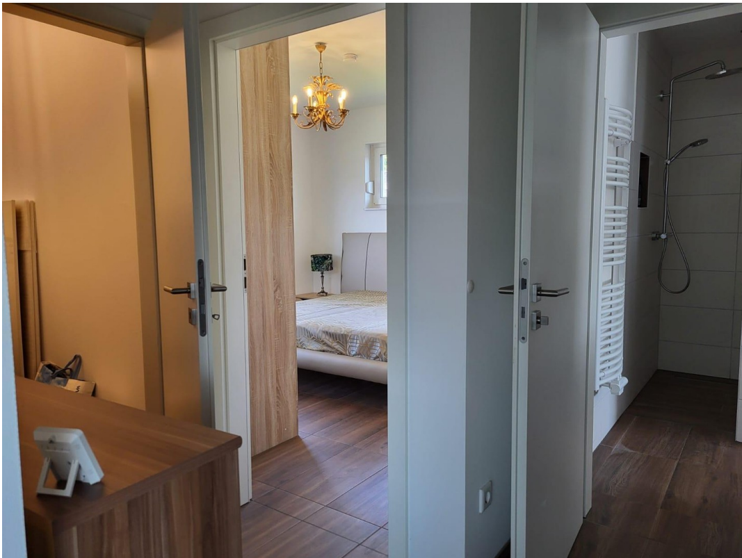
Flur 1 OG