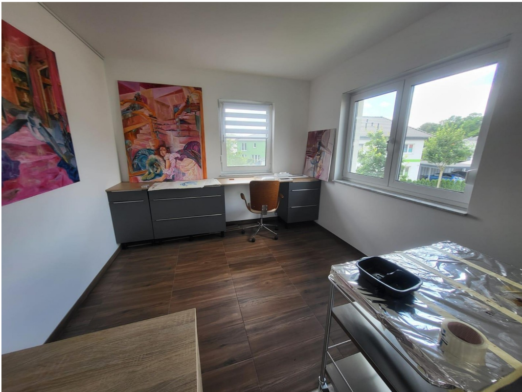
Doppelzimmer 1 OG