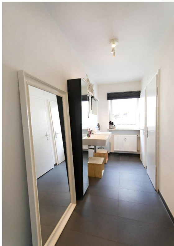
2 separate WCs im 1. Stock