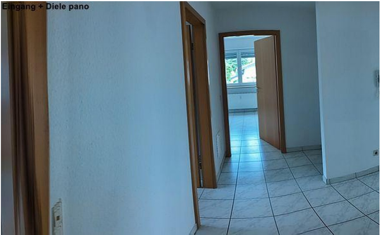
Eingang + Diele Panorama Sicht