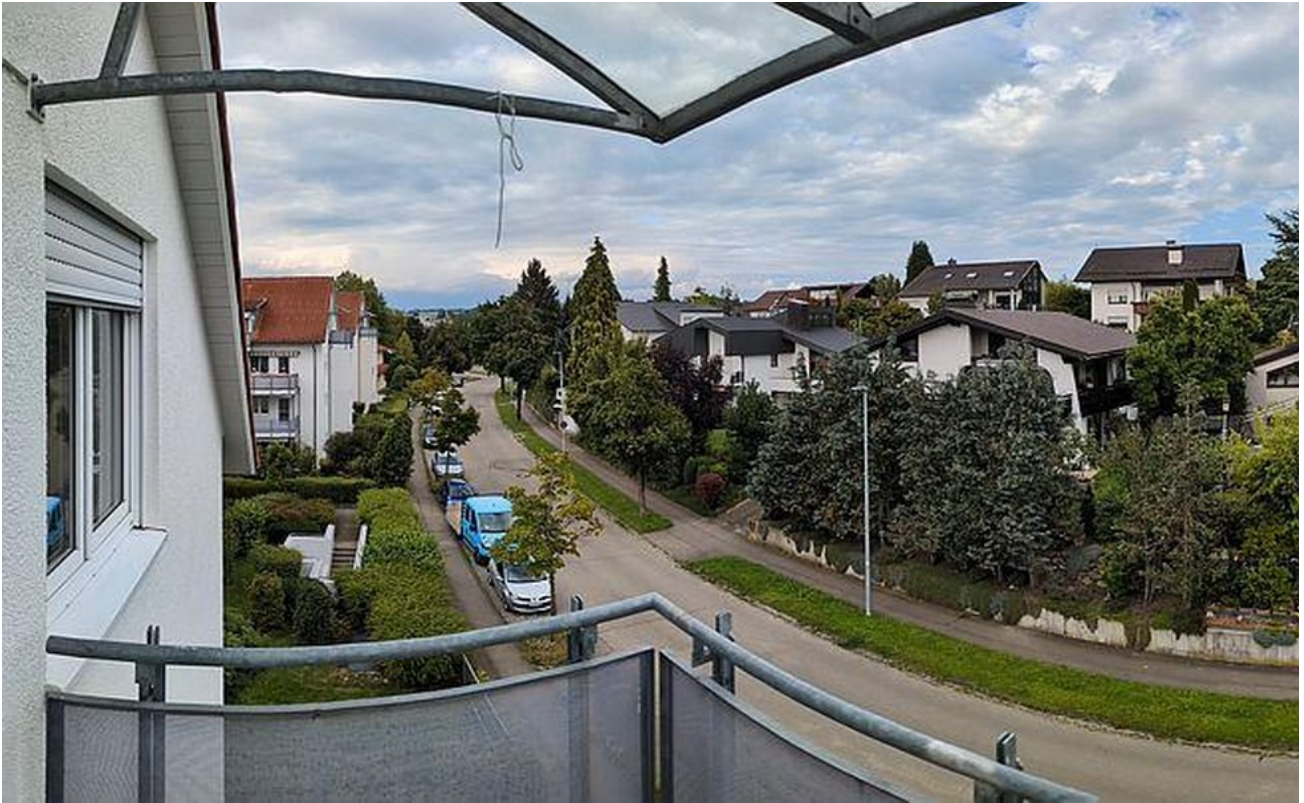
Balkon Ost Panorama Ausblick