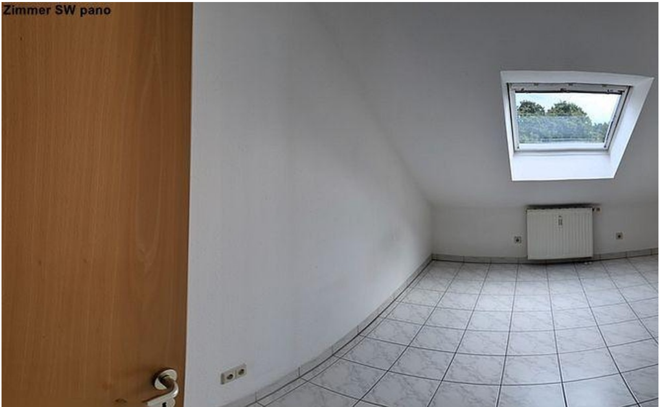
Zimmer Süd-West Panorama Sicht