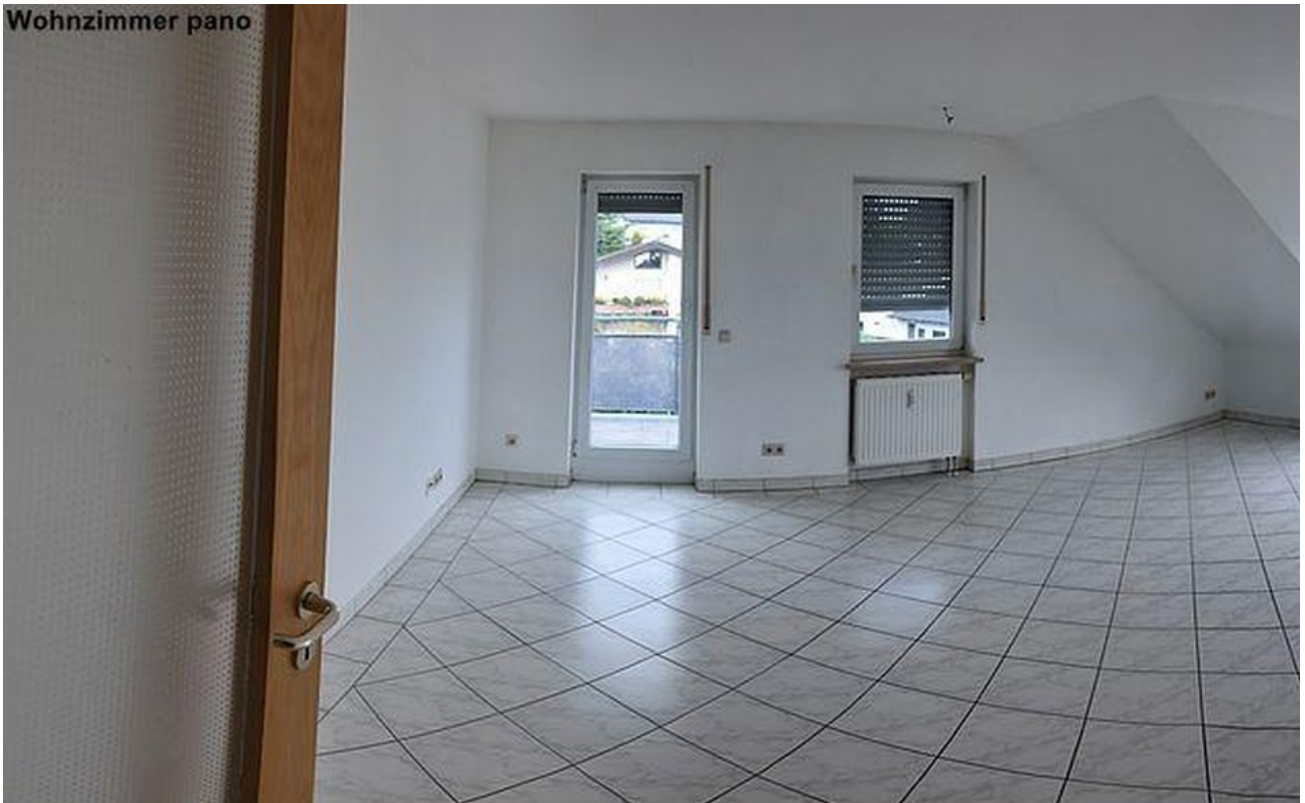
Wohnzimmer Panorama Sicht