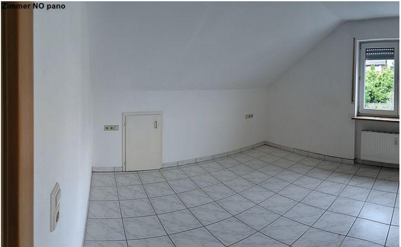
Zimmer Nord-Ost Panorama Sicht