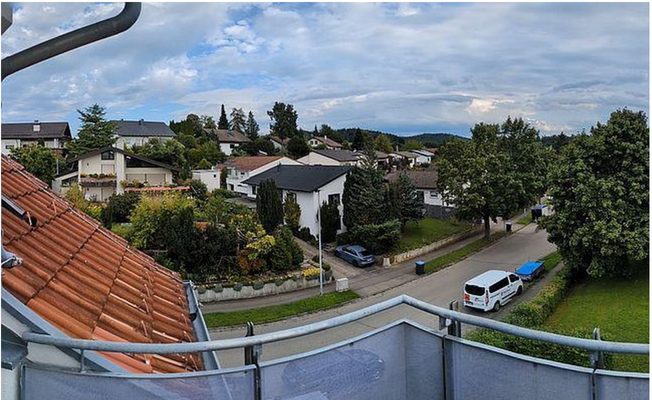
Balkon Süd Panorama Ausblick