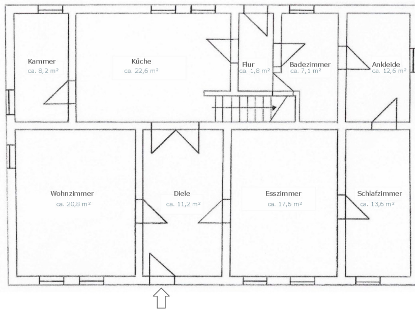
GRUNDRISS ERDGESCHOSS Der Grundriss ist nicht maßstabsgerecht.