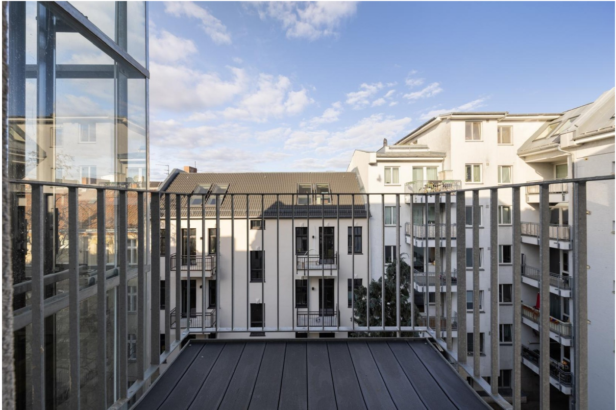
Balkon Zimmer 3