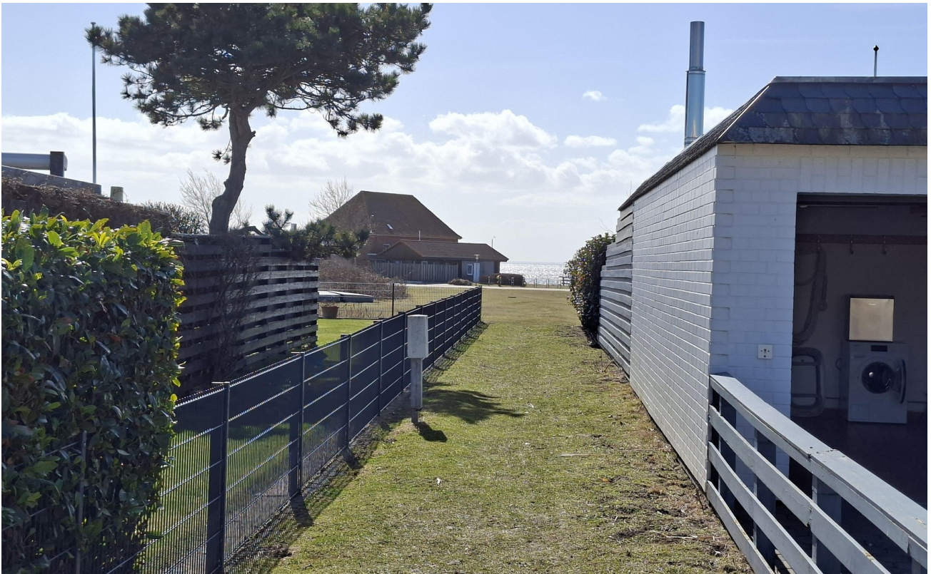
Zugang zum Südstrand