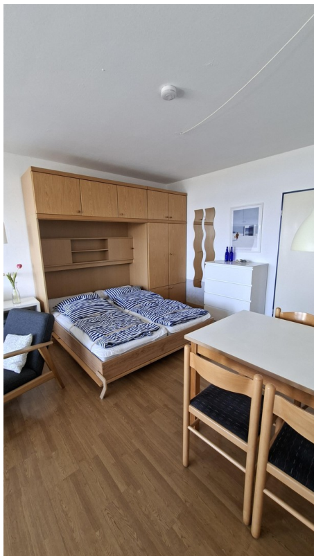
Wohnzimmer mit Wandbett