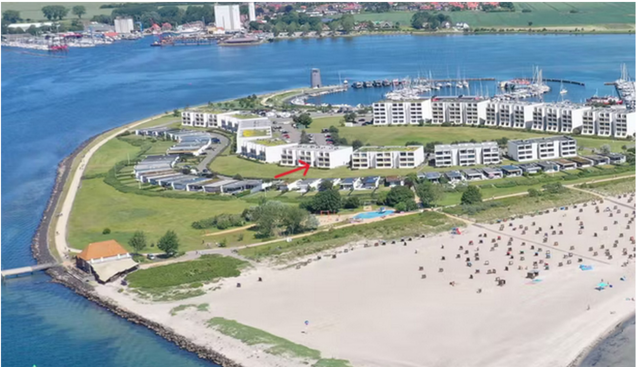
Südstrand Lage Wohnung