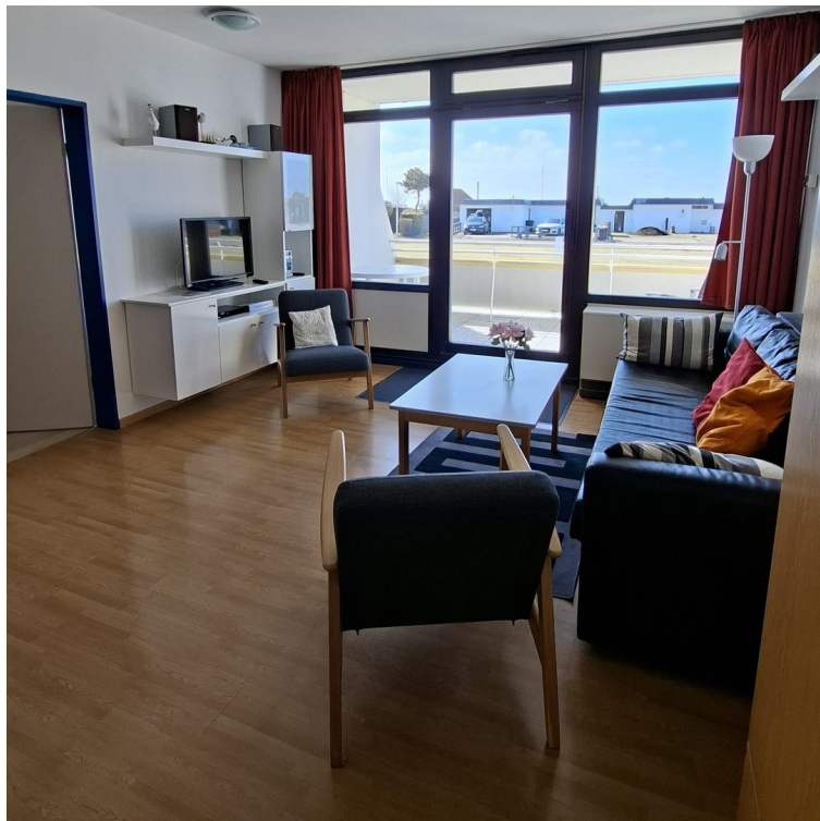
Blick aus der Wohnung