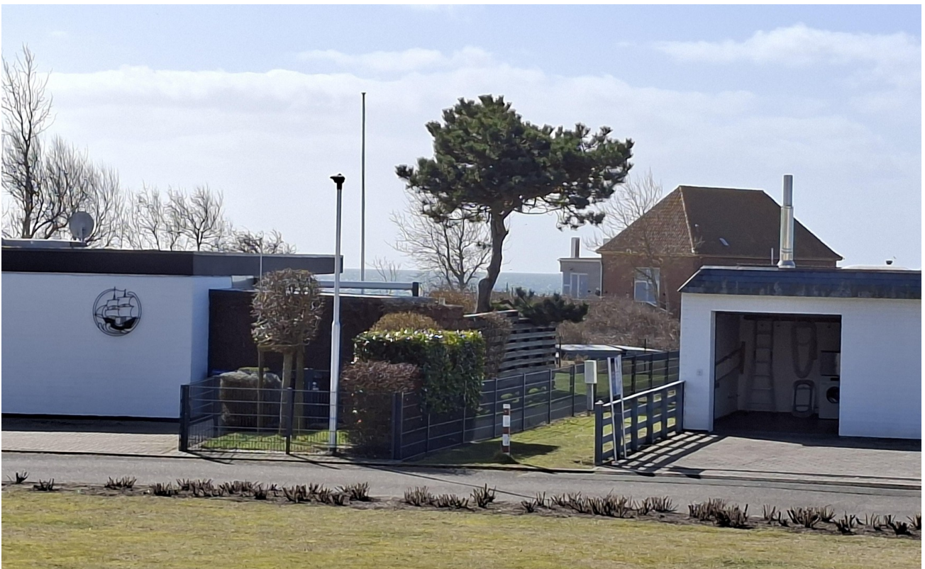
Blick zum Wasser