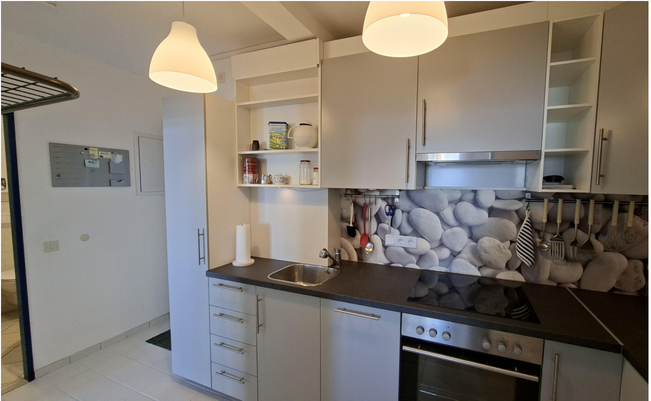
Küche mit Eingang