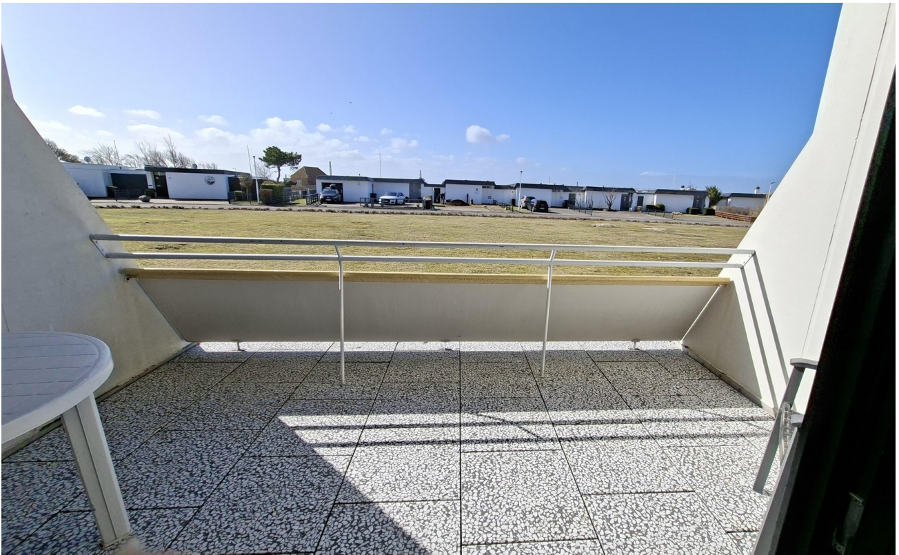
Balkon / Terrasse