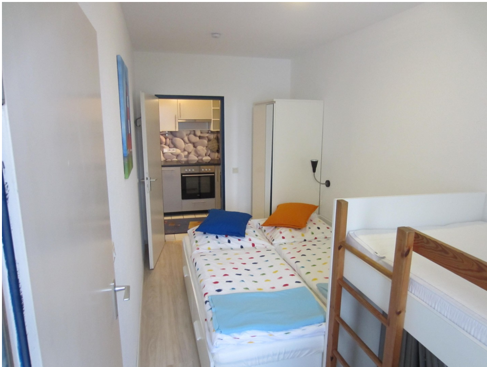
Kinderzimmer mit Ausziehbett