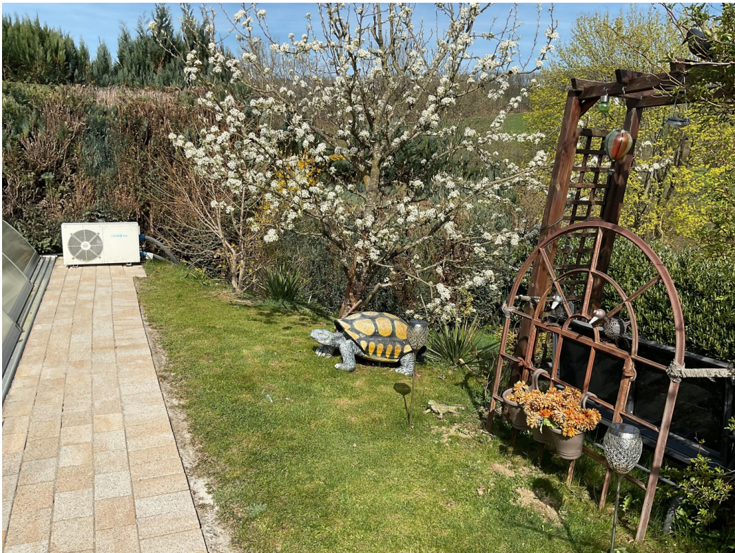
Grundstück Heizung Pool