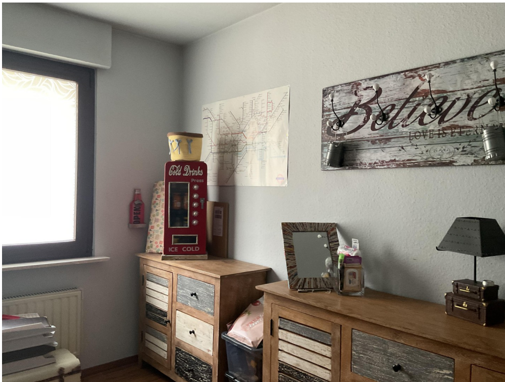
Gästezimmer / Büro