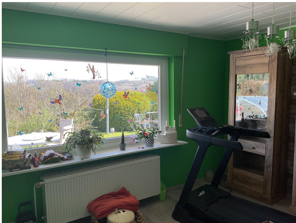
Wohnzimmer / Einl