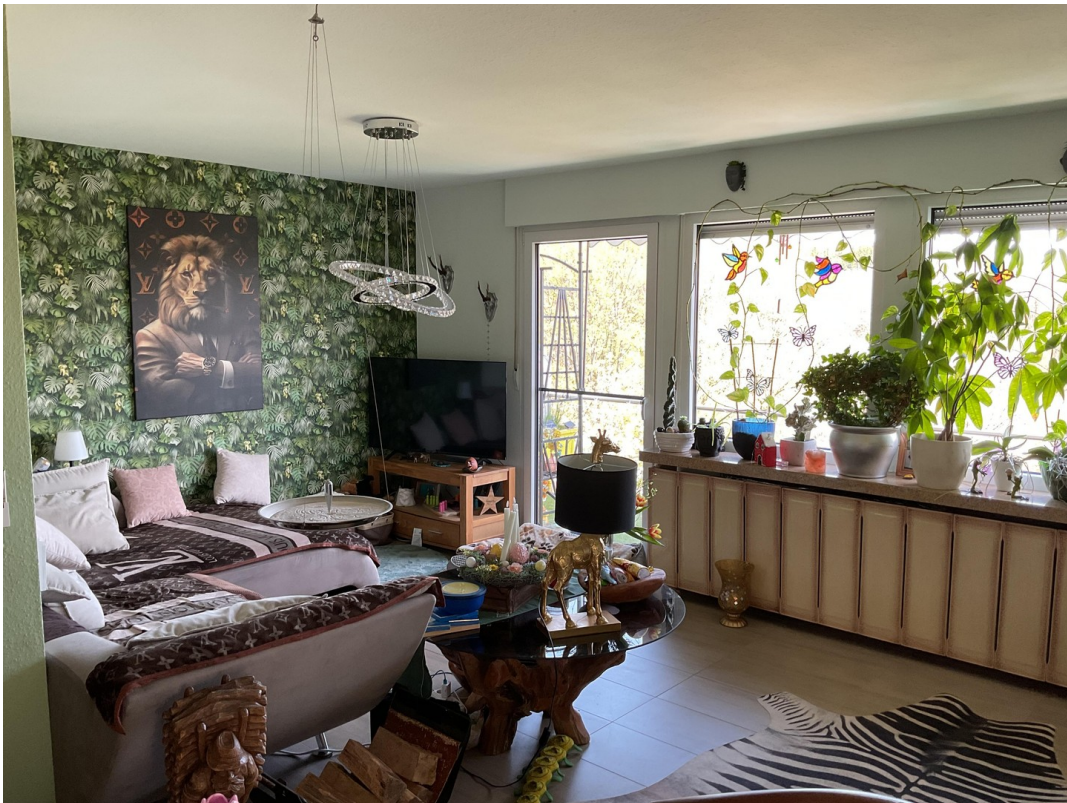
Wohnzimmer / offen mit Küche