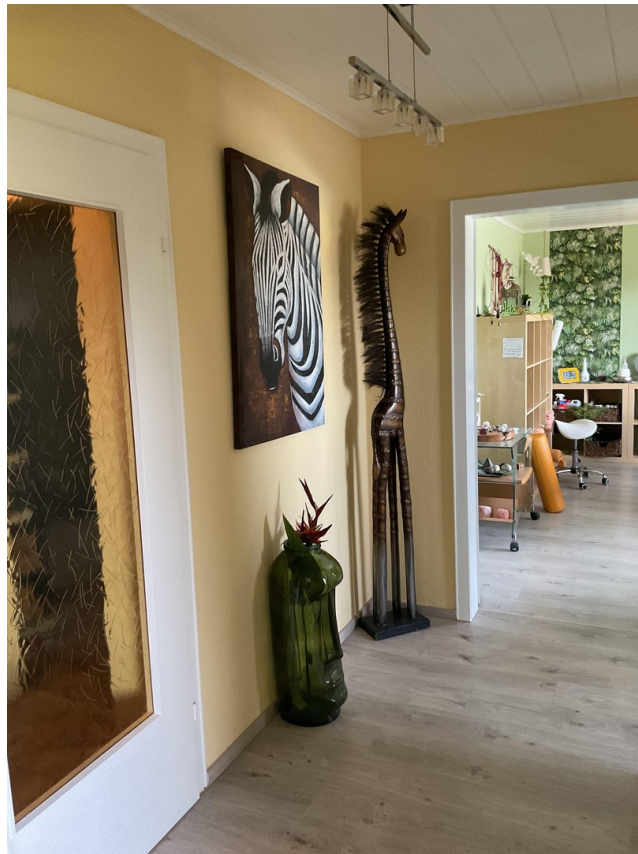
Flur / Einl