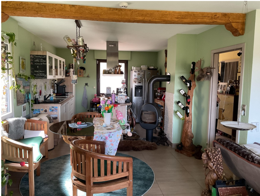
Offener Küchen und Essbereich