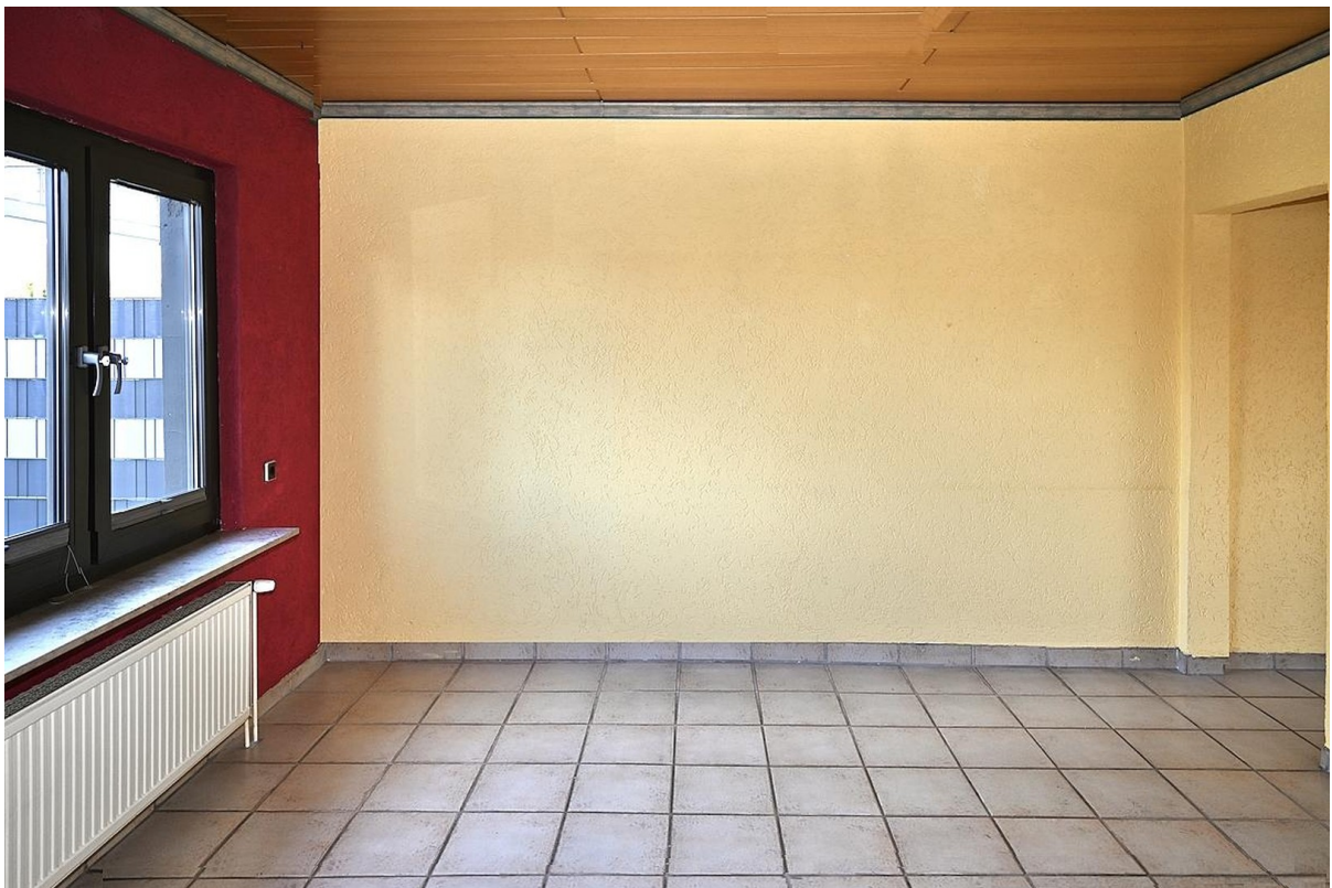
EG Wohnzimmer 1