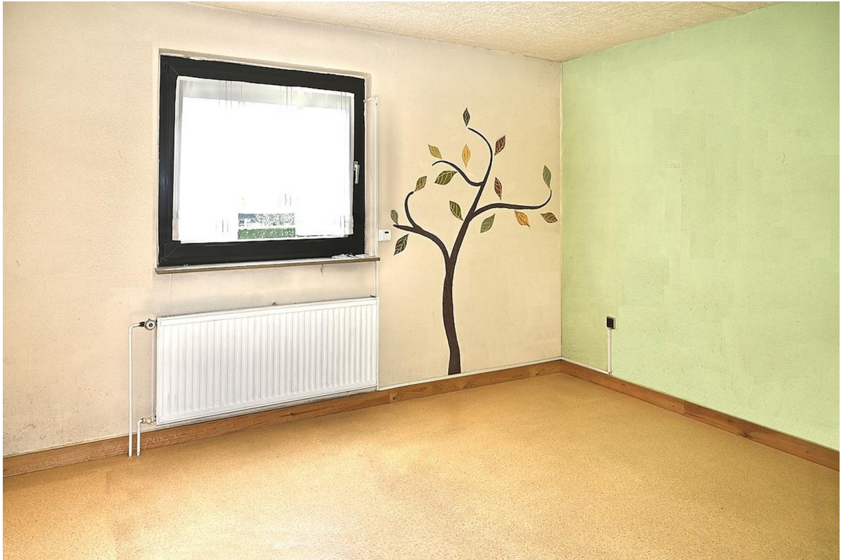
EG Wohnzimmer 2