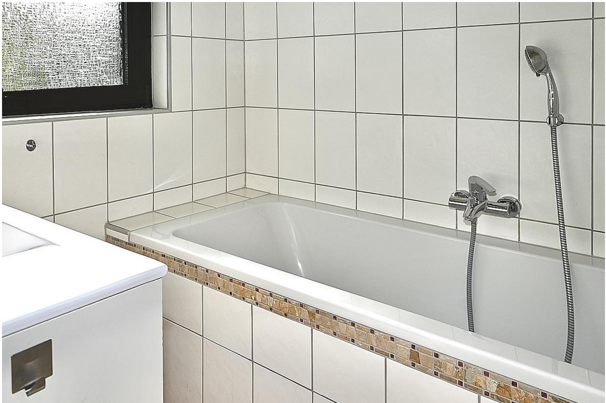
EG Badezimmer Badewanne