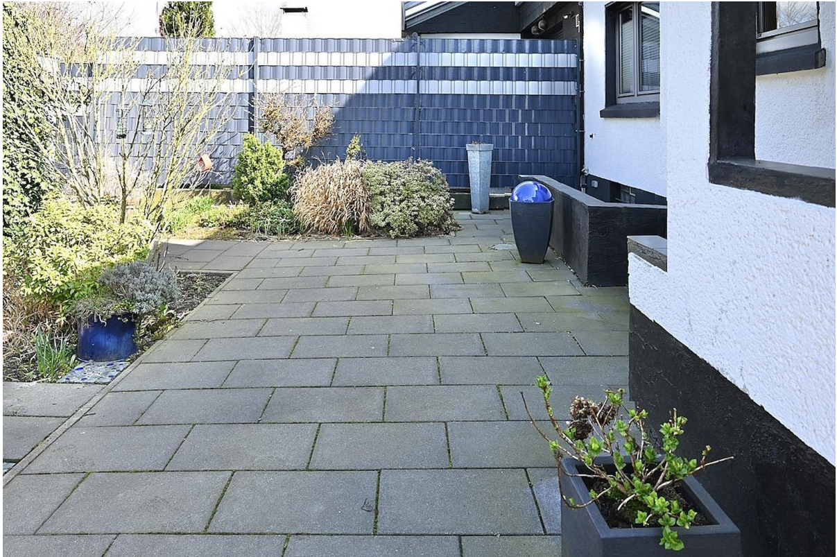
Terrasse am Haus