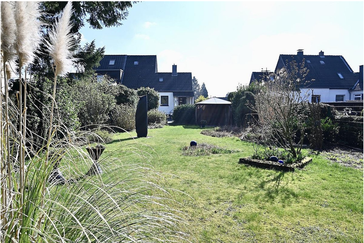
Garten Blick zum Haus