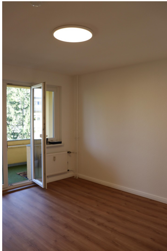
Blick auf die Loggia