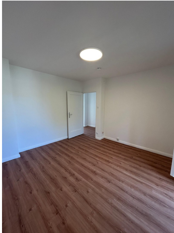
neue Vinylböden Holzoptik