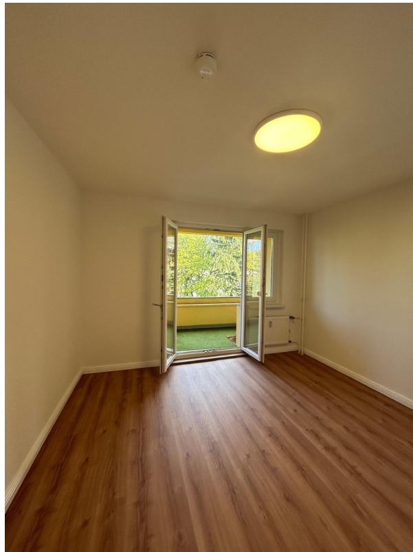
Blick auf die Loggia