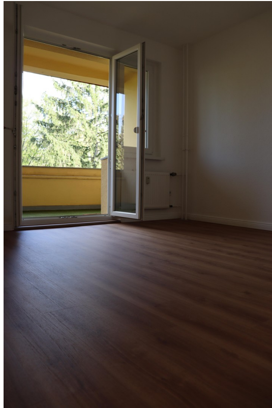
neue Vinylböden Holzoptik