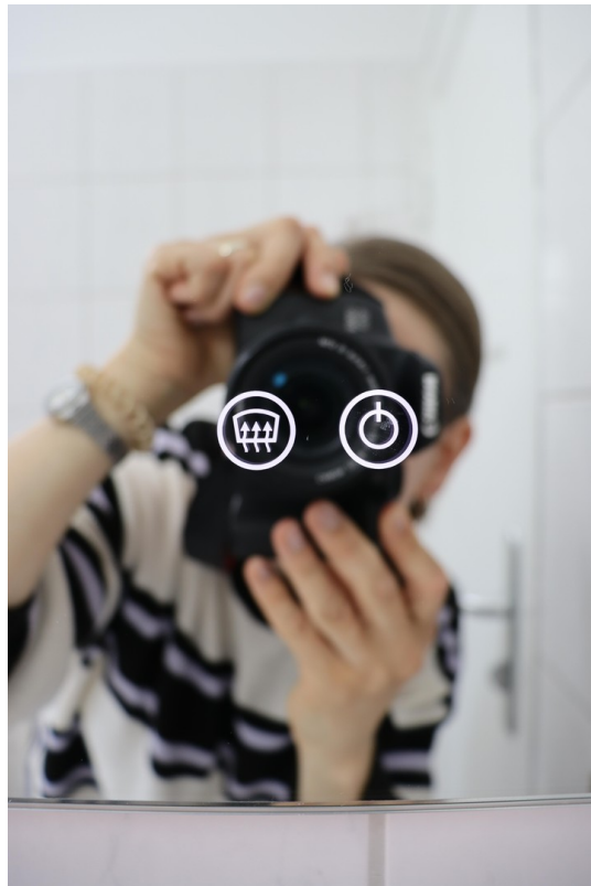
neuer LED Spiegel Bad