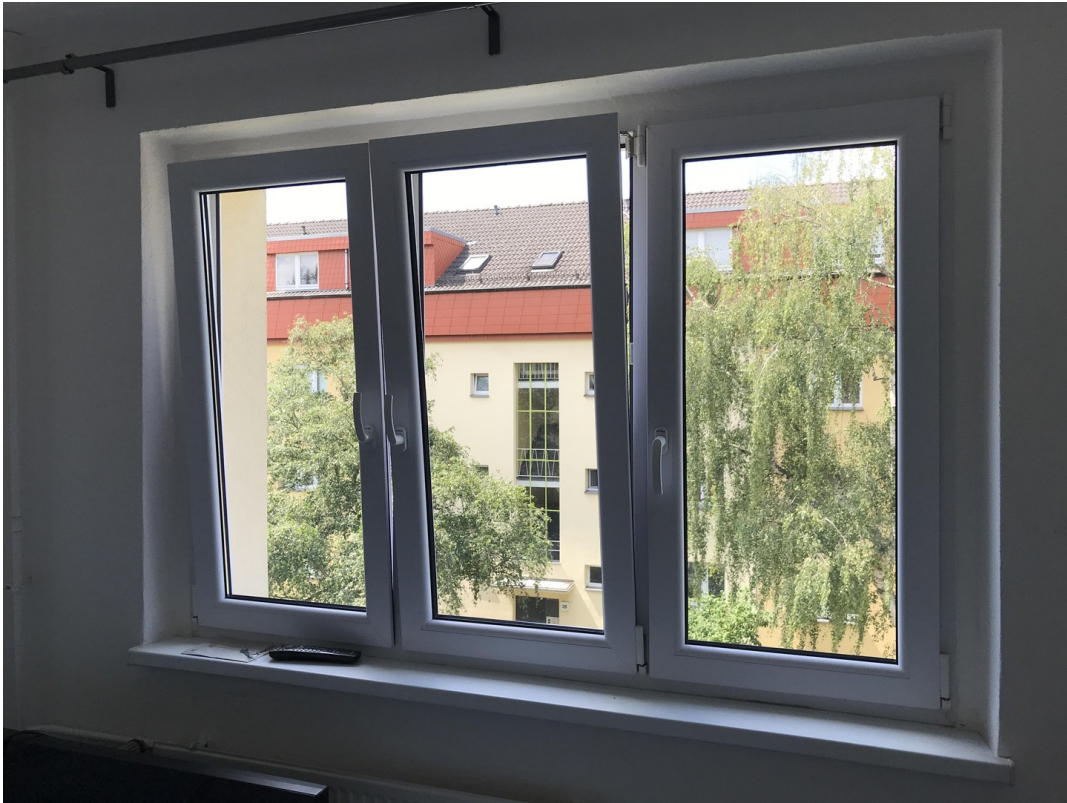
Blick aus dem Schlafzimmer