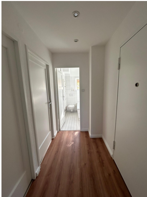
Flur- Blick ins Bad