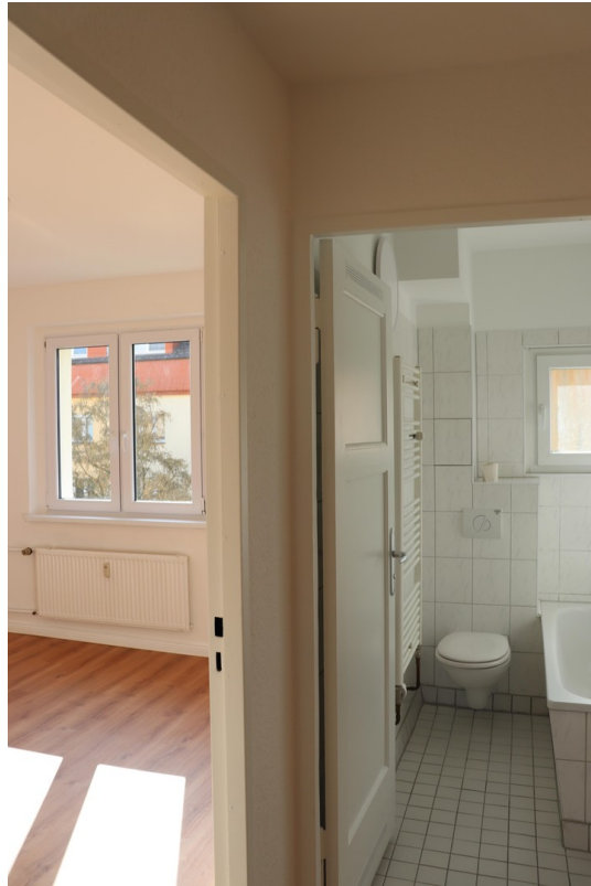
Blick aus dem Flur