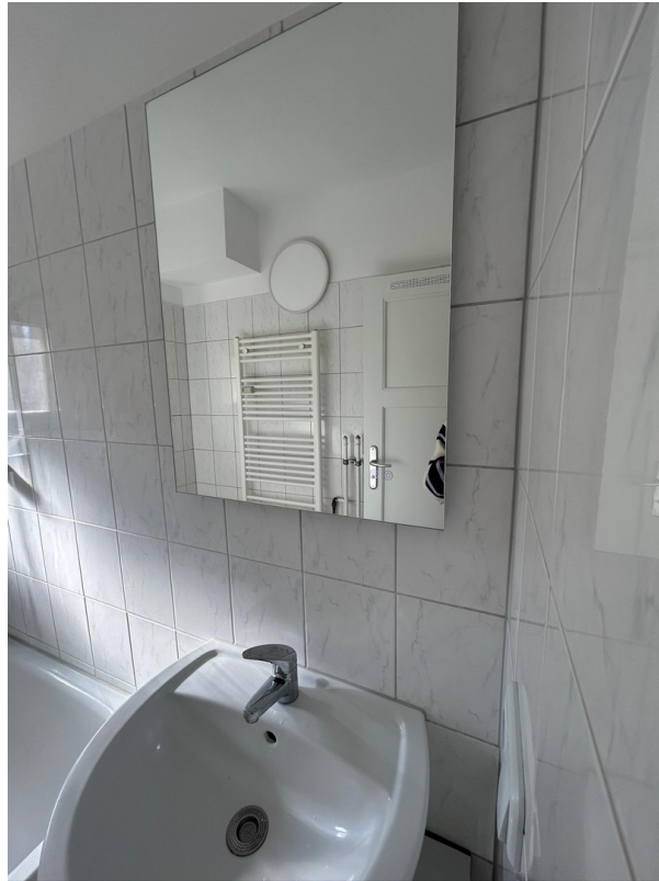
LED Spiegelschrank Bad