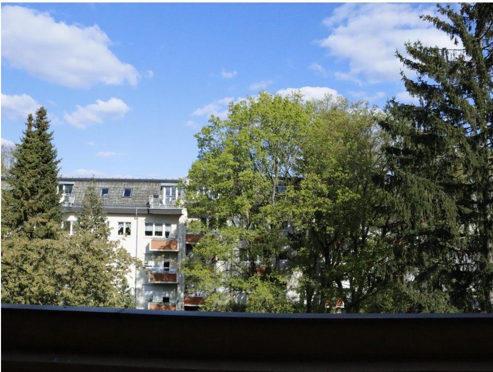
Blick vom Balkon ins Grüne