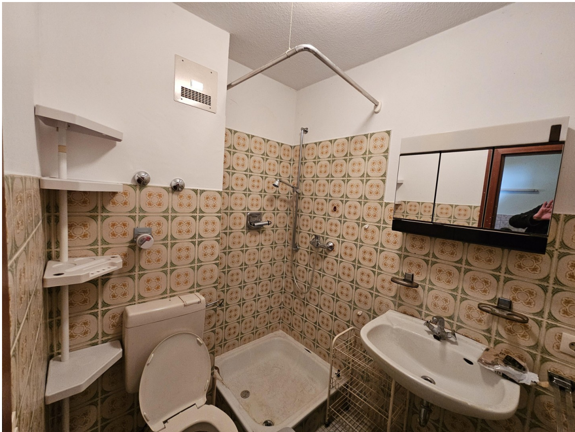
Bad m. Dusche