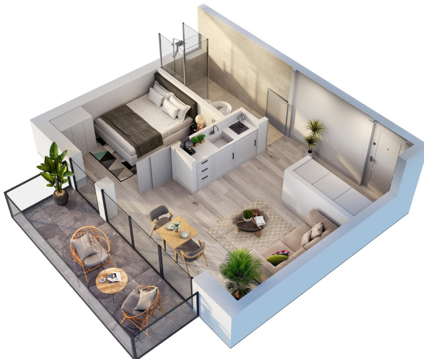
Visualisierung Grundriss IDEE