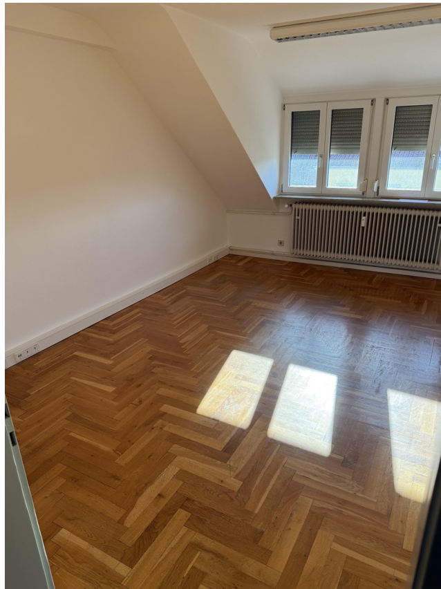
2_Zimmer zum Parkplatz