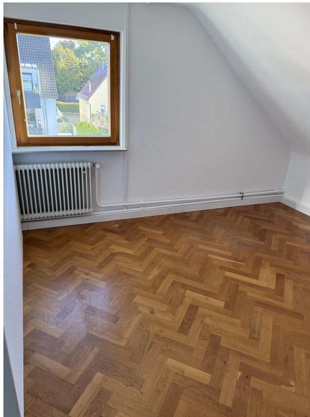
1_Zimmer zur Straße