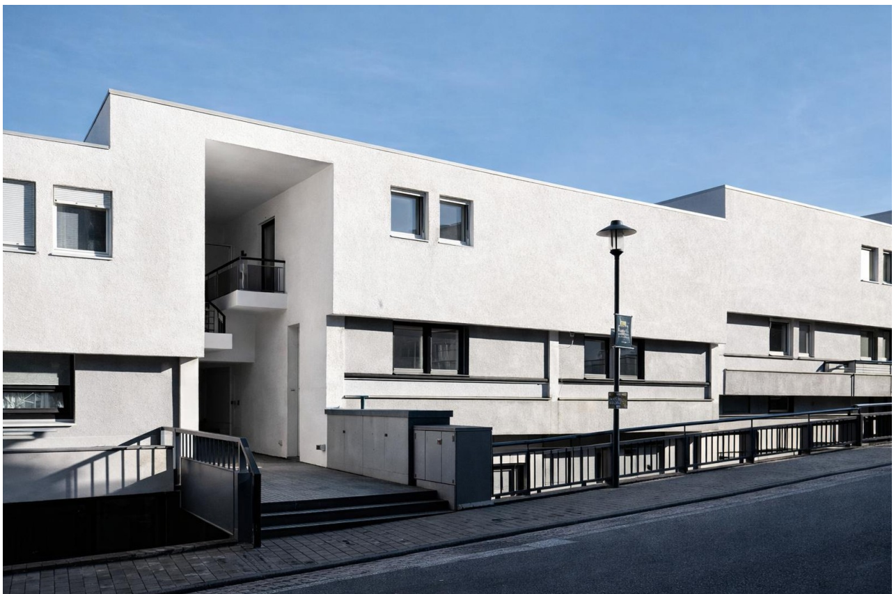
Frontansicht der Wohnanlage