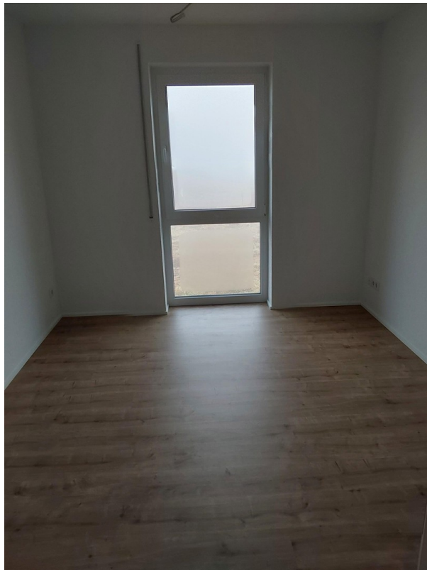
Kinderzimmer 2 in 14a