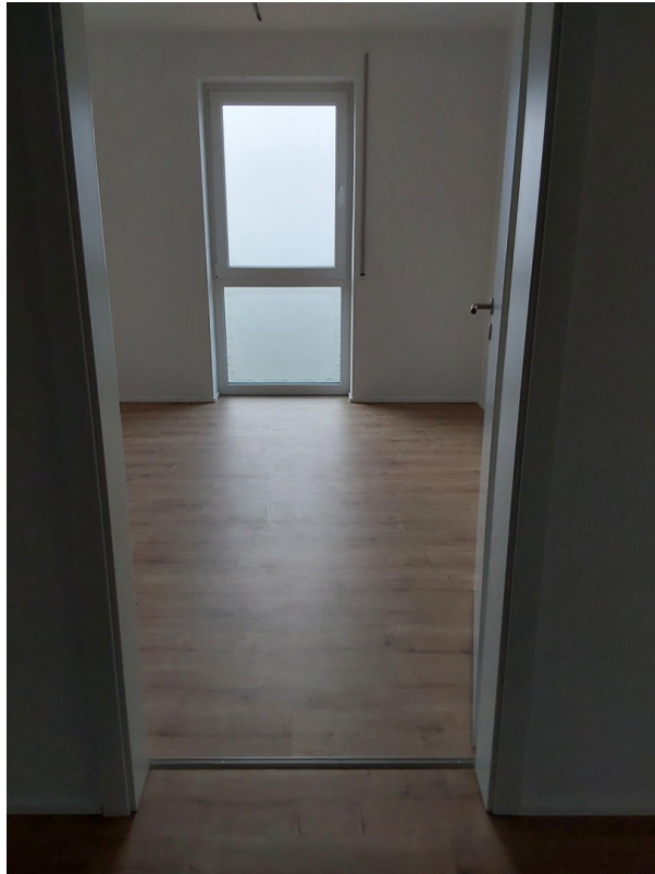
Kinderzimmer 2 in 14b