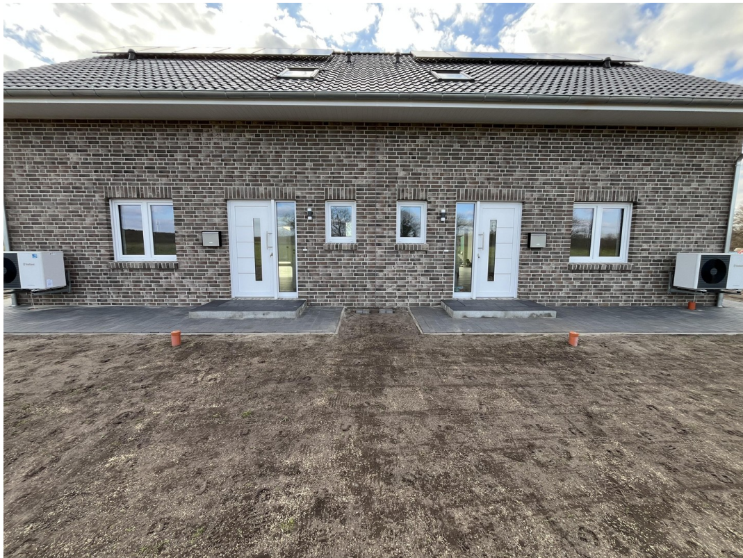
Hauseingänge - Osten