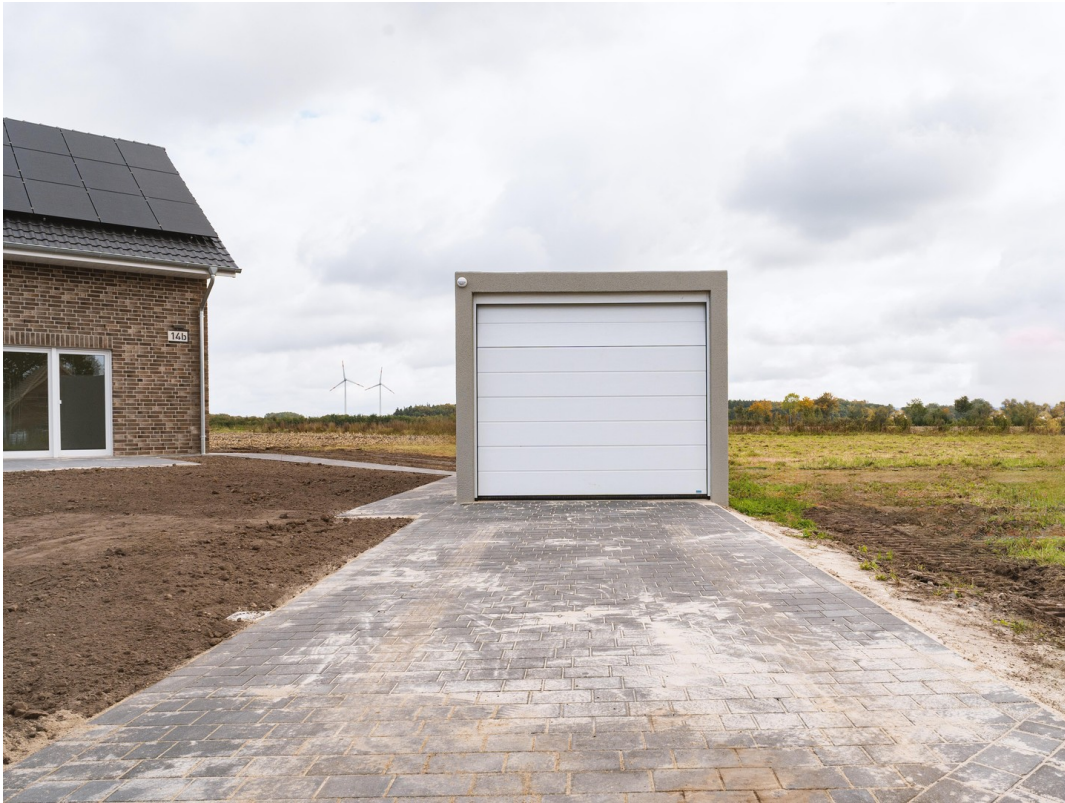
Garage u. Stellplatz 14b