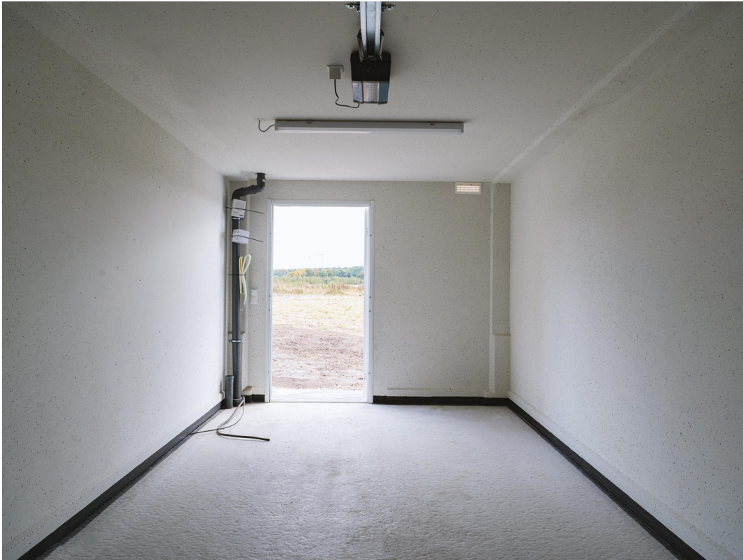
Garage innen 14b