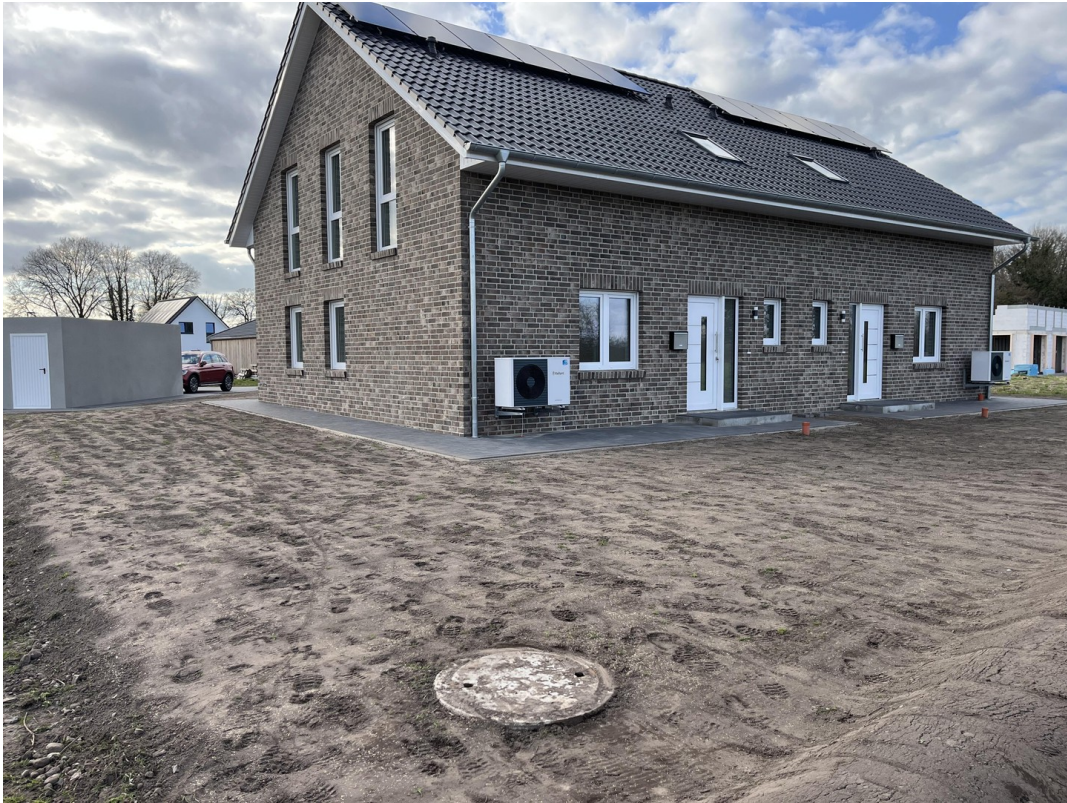
Ansicht Giebel im Süden