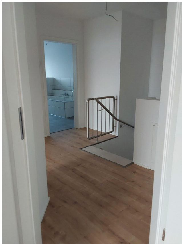
Flur OG 14b