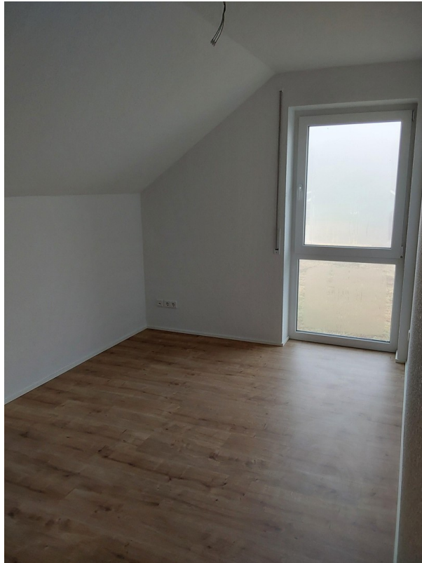
Kinderzimmer 1 in 14a