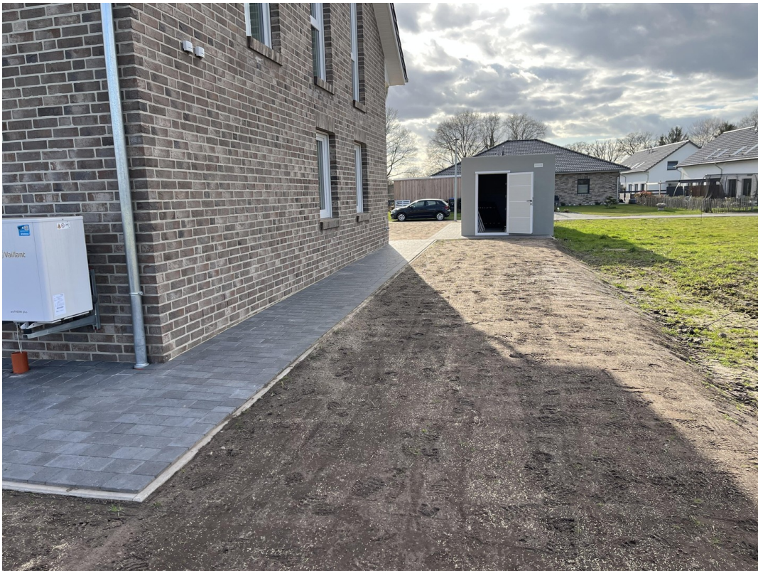
Ansicht Giebel im Norden