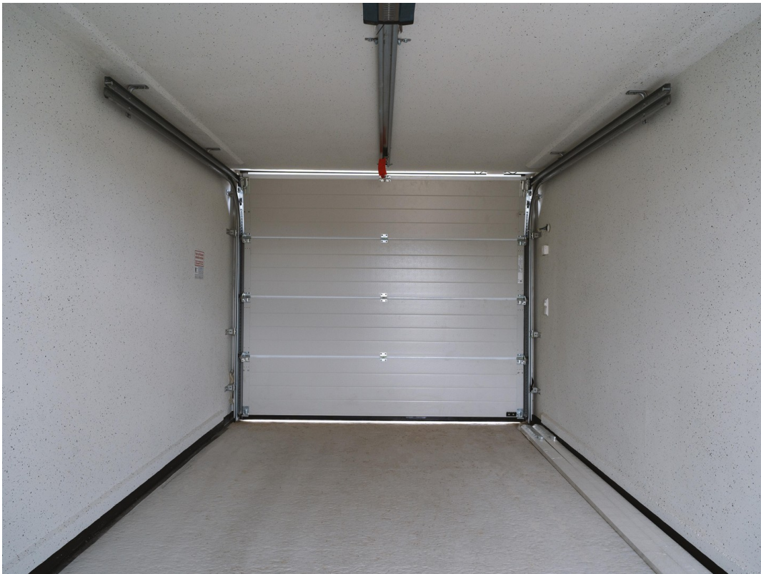
Garage innen 14b