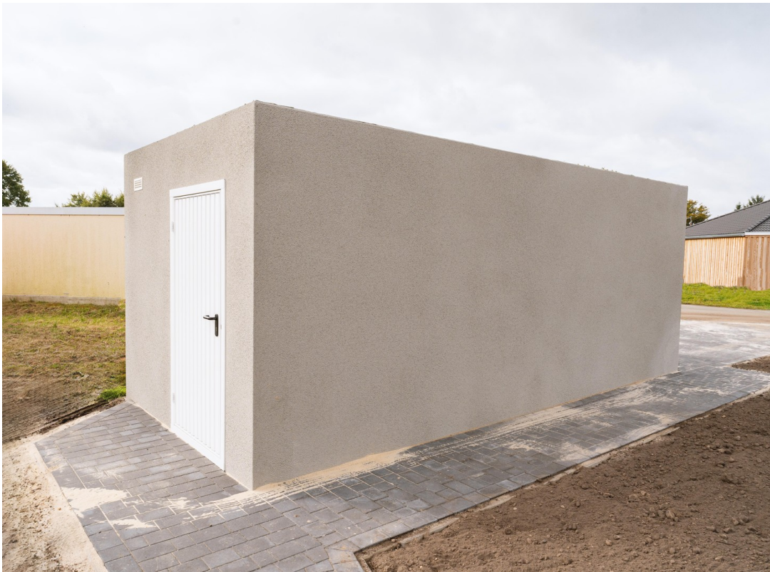
Garage außen 14b