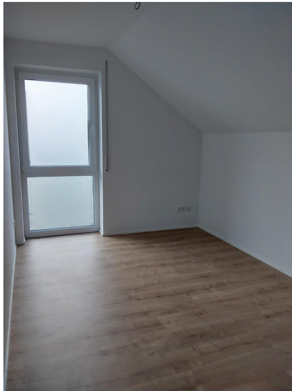
Kinderzimmer 1 in 14b