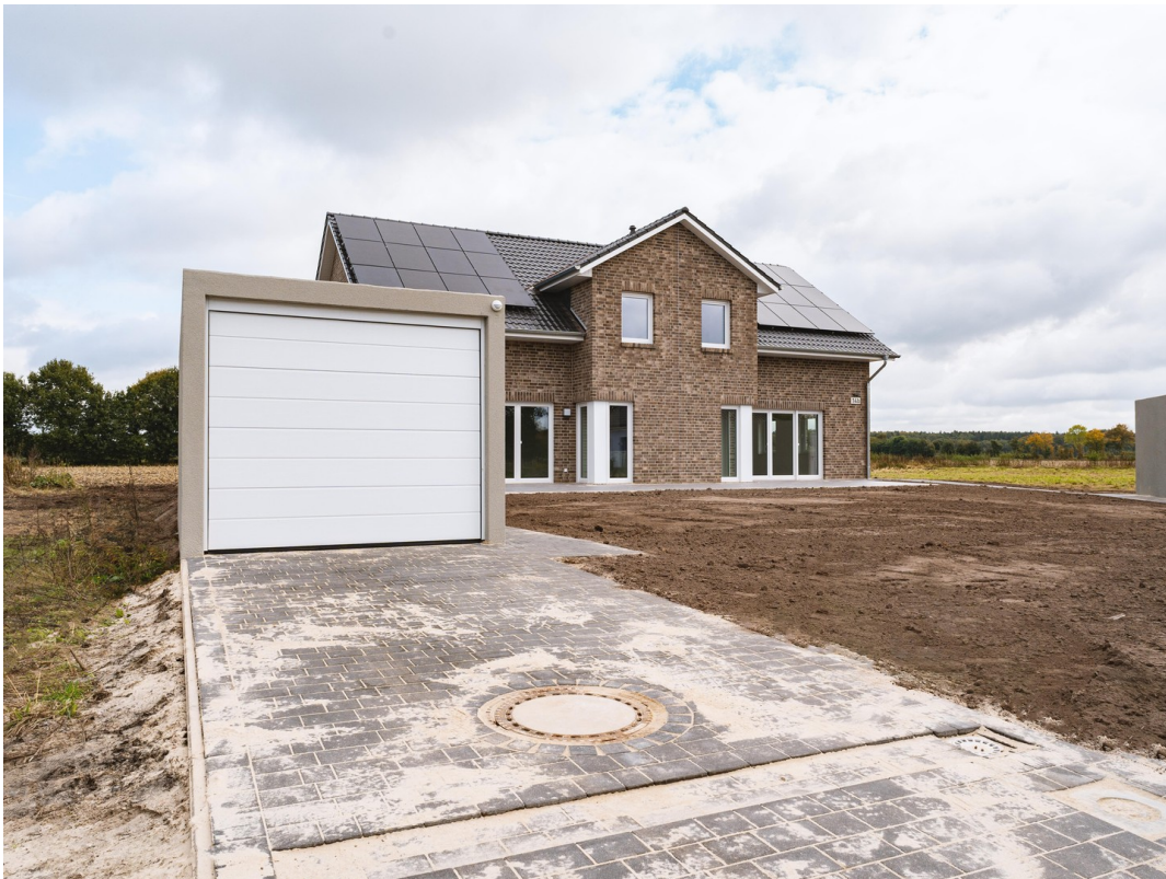
Garage u. Stellplatz 14a