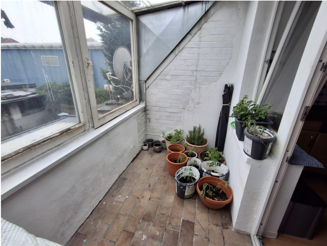
Balkon 1. OG