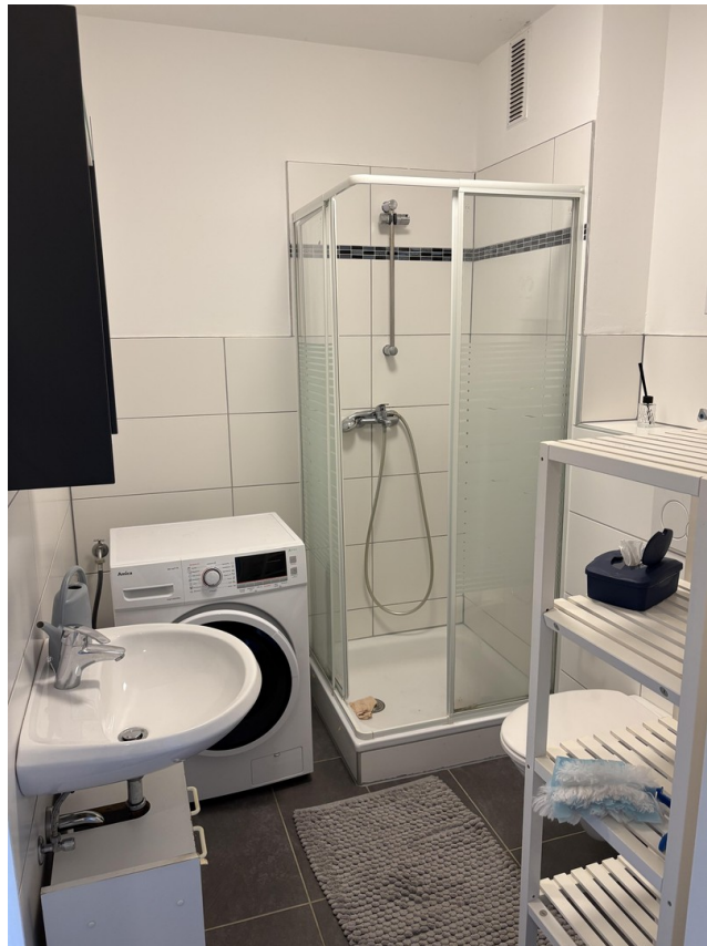
Bad mit Waschmaschine