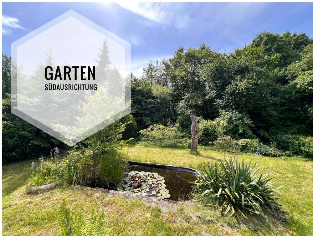
Garten / Ausblick