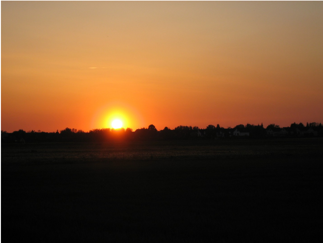
Sonnenuntergang vom gr. Balkon