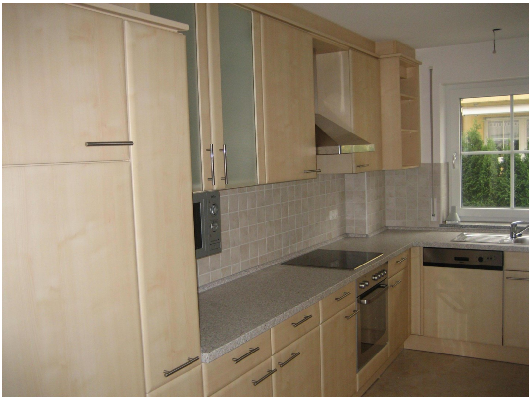
EBK Typ A | Ablöse