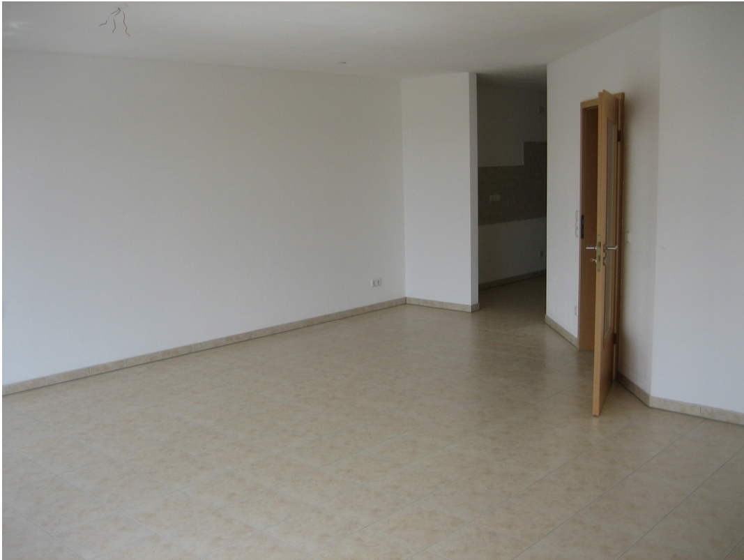
Wohnzimmer Ri. Küche