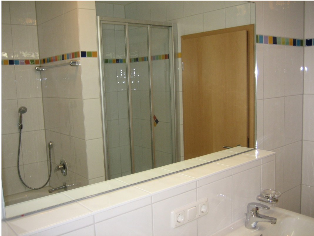
Bad | Dusche, Wanne etc.