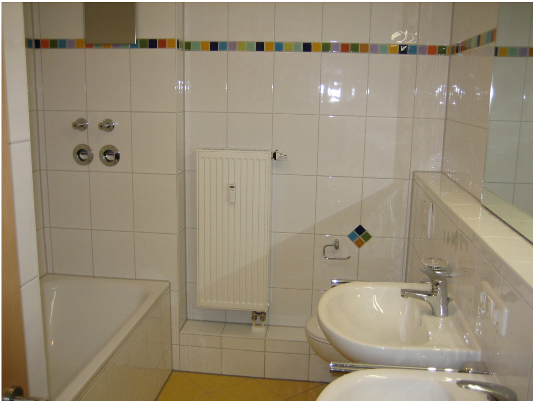
Bad | 2 Waschtische, WC, etc.