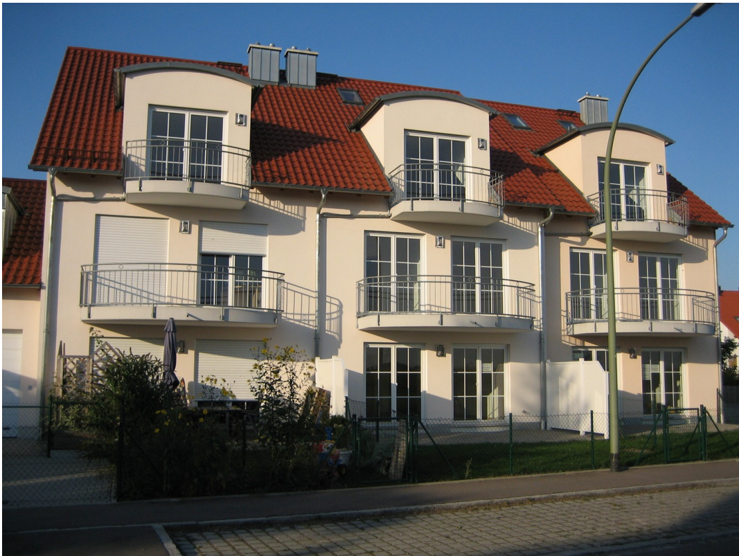
Gesamtansicht v. Süden