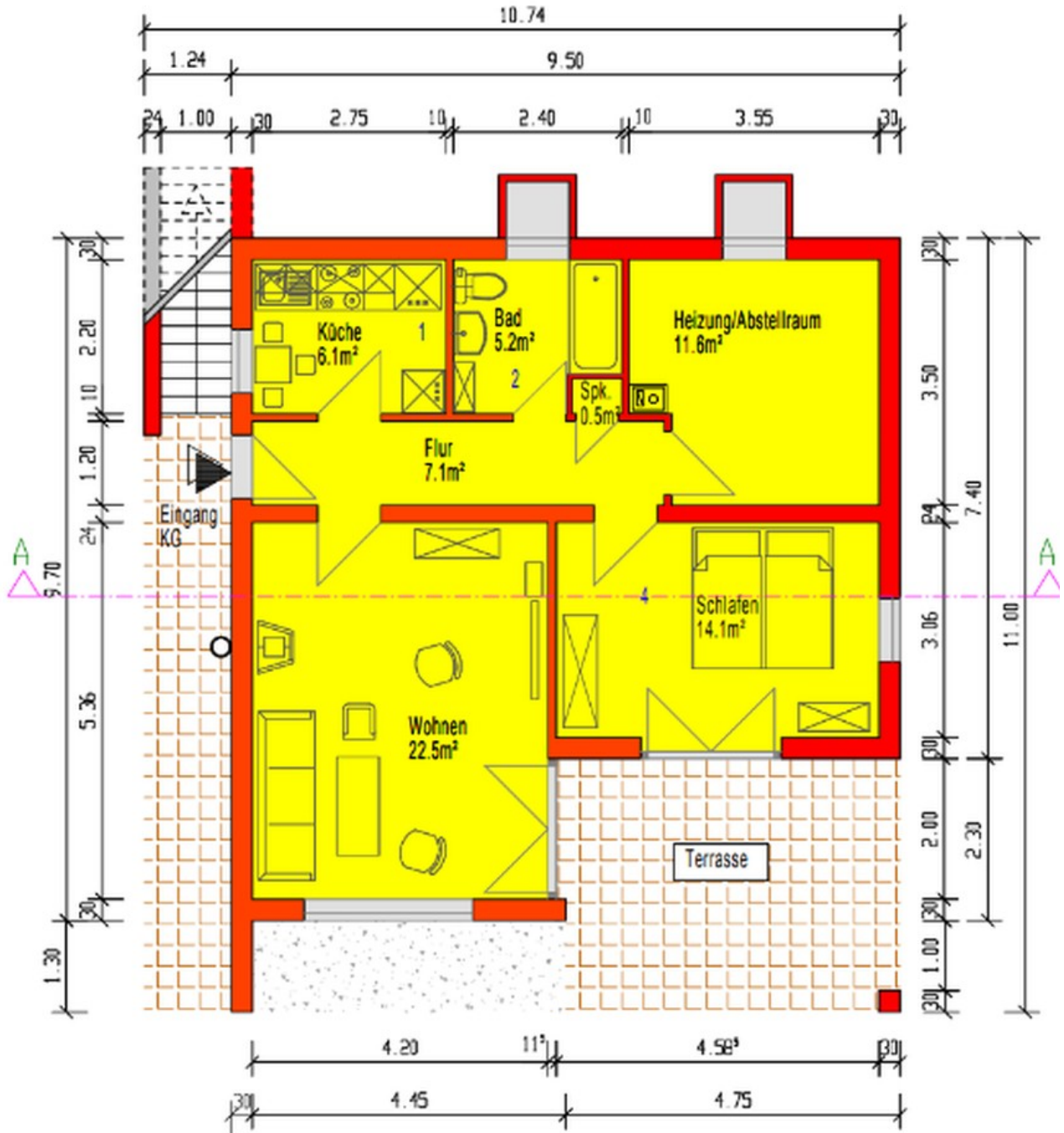
Grundriss KG M.1:100