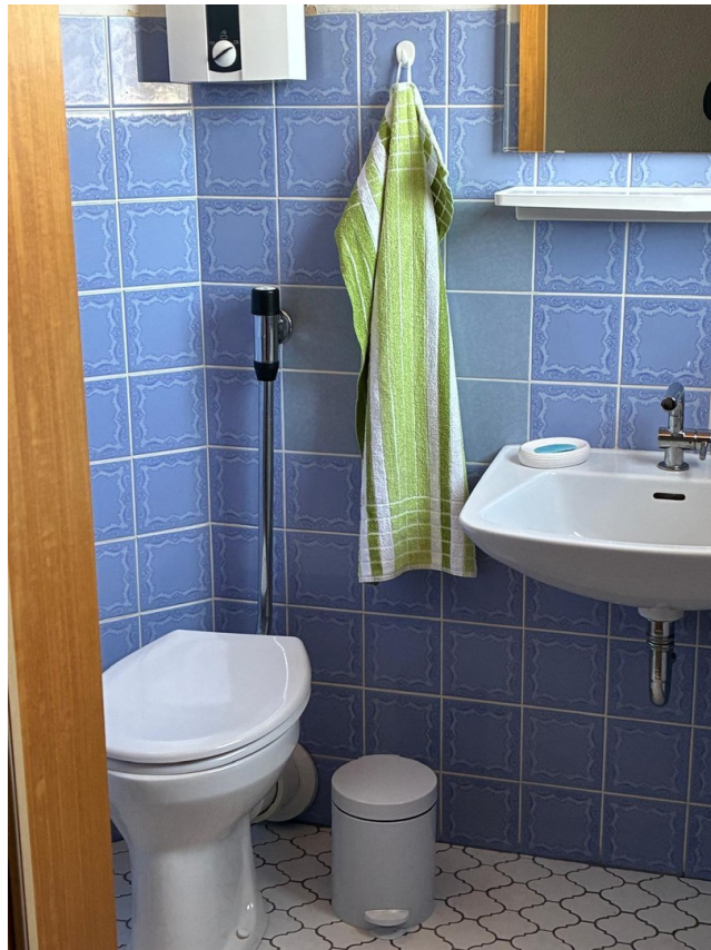
Gäste WC EG