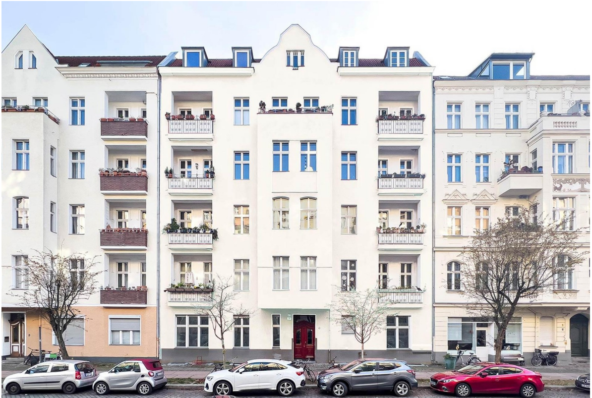
Fassade nach Sanierung