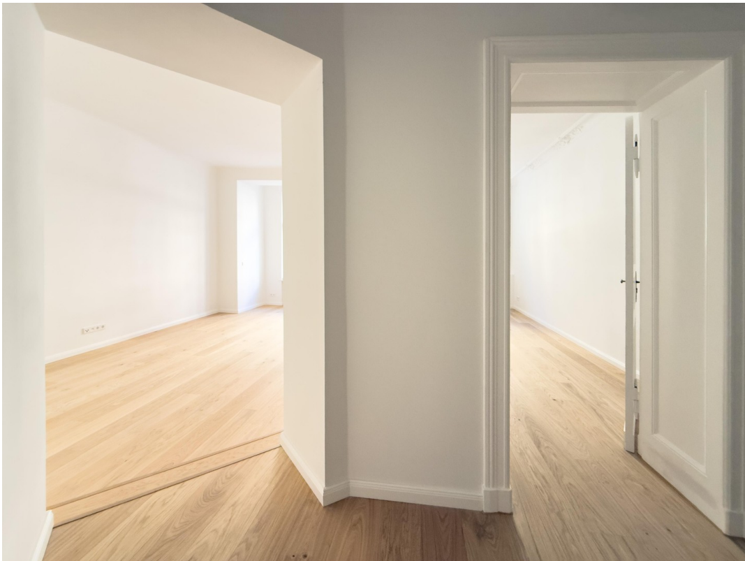
Blick in die Zimmer