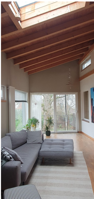
Wohnzimmer / Ausblick Garten