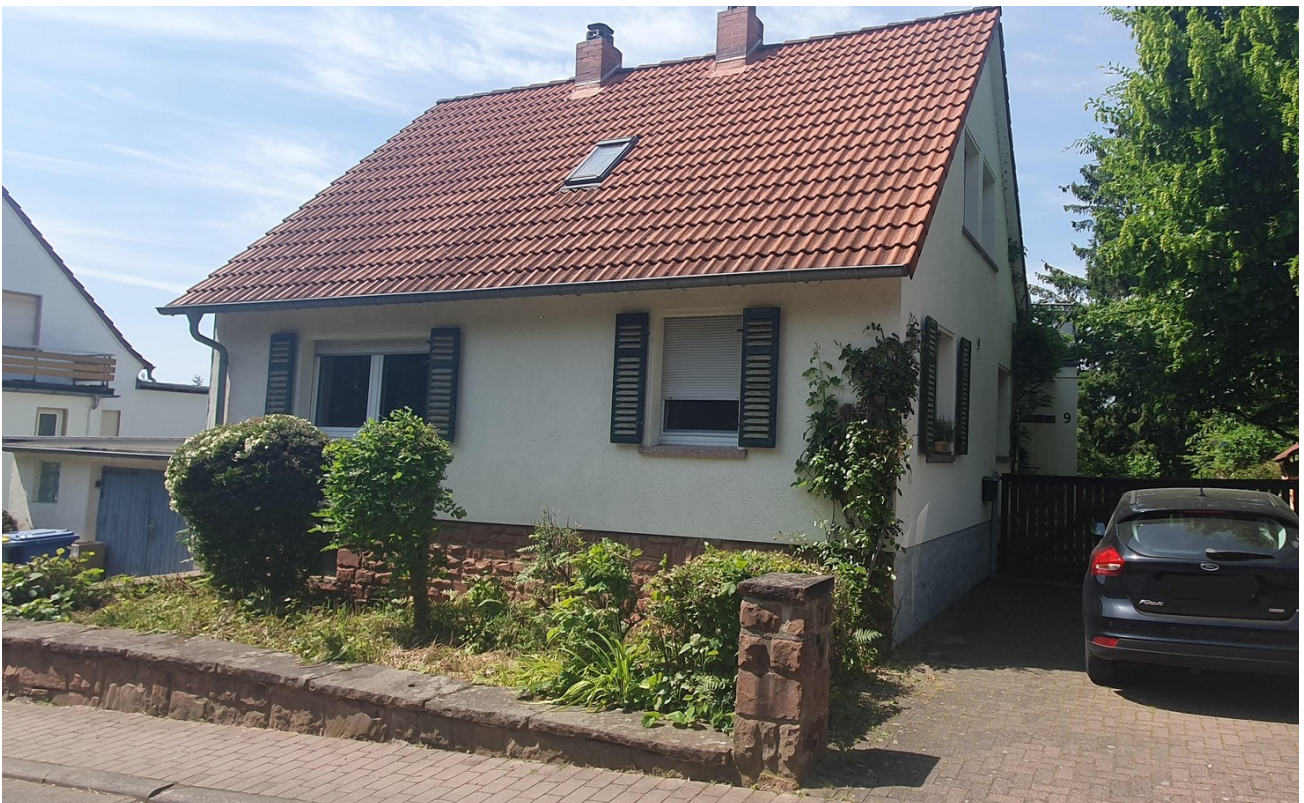
Seitliche Ansicht Haus