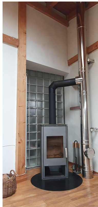
Wohnzimmer / Kamin