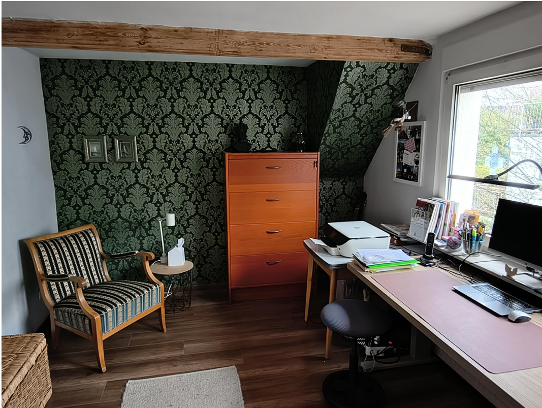
Kinderzimmer 2 Obergeschoss