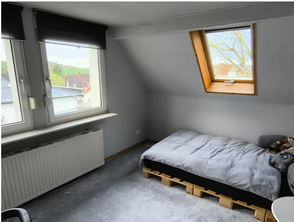
Kinderzimmer 1 Obergeschoss