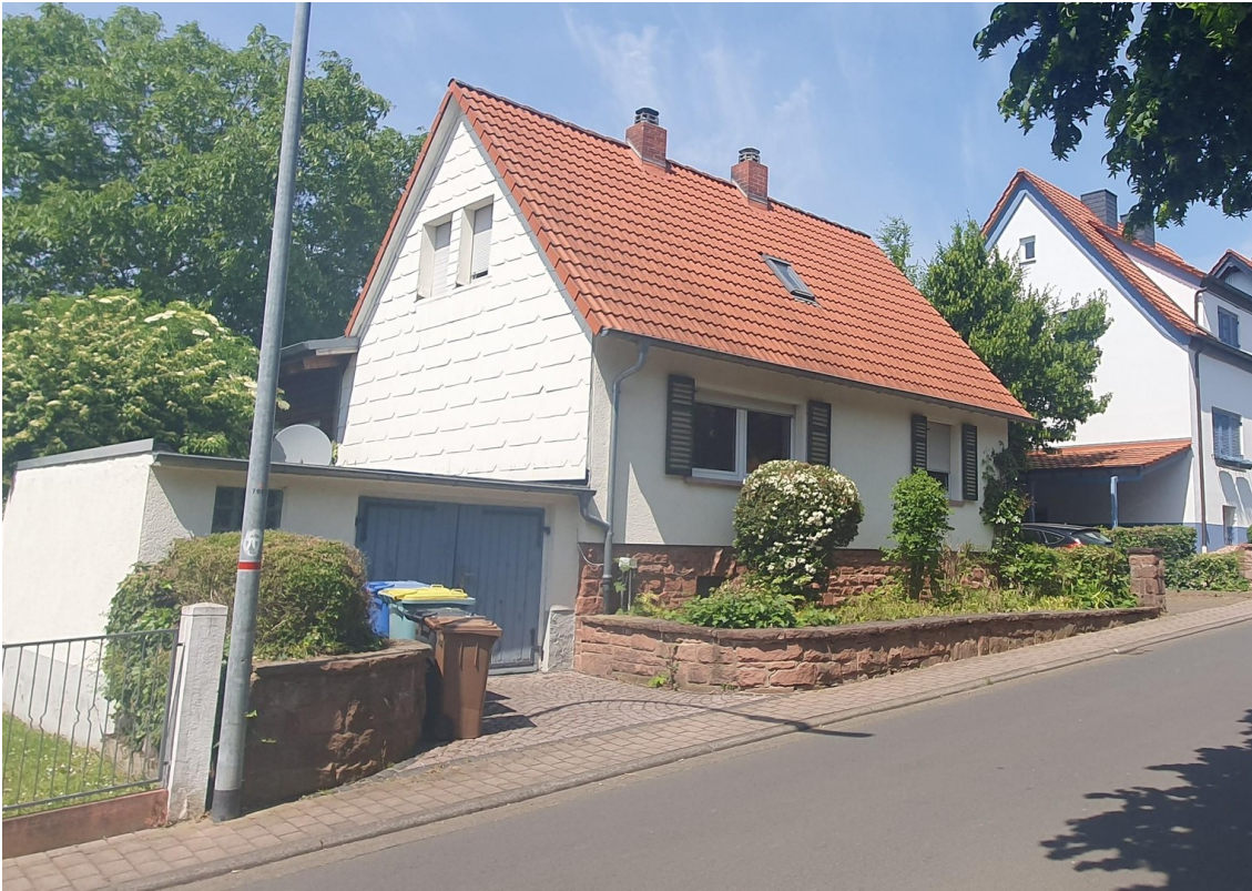
Seitliche Ansicht Haus