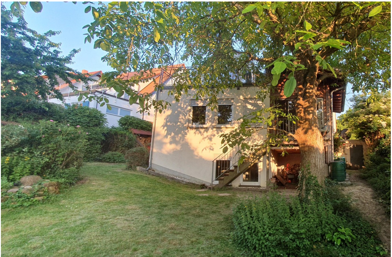
Rückseite Haus / Gartenansicht