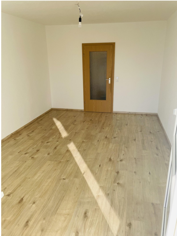
Wohnzimmer Blick zum Flur