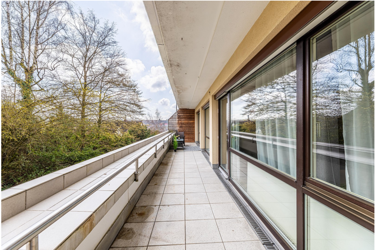
Balkon mit Blick ins Grüne