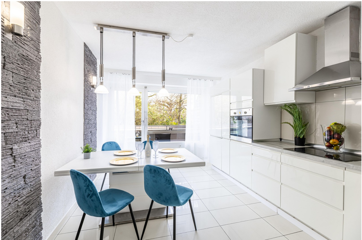
Küche mit Zugang zum Balkon