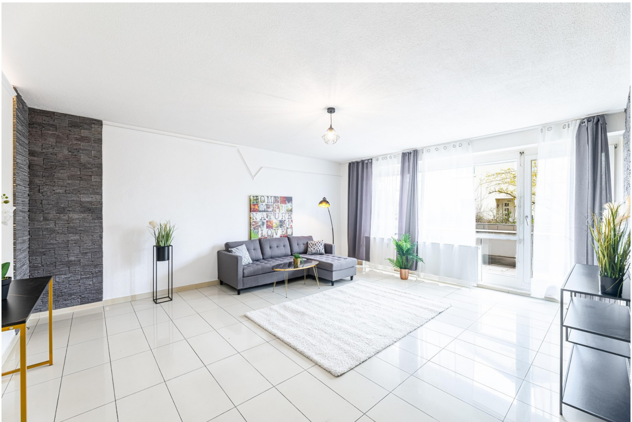
Geräumiges helles Wohnzimmer