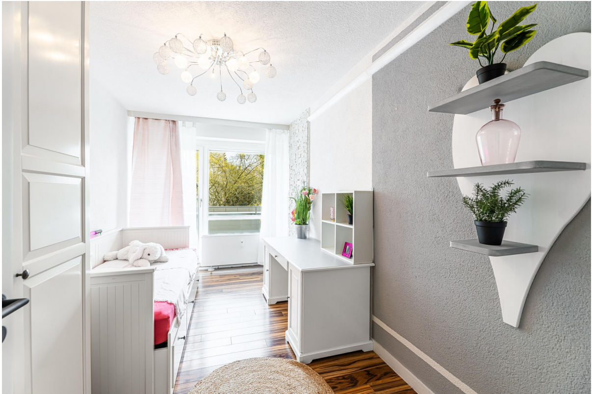
Helles Kinderzimmer mit Balkon