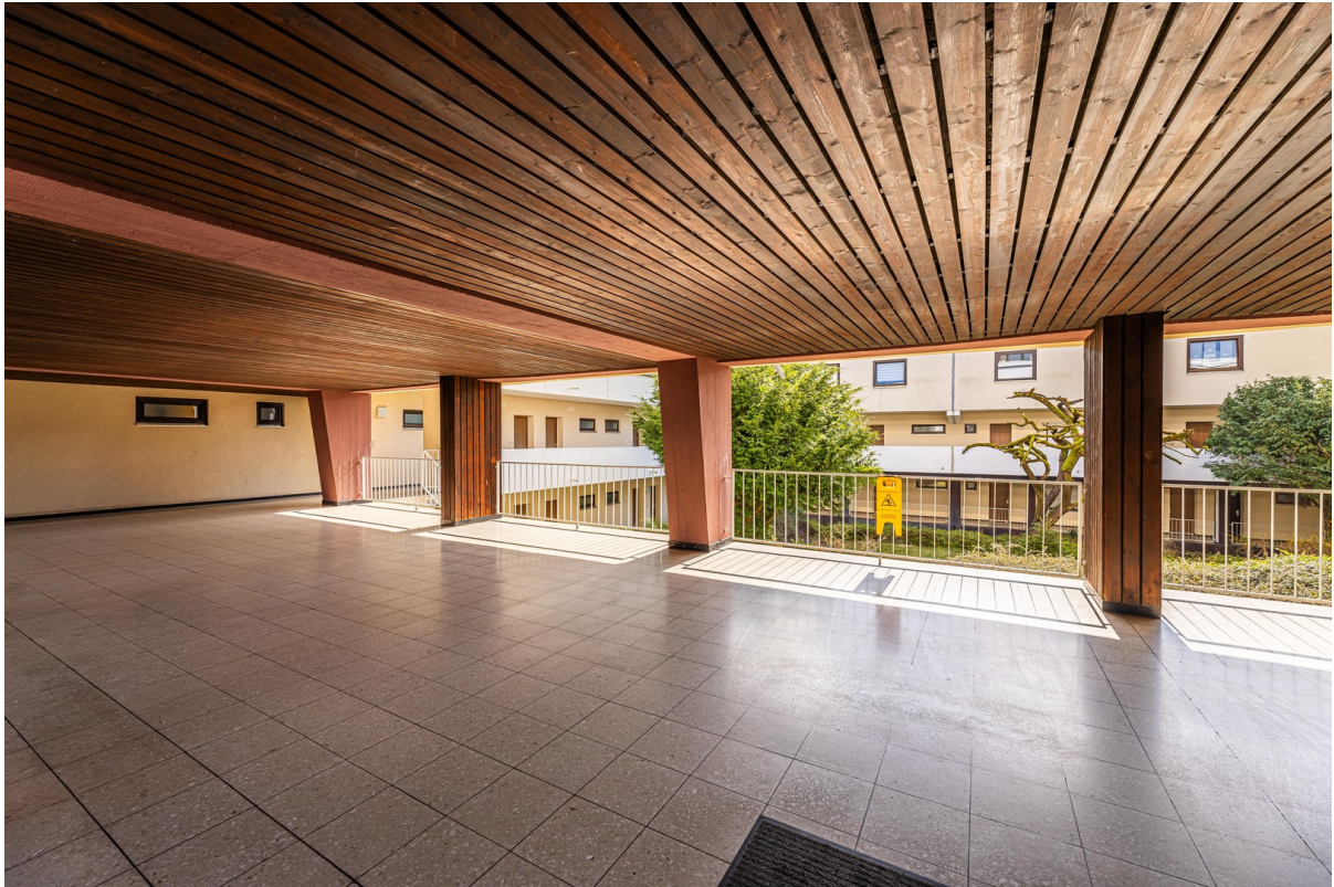
Hauseingang mit Blick zum Hof