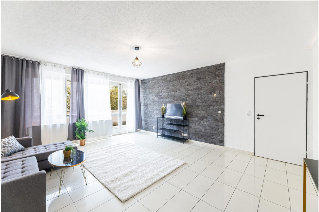
Wohnzimmer mit Balkonzugang