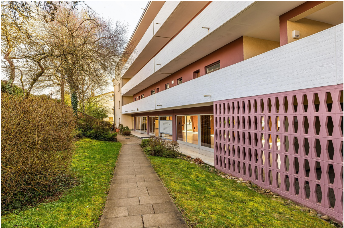
Barrierefreier Zugang zum Haus