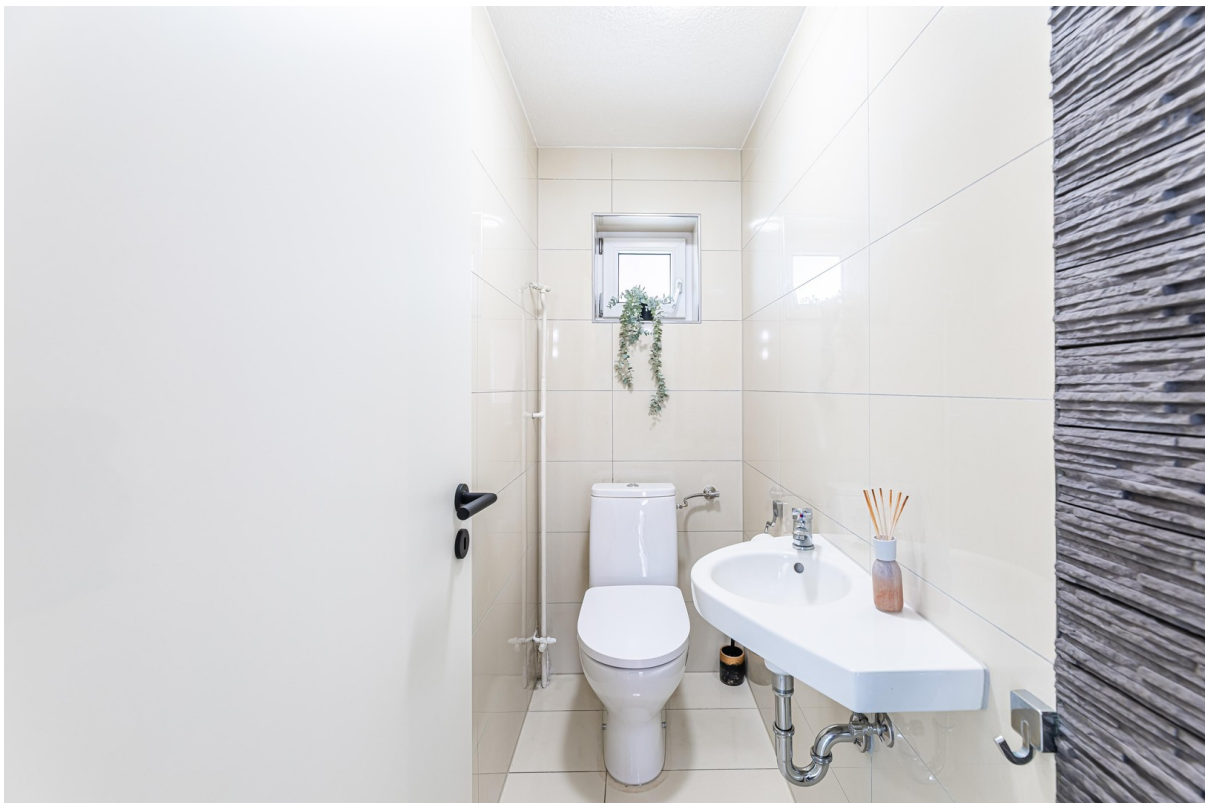
Separates WC mit Fenster