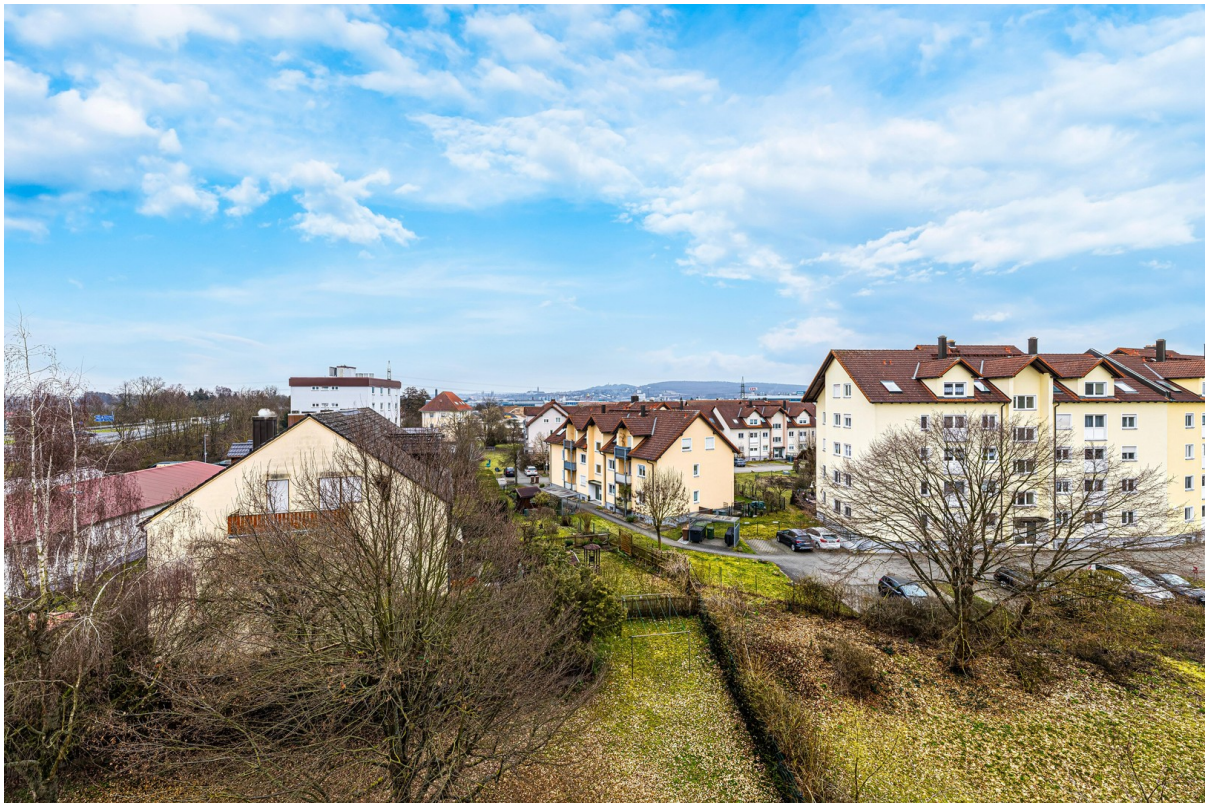
Blick vom Balkon in Garten