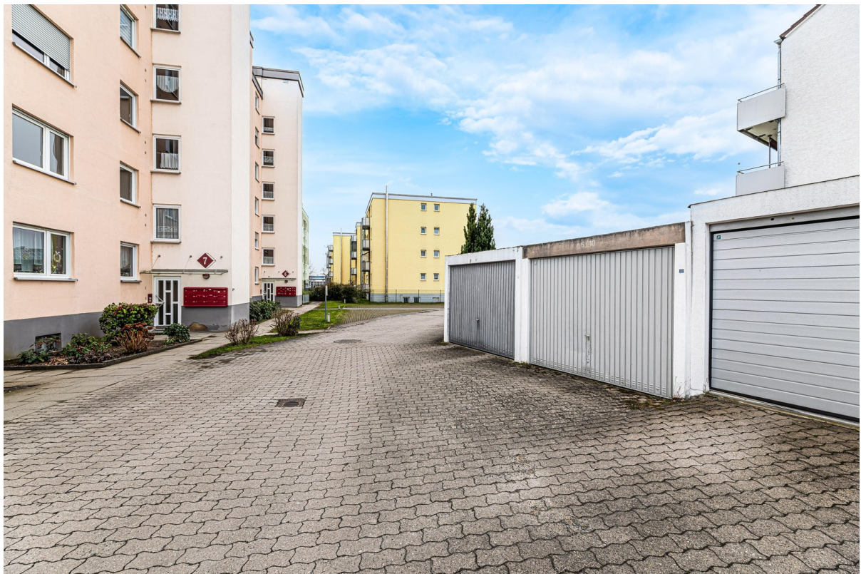
Garage direkt vor dem Haus