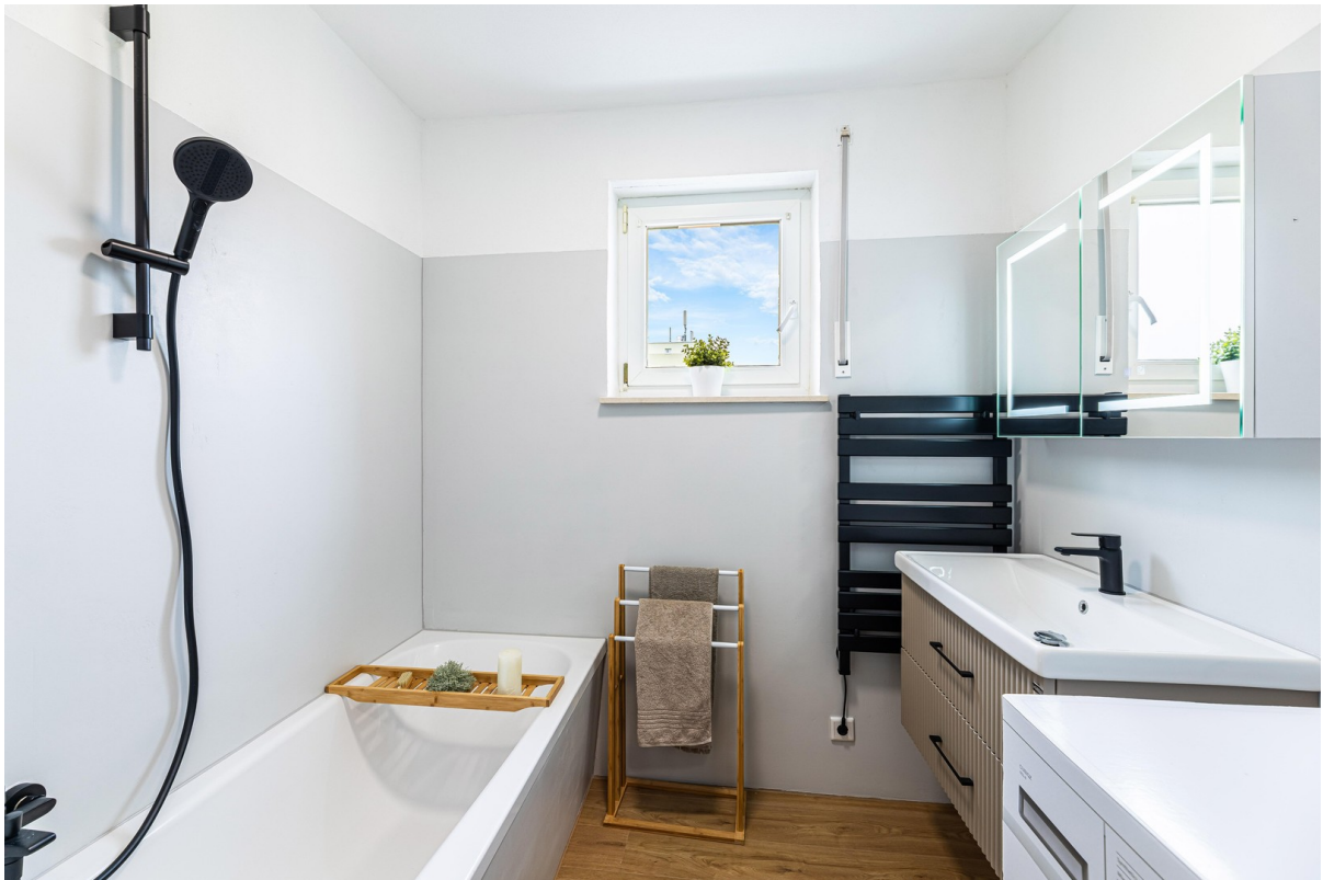
Tageslichtbad mit Badewanne