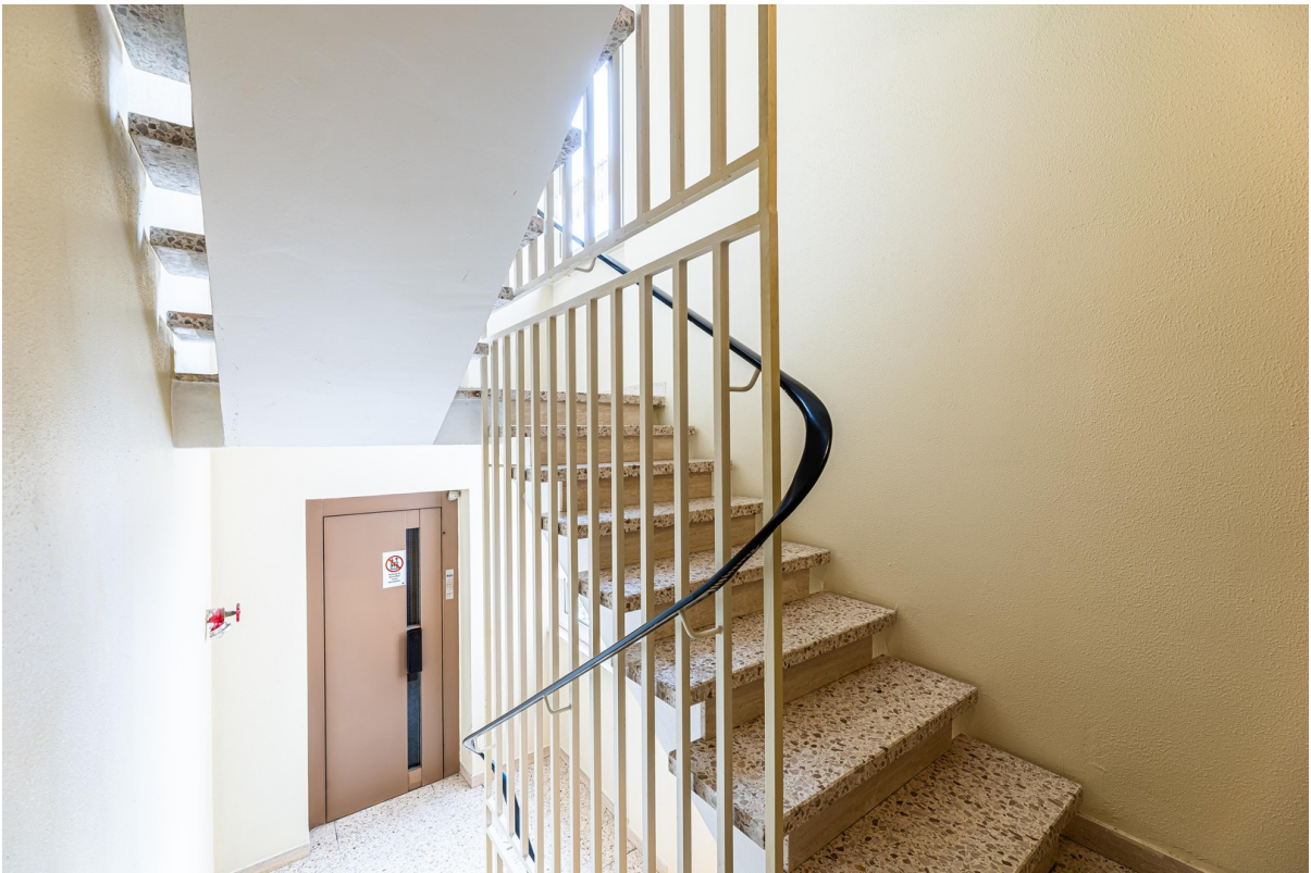
Treppenhaus mit Aufzug