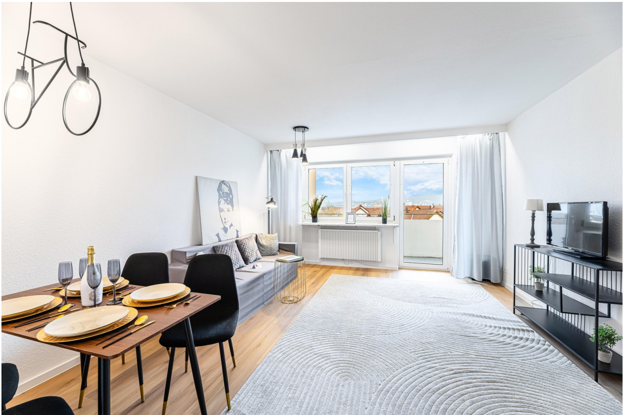
Helles Wohnzimmer mit Balkon