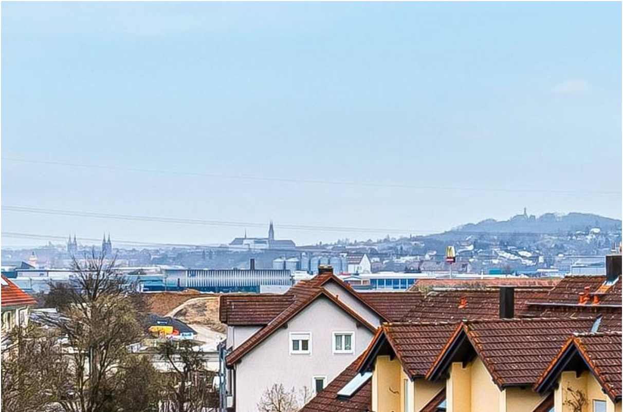
Blick auf Dom und Michaelsberg