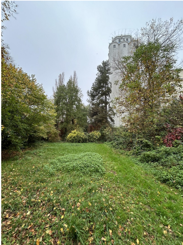
Außenbereich Mühle (Garten)