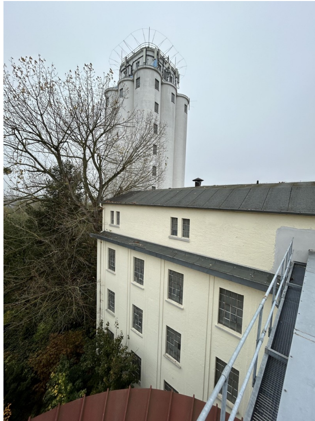
Außenansicht Mühle & Turm