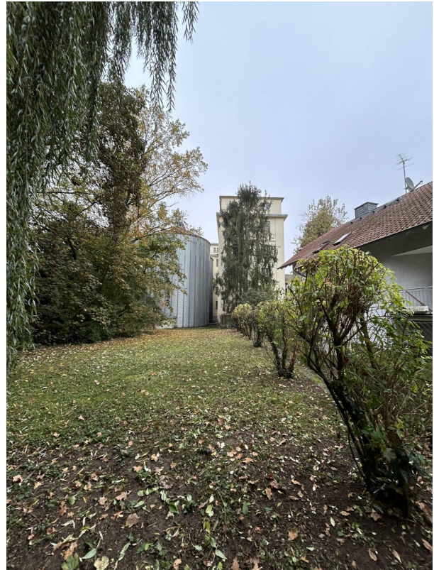
Außenbereich Mühle (Garten)