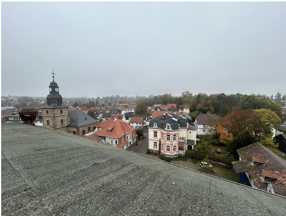
Fernblick vom Dach d. Mühle