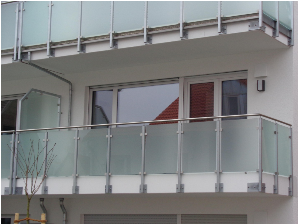
Balkon 8 qm