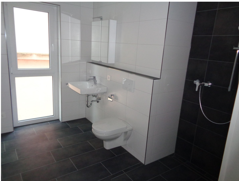
Bad / Dusche (noch ohne Glas)