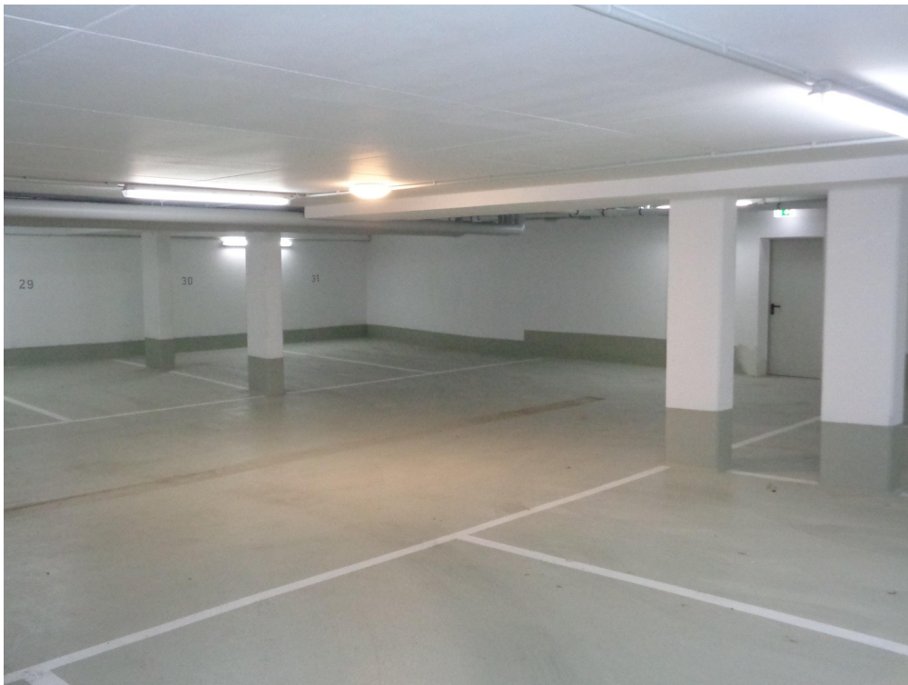
TG Stellplatz № 30