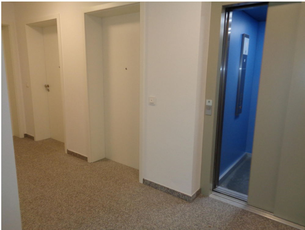
Aufzug. 2. Türe links = Wohn.