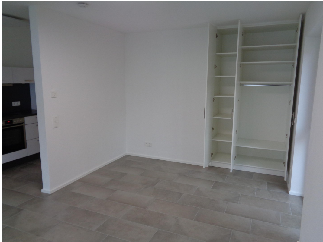
Wohnraum mit Einbauschränk