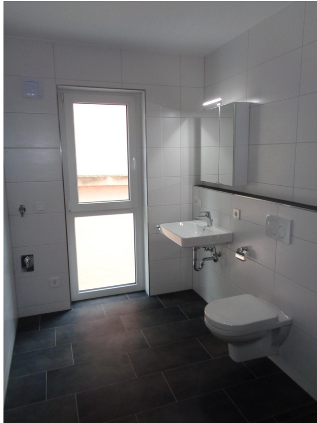
Bad mit Waschm. Anschluss