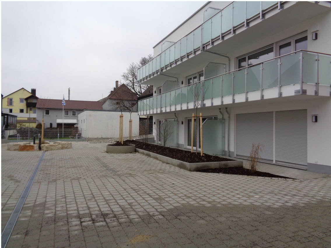
Westseite 1. Stock rechts