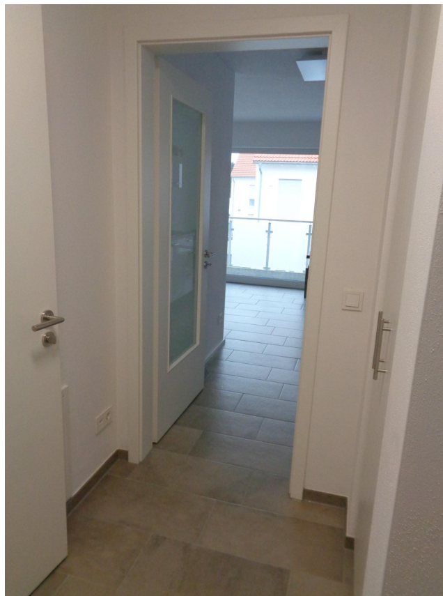
Diele Ri. Wohn-/Schlafraum