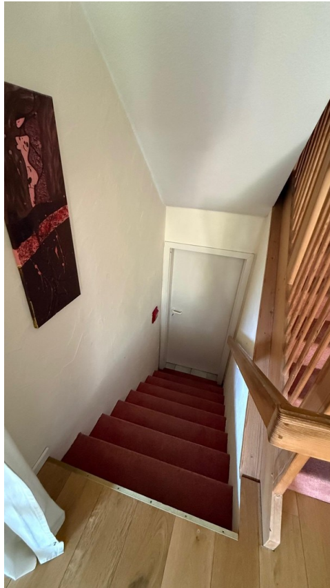
Treppe zum Keller