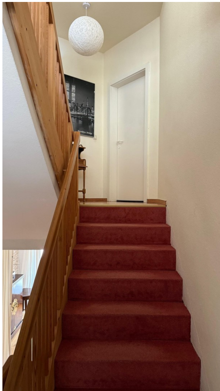
Treppe zum ersten Stock