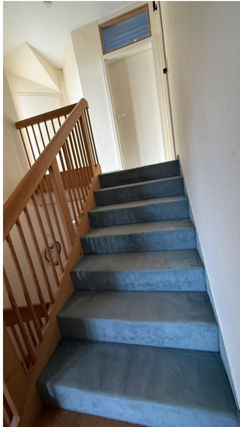
Treppe zum dritten Stock