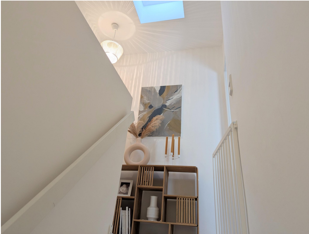
Flur mit Oberlicht