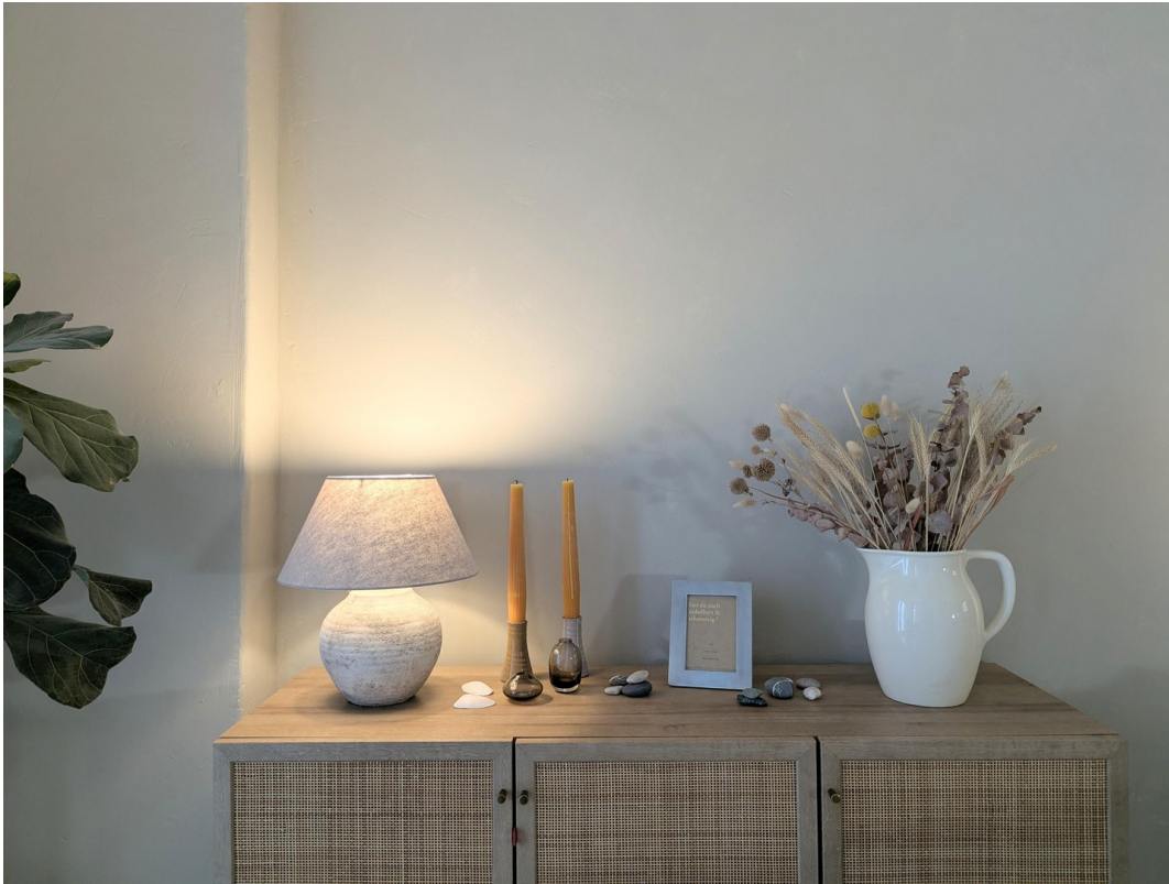
Liebe zum Detail