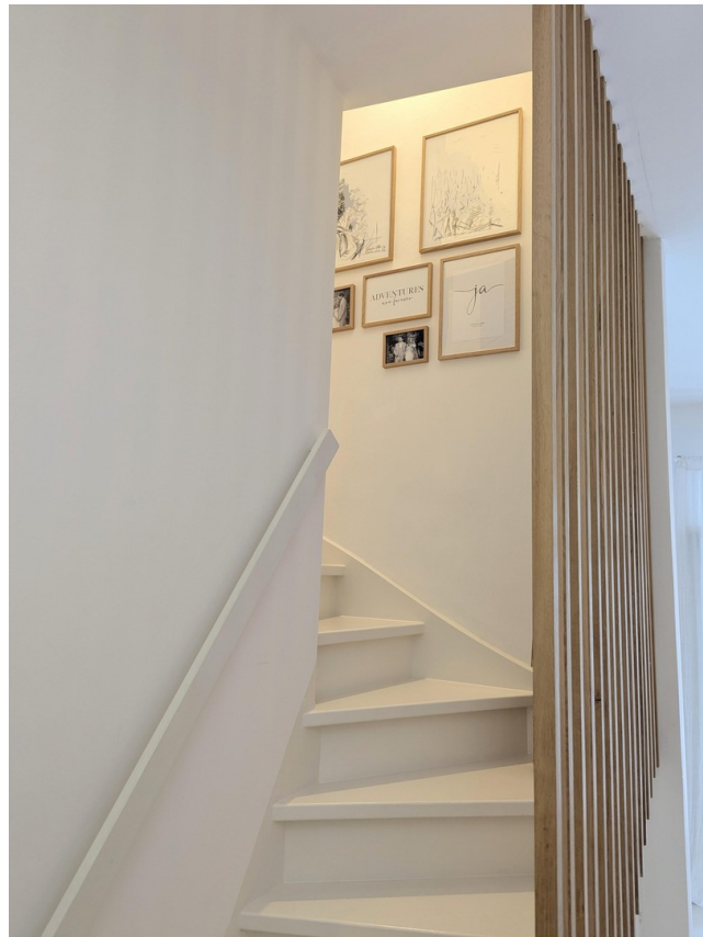
Treppe nach oben