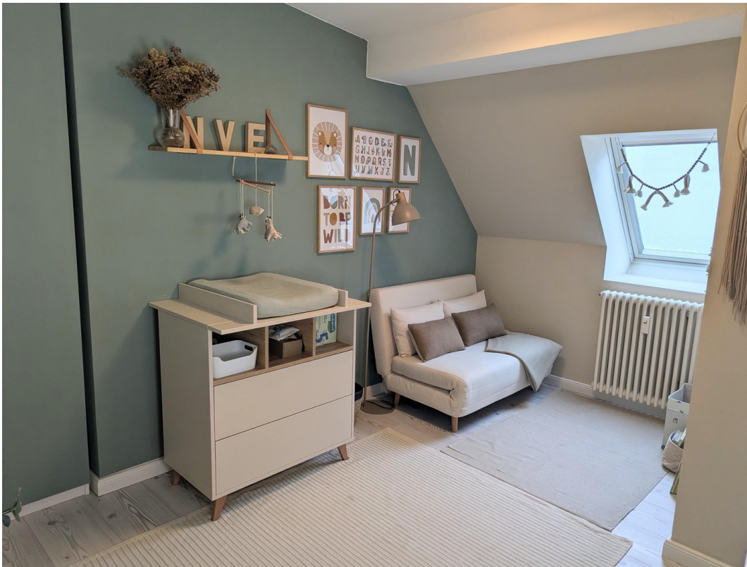
Schlafzimmer 2 mit Dachfenster