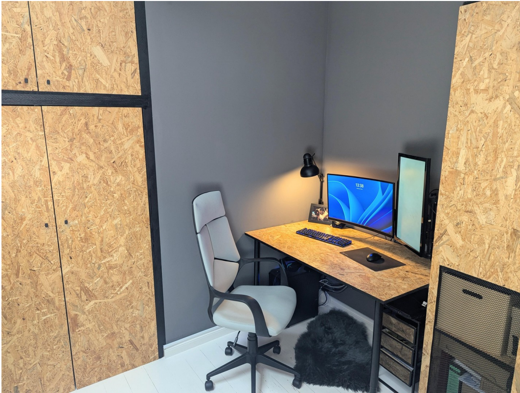
Arbeitszimmer mit Oberlicht