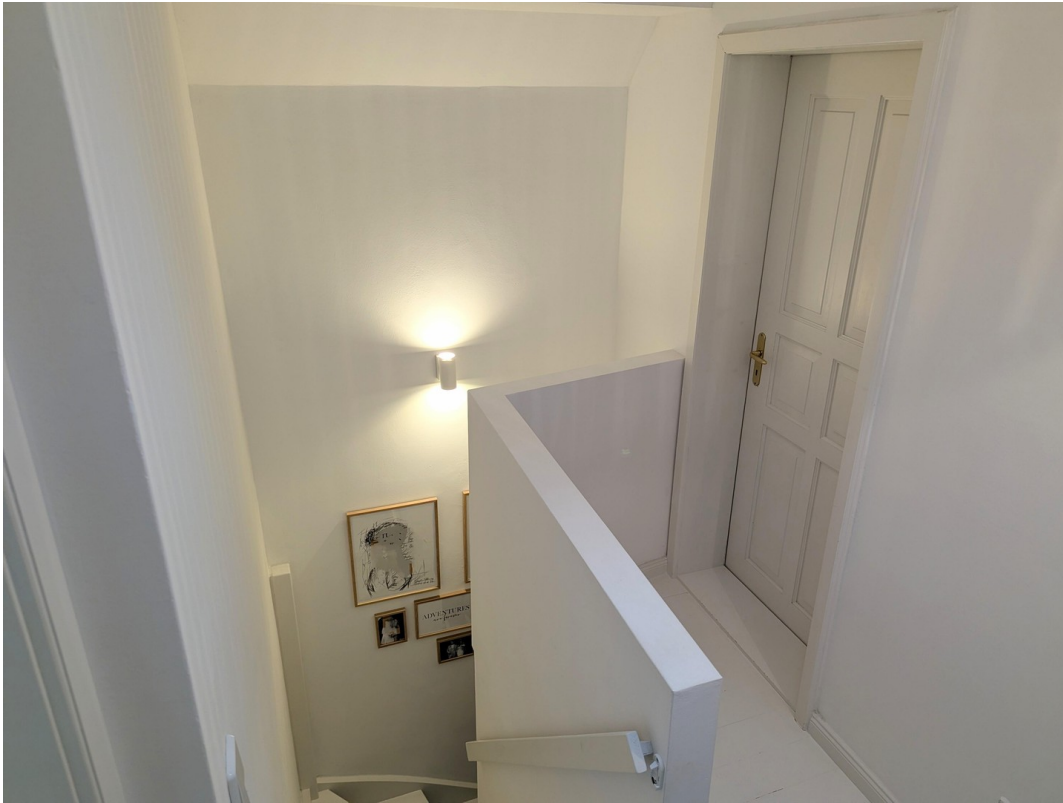
Flur oben Schlafzimmer 1