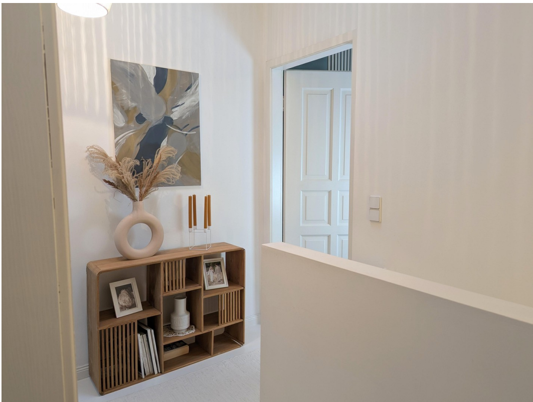
Flur oben Schlafzimmer 2