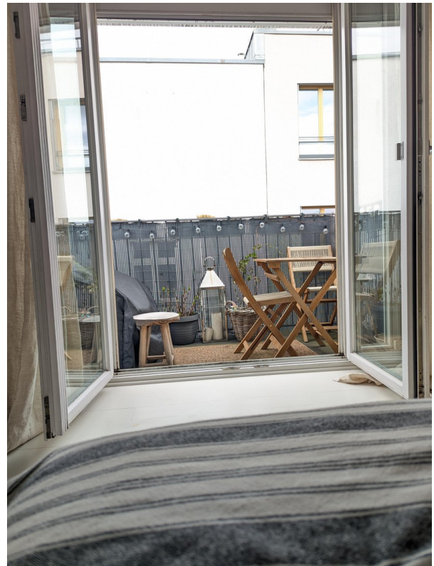
Blick auf den Balkon