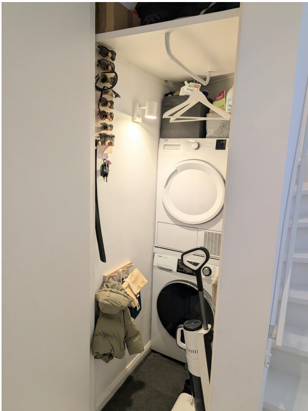
Garderobe mit WM und Trockner