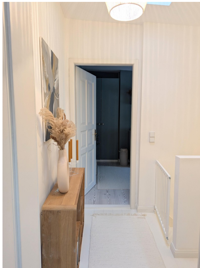
Flur Richtung Schlafzimmer 2