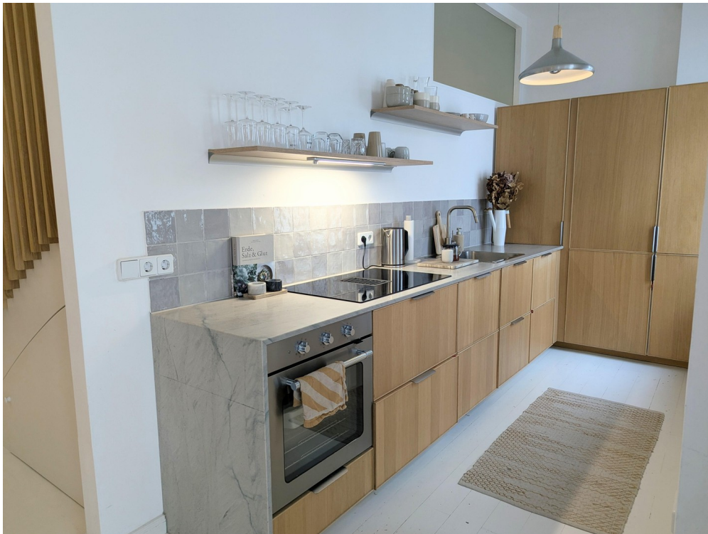
Küche mit Natursteinplatte