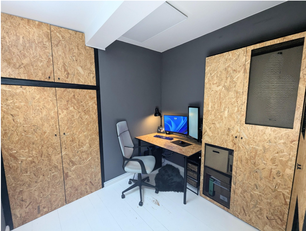
mit Schränken und Schreibtisch