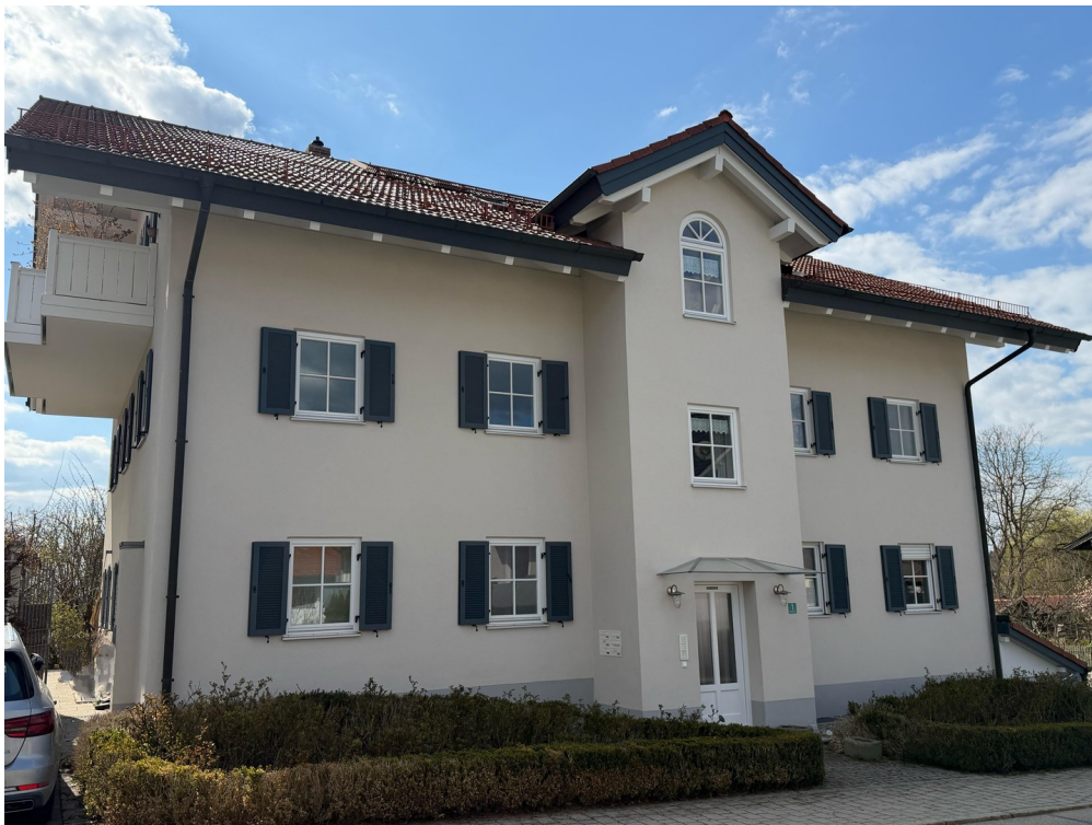
Eingang mit Rosenbeet