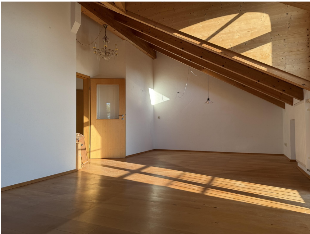
Wohn- / Esszimmer