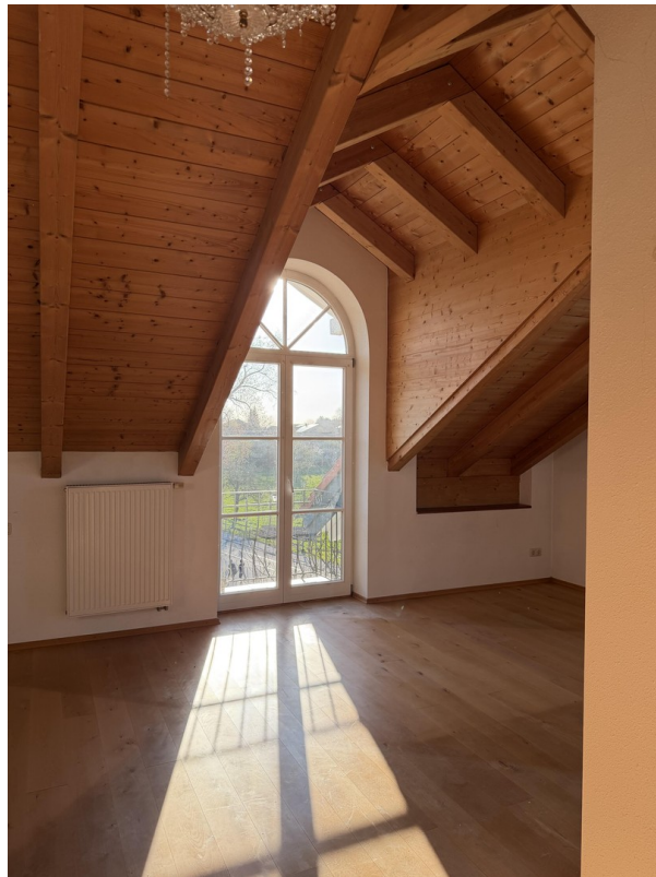
Wohn- / Esszimmer