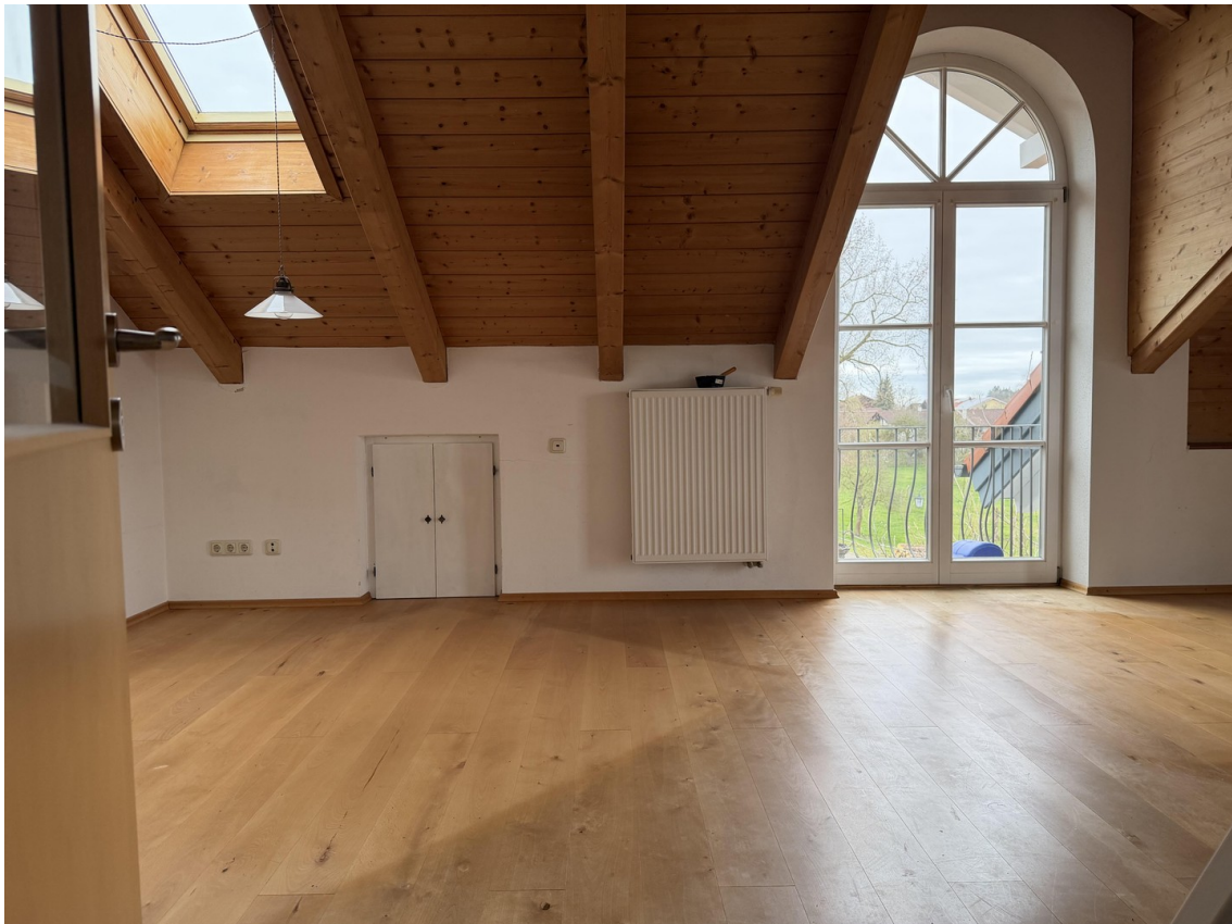
Wohn- / Esszimmer