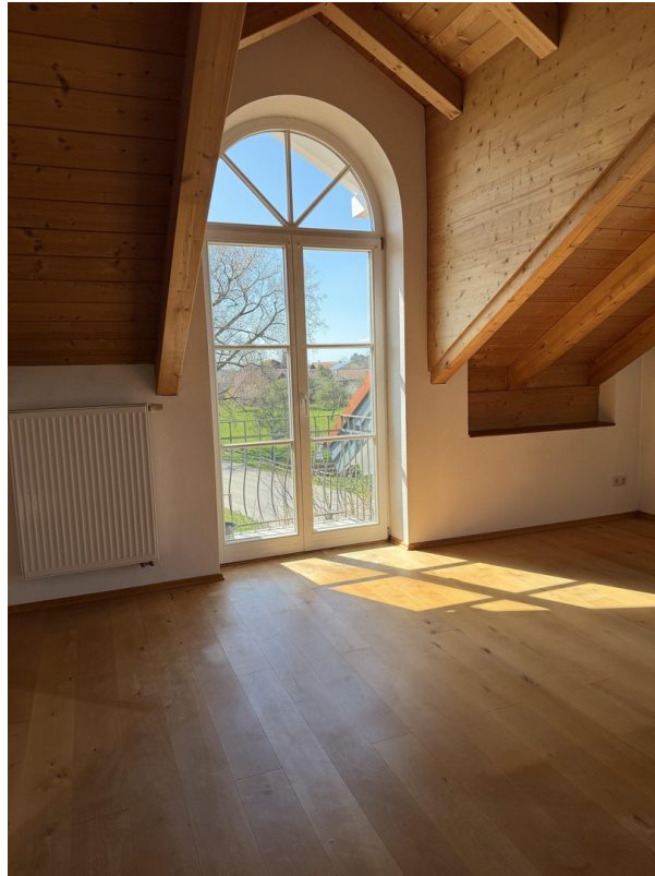
Wohn- / Esszimmer