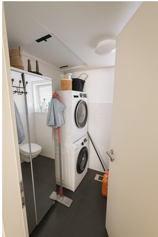
Gäste WC / Abstellraum