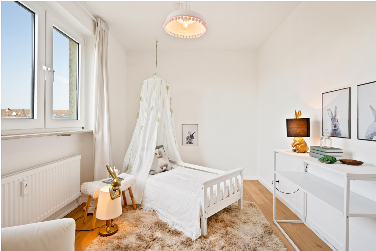
Arbeitszimmer / Kinderzimmer