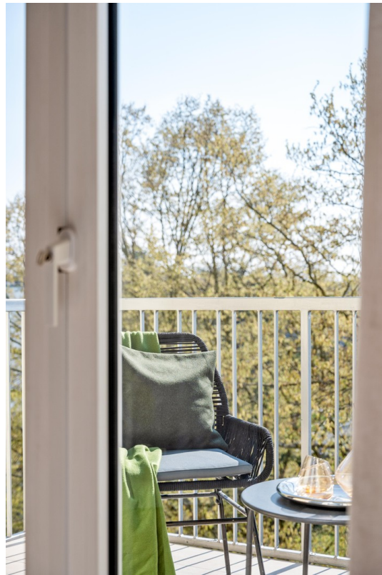
Schlafzimmer mit Balkonzugang