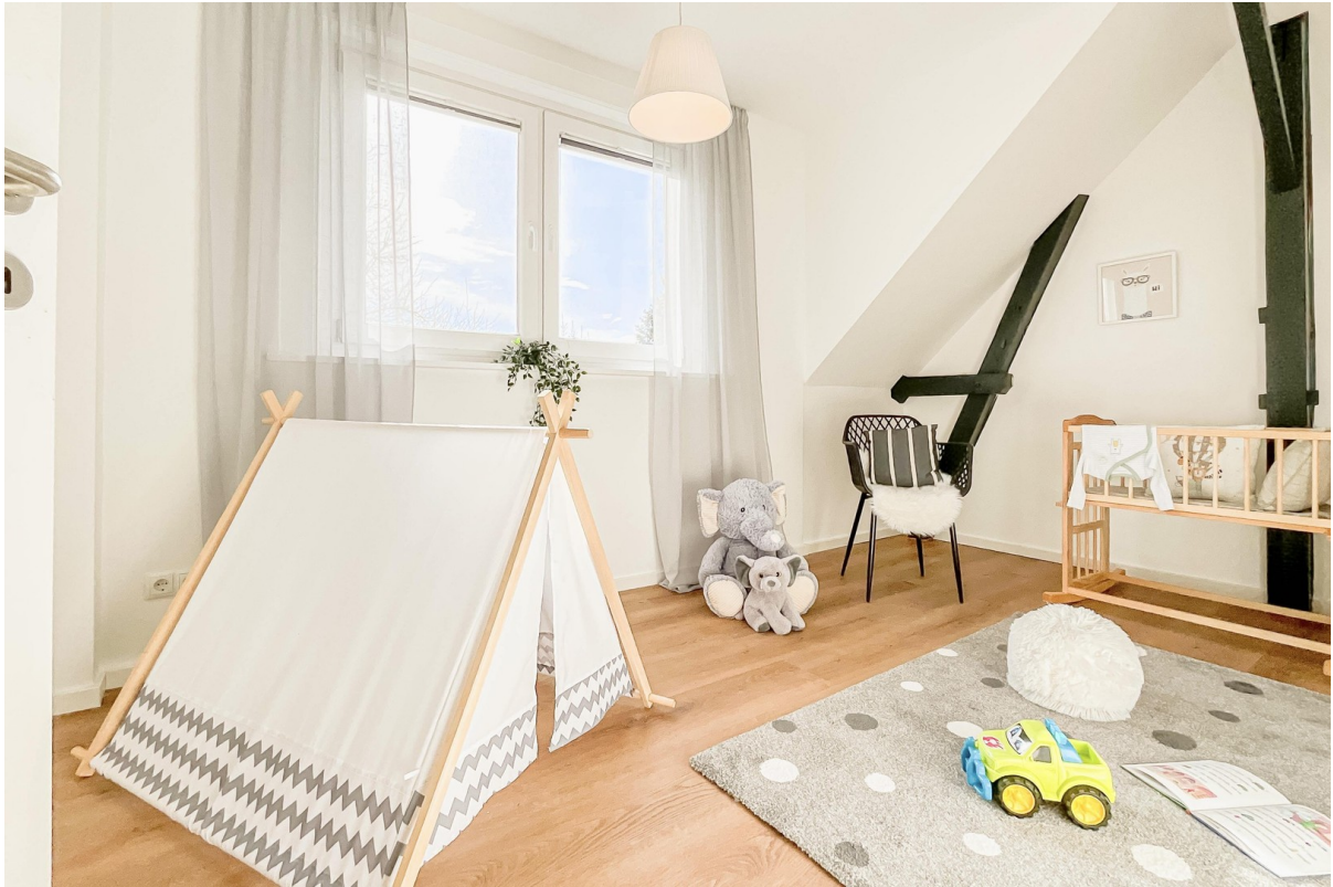
Kinderzimmer 2 OG