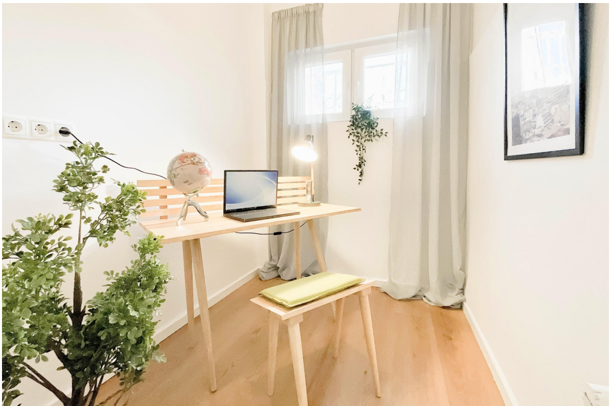
Halbes Zimmer / Arbeitszimmer