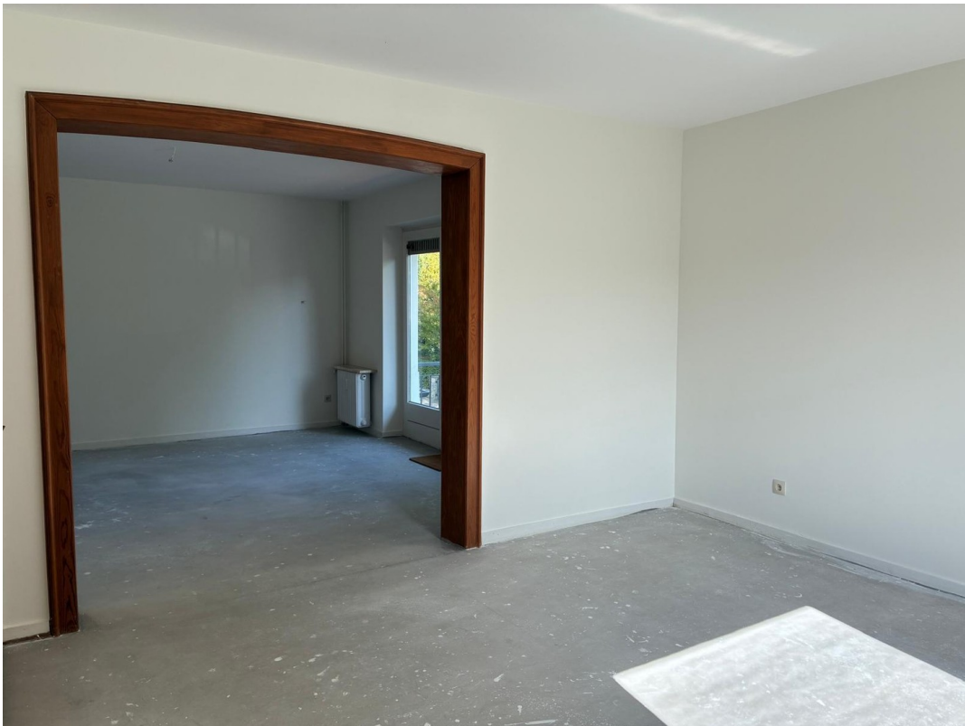
Esszimmer mit Wohnzimmer