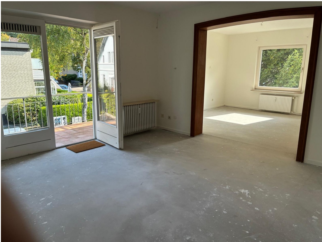
Wohnzimmer mit Esszimmer