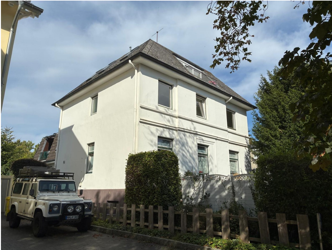
Ansicht Am Baum