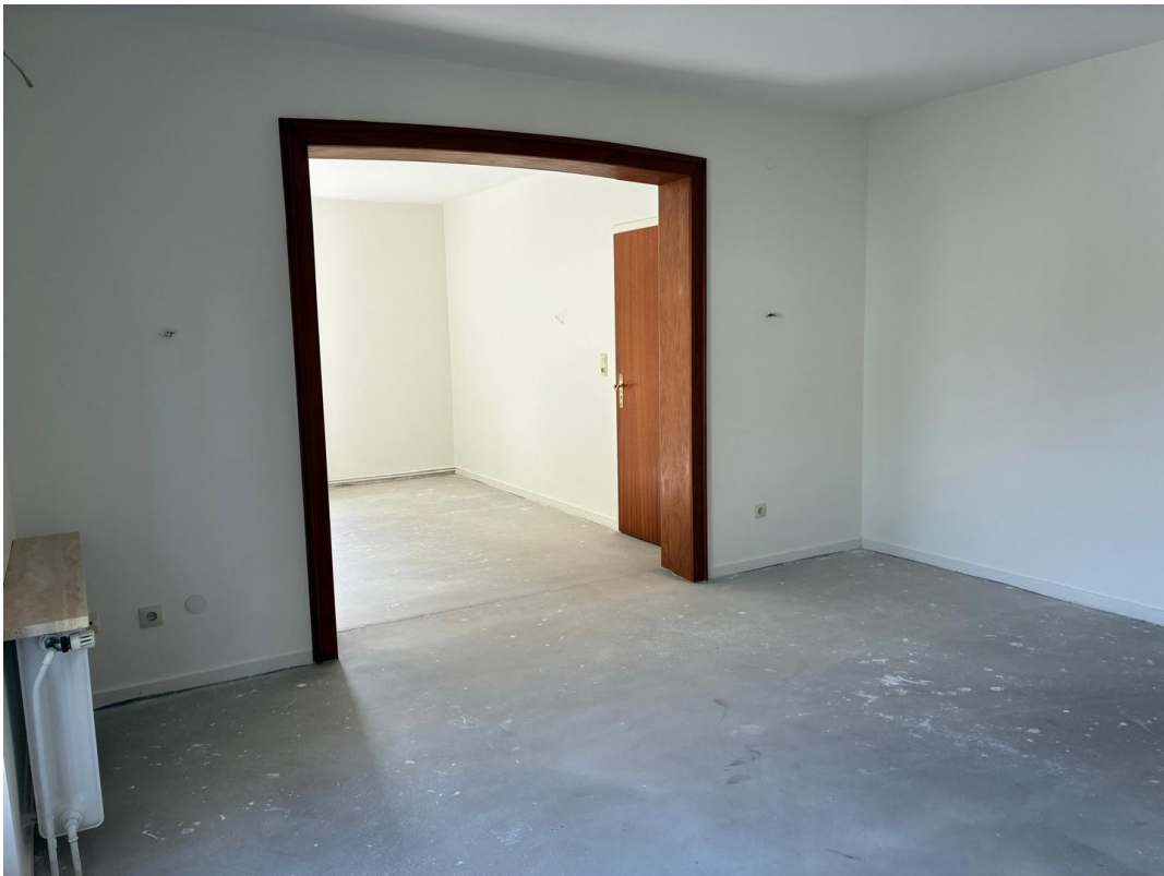
Wohnzimmer mit Esszimmer