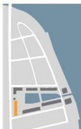
Lage im Quartier