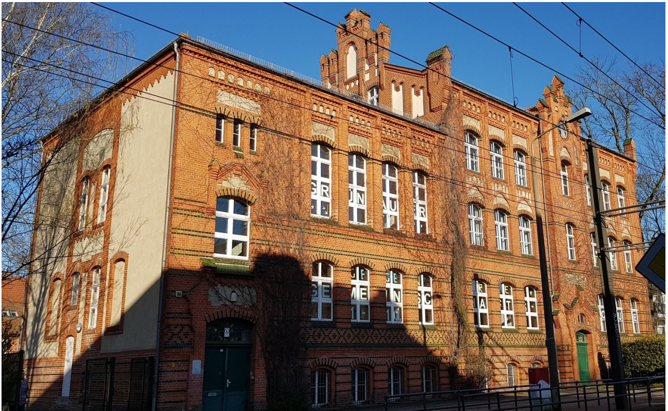
Die Gesamtschule in 300m Entf.