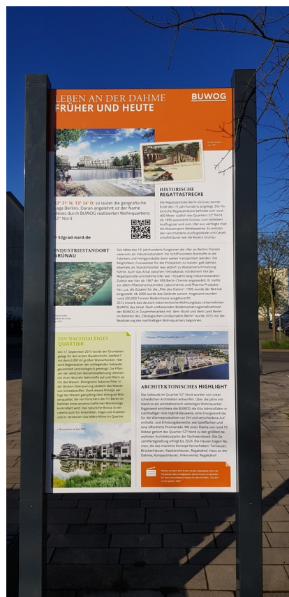
Ein Quartier mit Historie