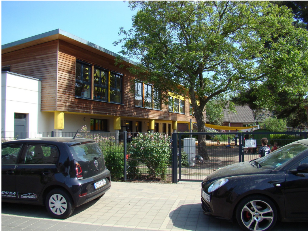
Öko-Kita mitten im Quartier