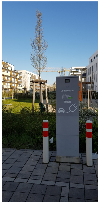
Zwei E-Ladesäulen im Quartier