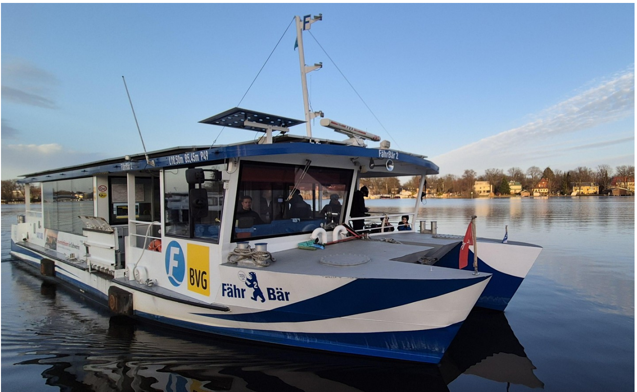
Fähre über d. Dahme z. Müggelb