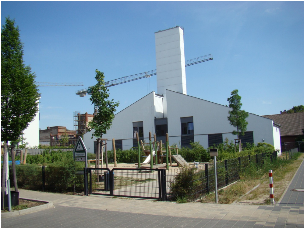
Eigene Heizzentrale mit Biome.