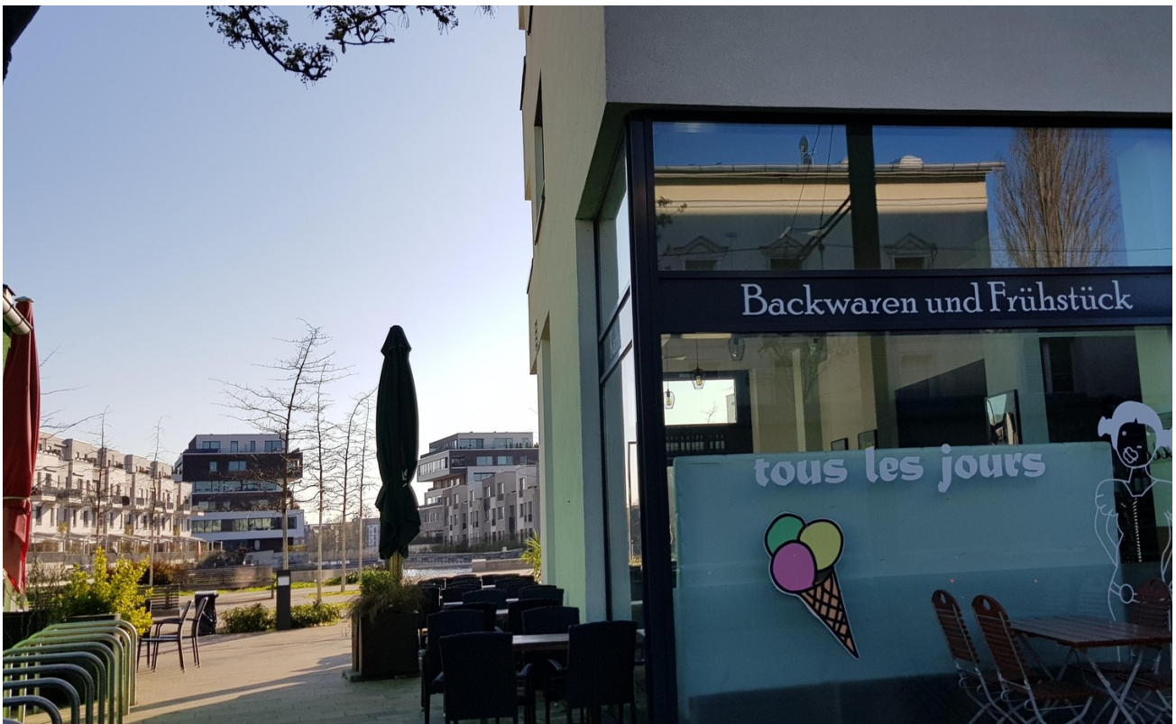
..mit frischen Brötchen & Eis