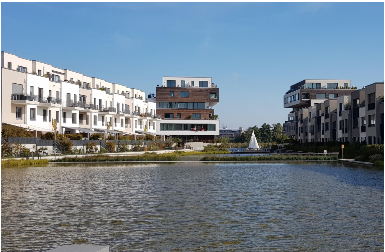
Blick vom Balkon bis zur Dahme