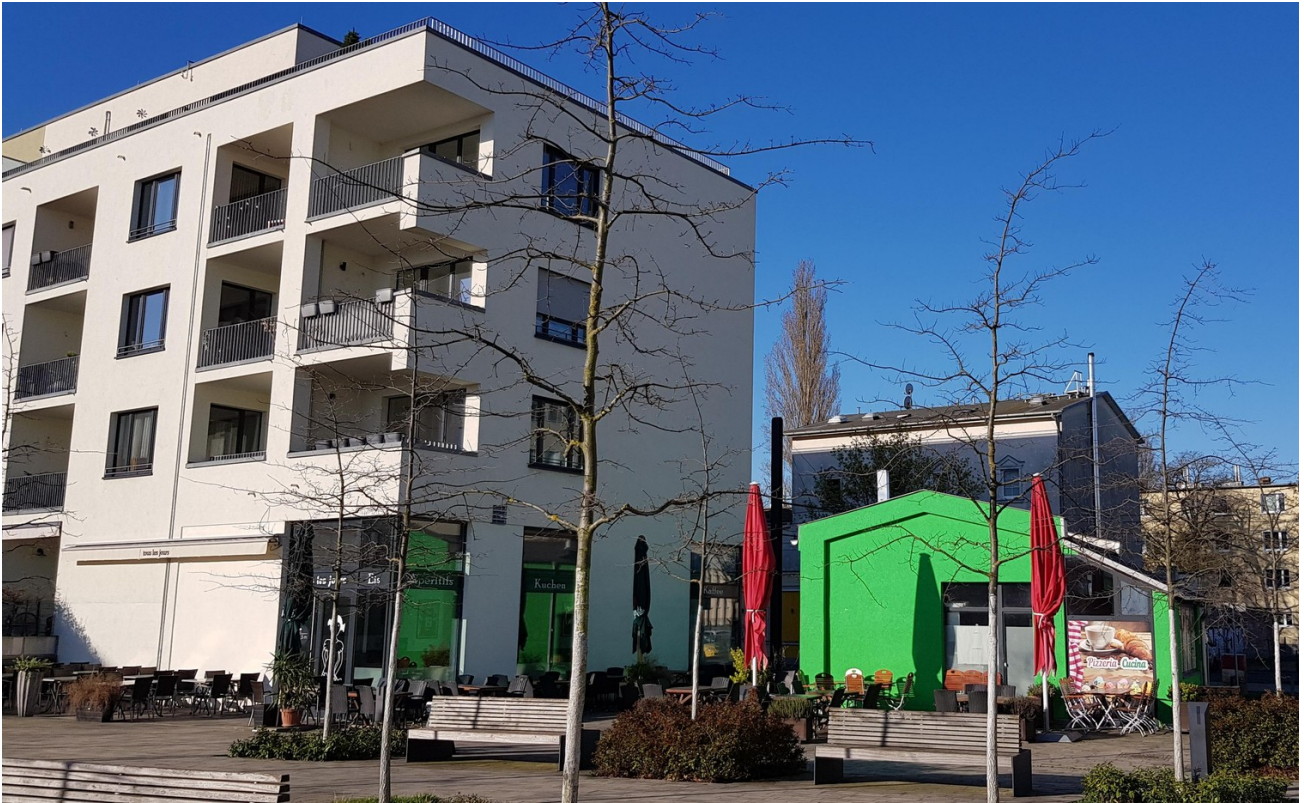
Café & Restaurant im Quartier