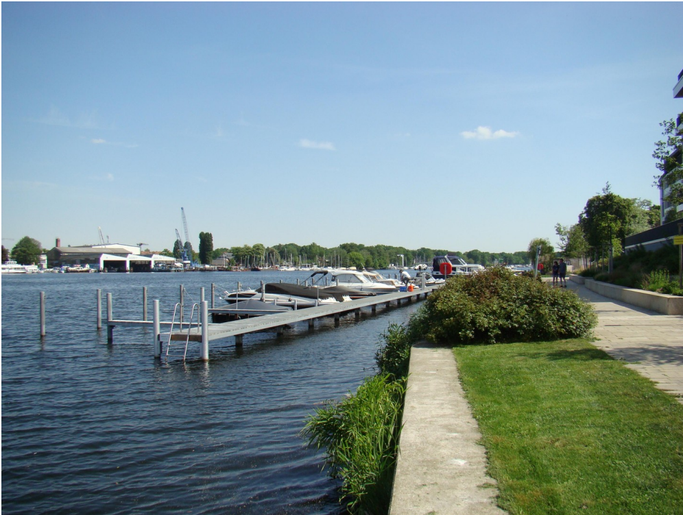
600 m langer Uferweg