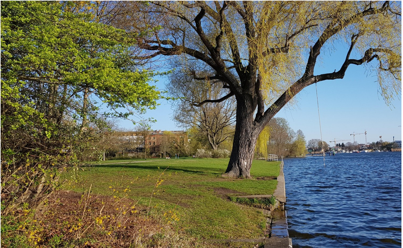
Wunderschöner Park nebenan