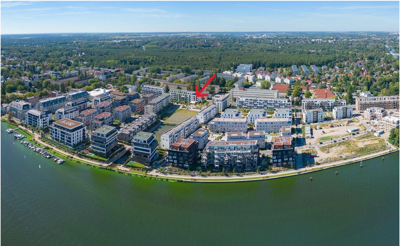
Perfekte Wasserlage