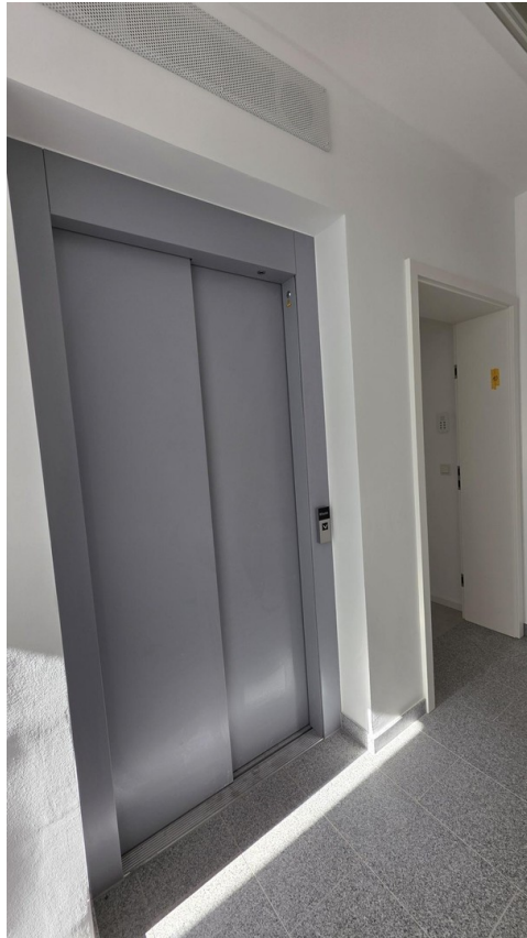
Aufzug neben Wohnung