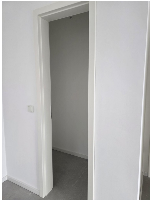
Vorratsraum neben Küche