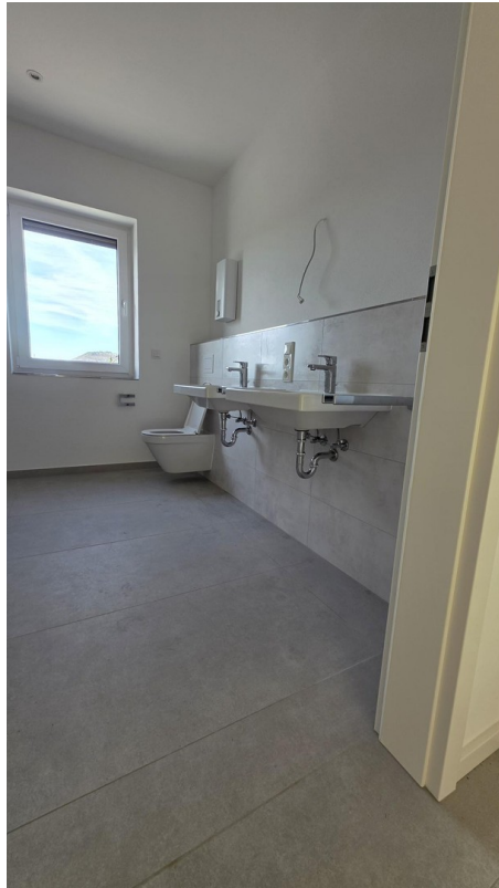
Hauptbad 7,50 m 2