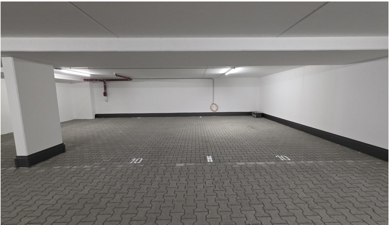
2 TG-Stellplätze extrabreit