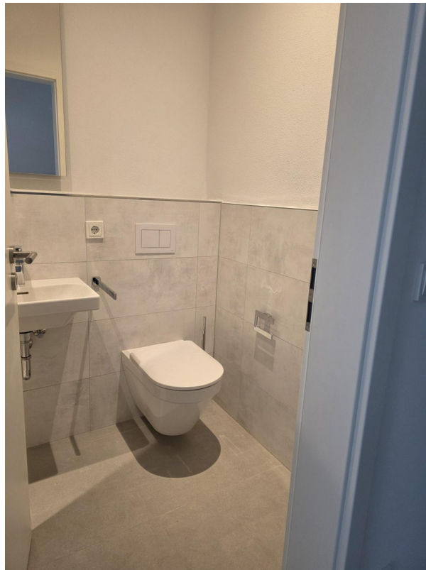
Gäste-WC, bel. Spiegel, Ablage