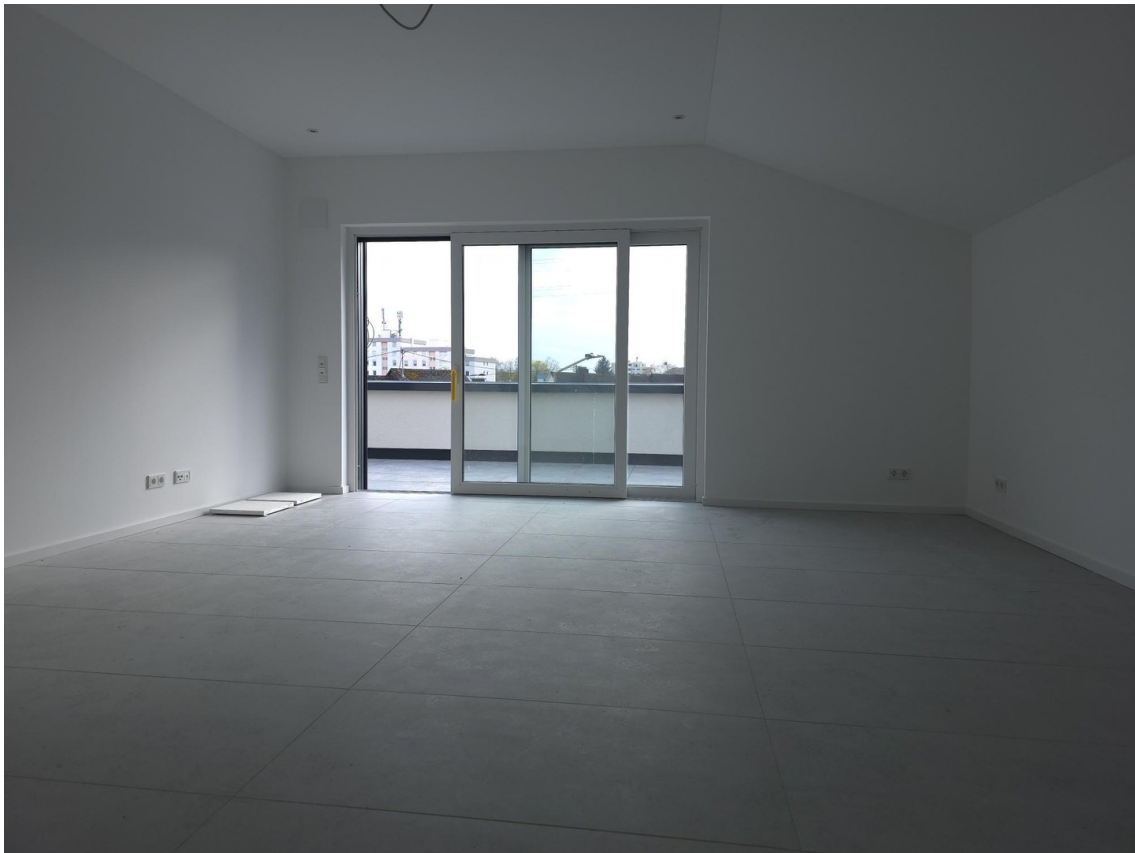
Wohnbereich 33 m 2