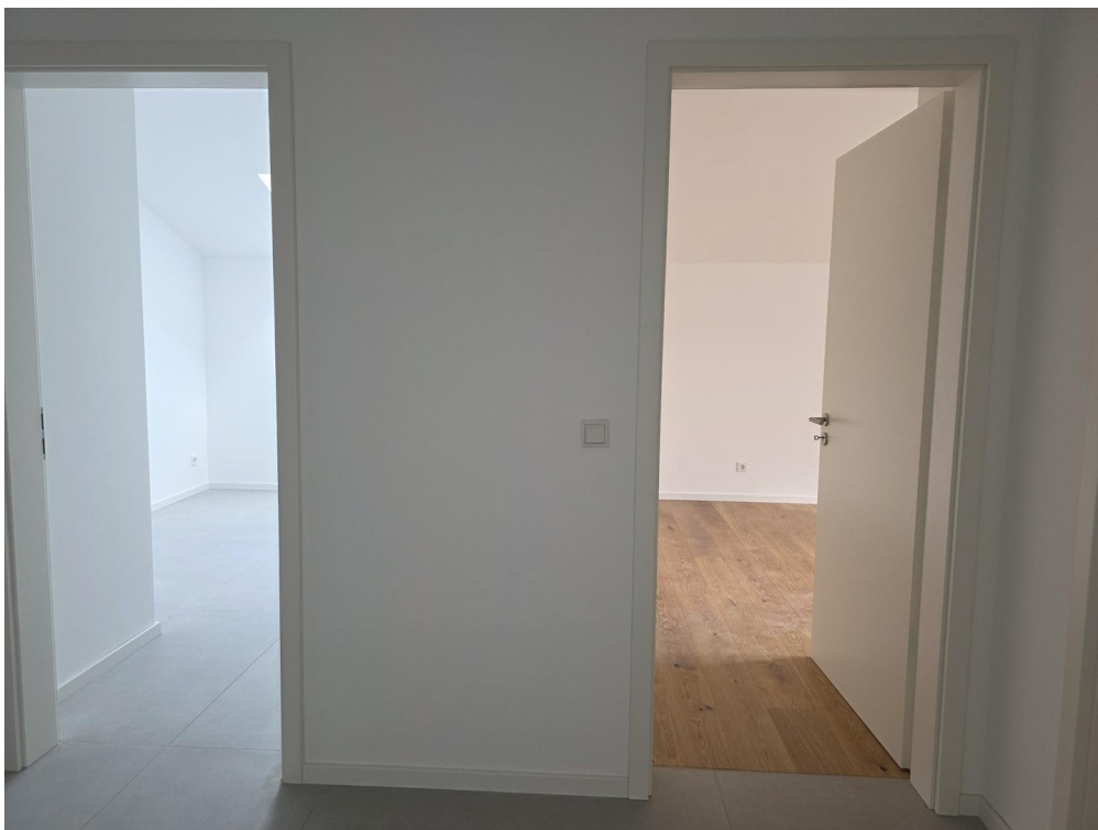
Blick vom Flur ins KiZi und SZ