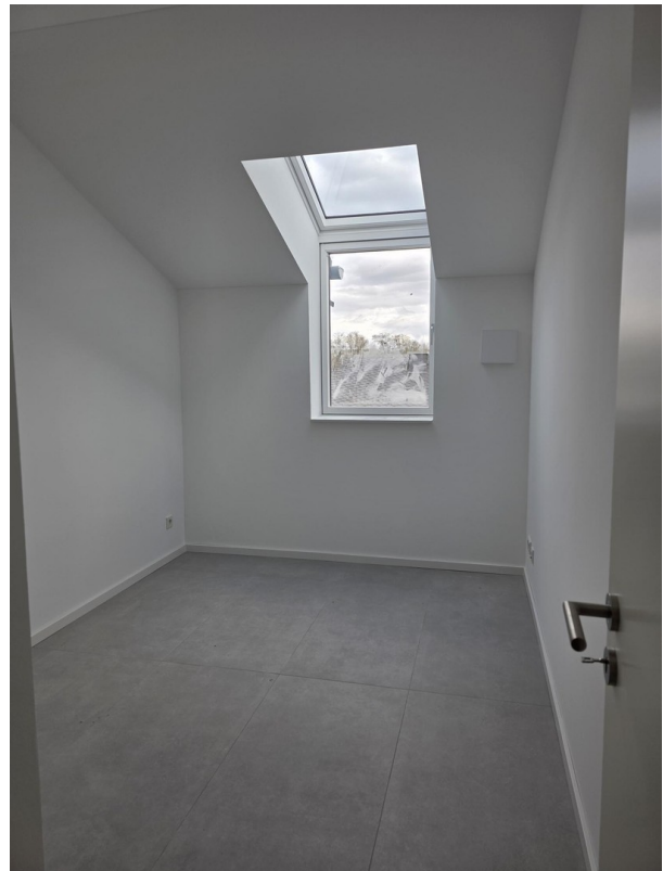
Büro/Kind 2, 9 m 2