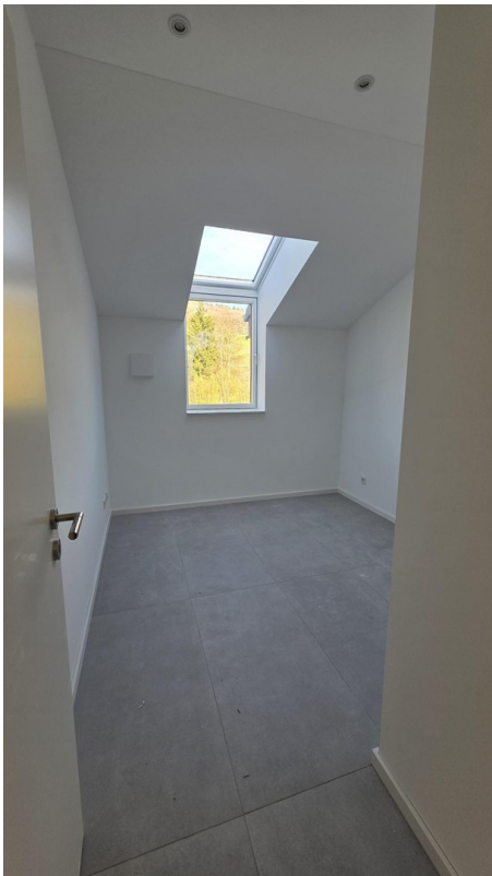
Büro/Kind 2, 10 m 2