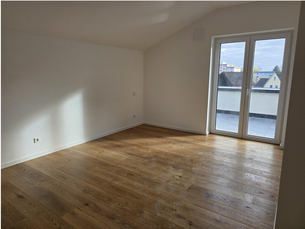
Schlafzimmer 17,9 m 2