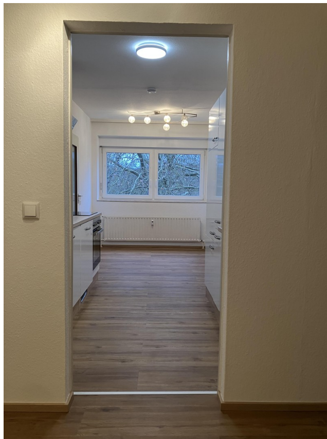
Zugang vom Flur