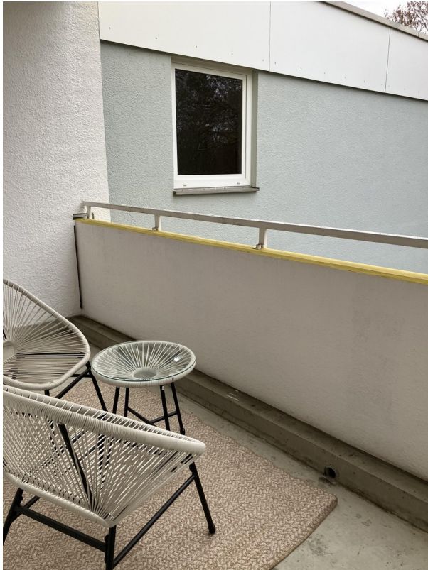
Balkon / Loggia