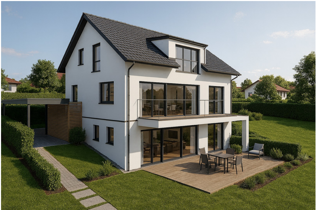
Beispielhaus Rückseite (Osten)