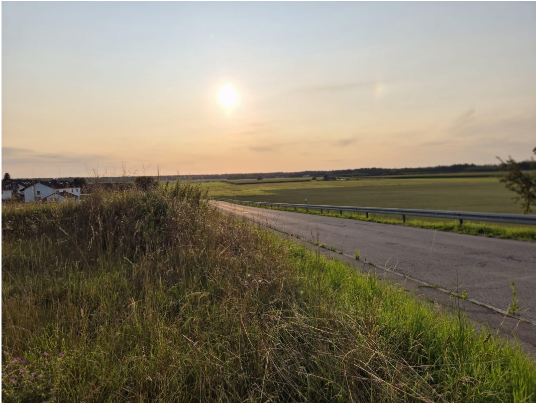
Westen mit Straße