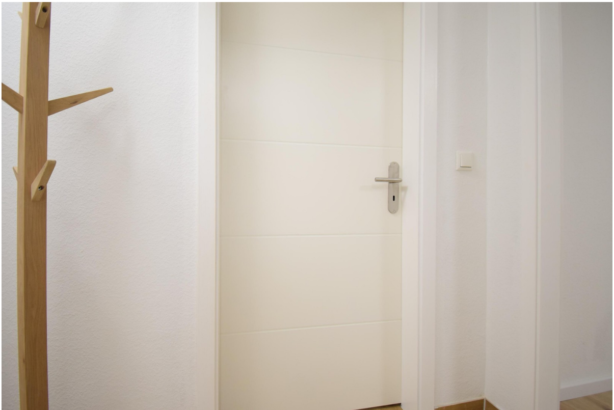
neue weiÙe Innentüren