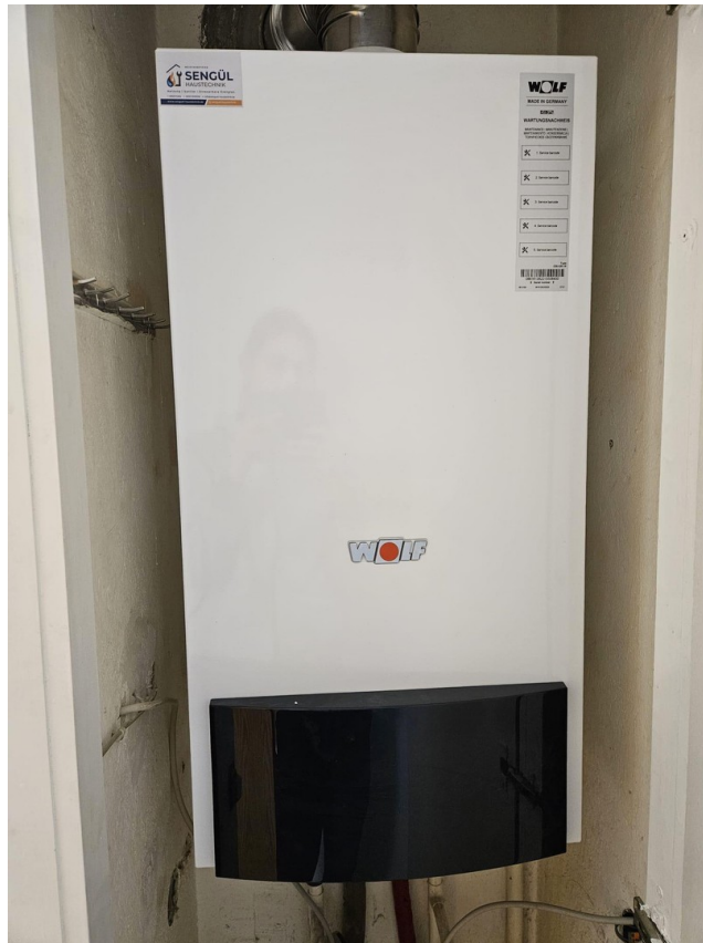
Neue Heiztherme (2025)