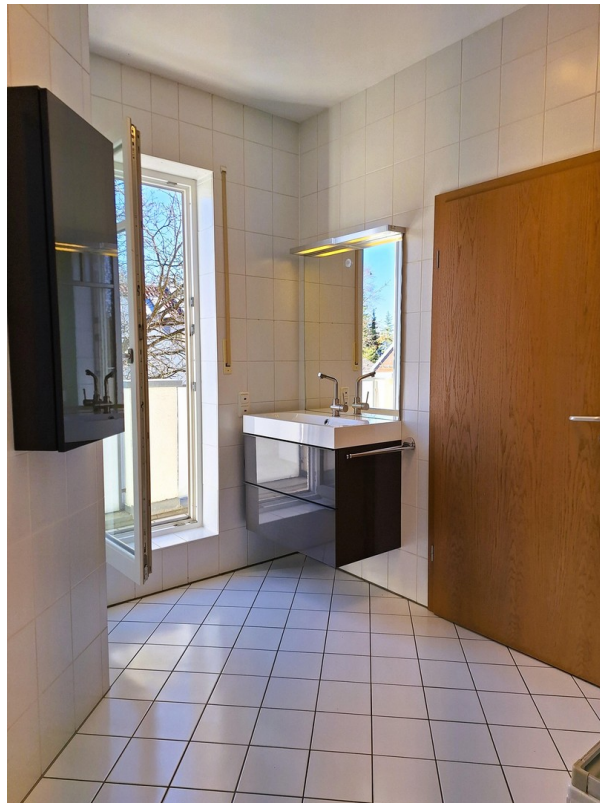
Badezimmer mit Balkon