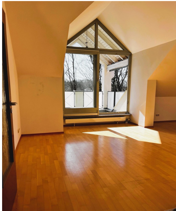
Wohnbereich und Terrasse