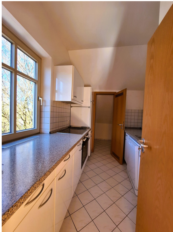
Küche mit Abstellkammer