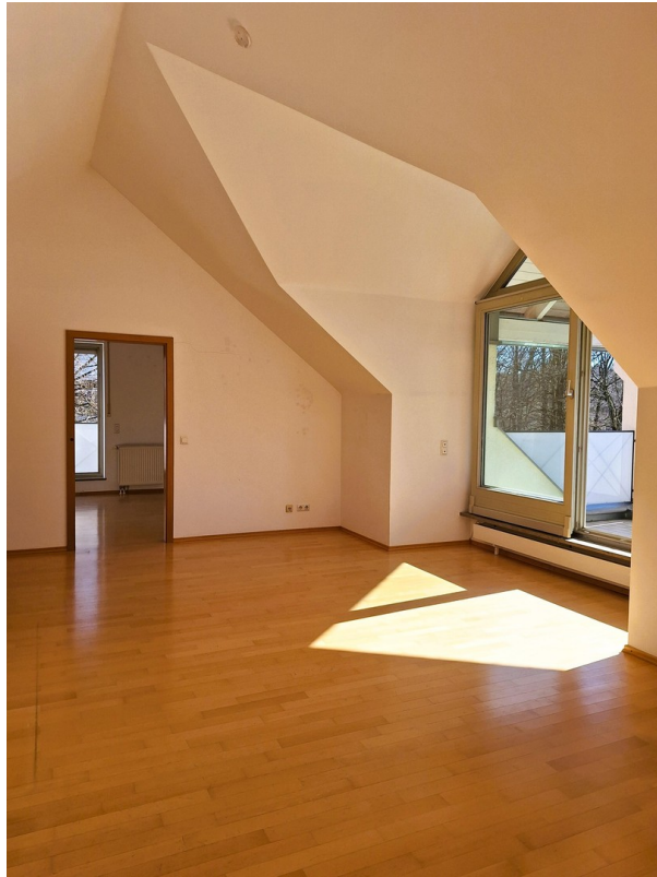
Wohnbereich und Terrasse