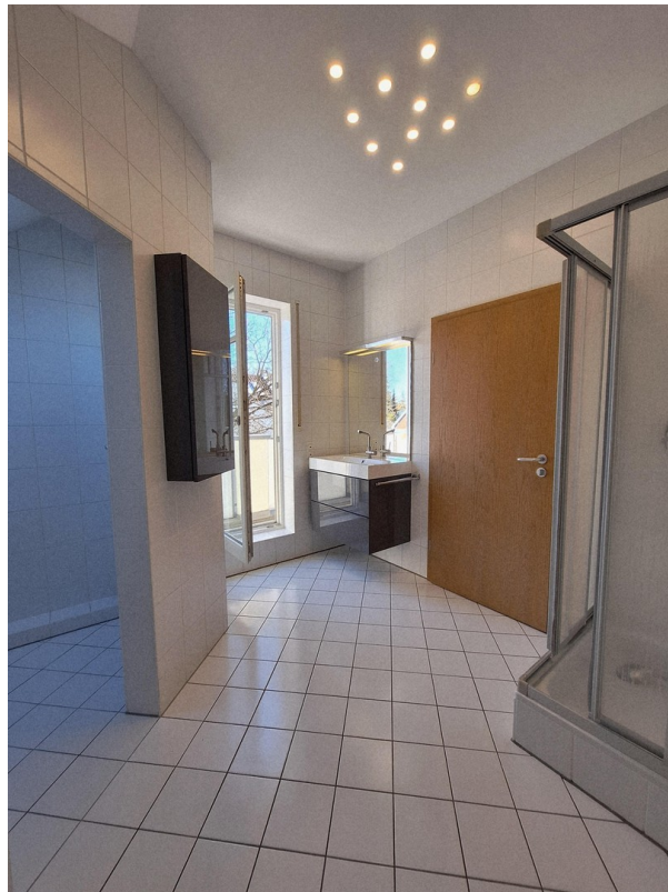
Badezimmer mit Balkon