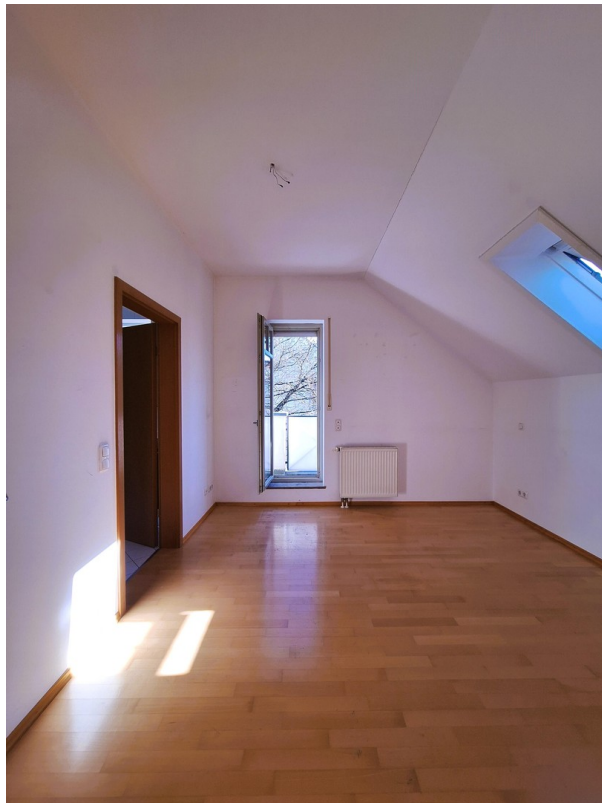
Schlafzimmer 1 mit Balkon