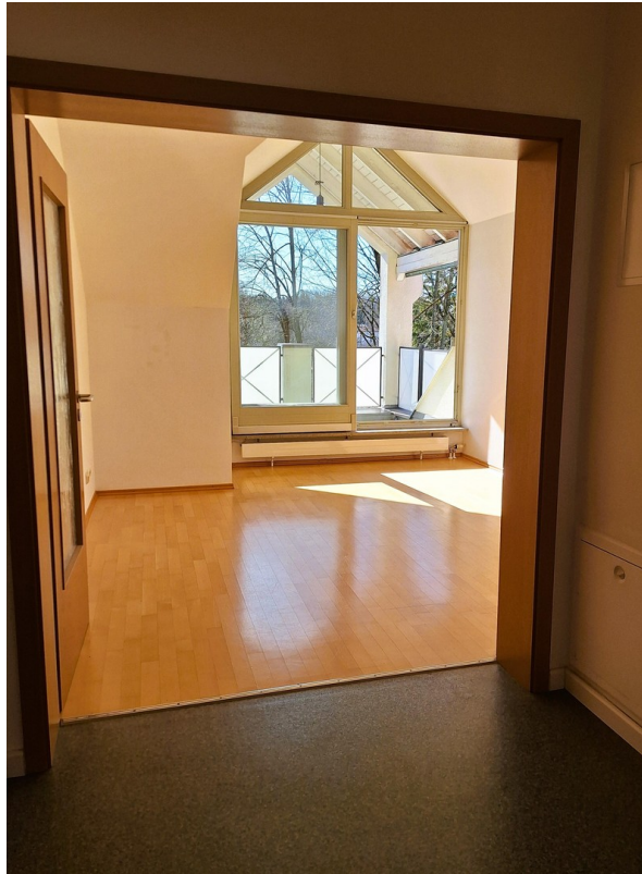
Vorzimmer mit Doppeltür