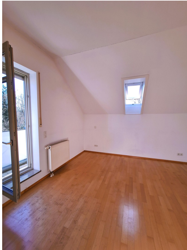
Schlafzimmer 1 mit Balkon