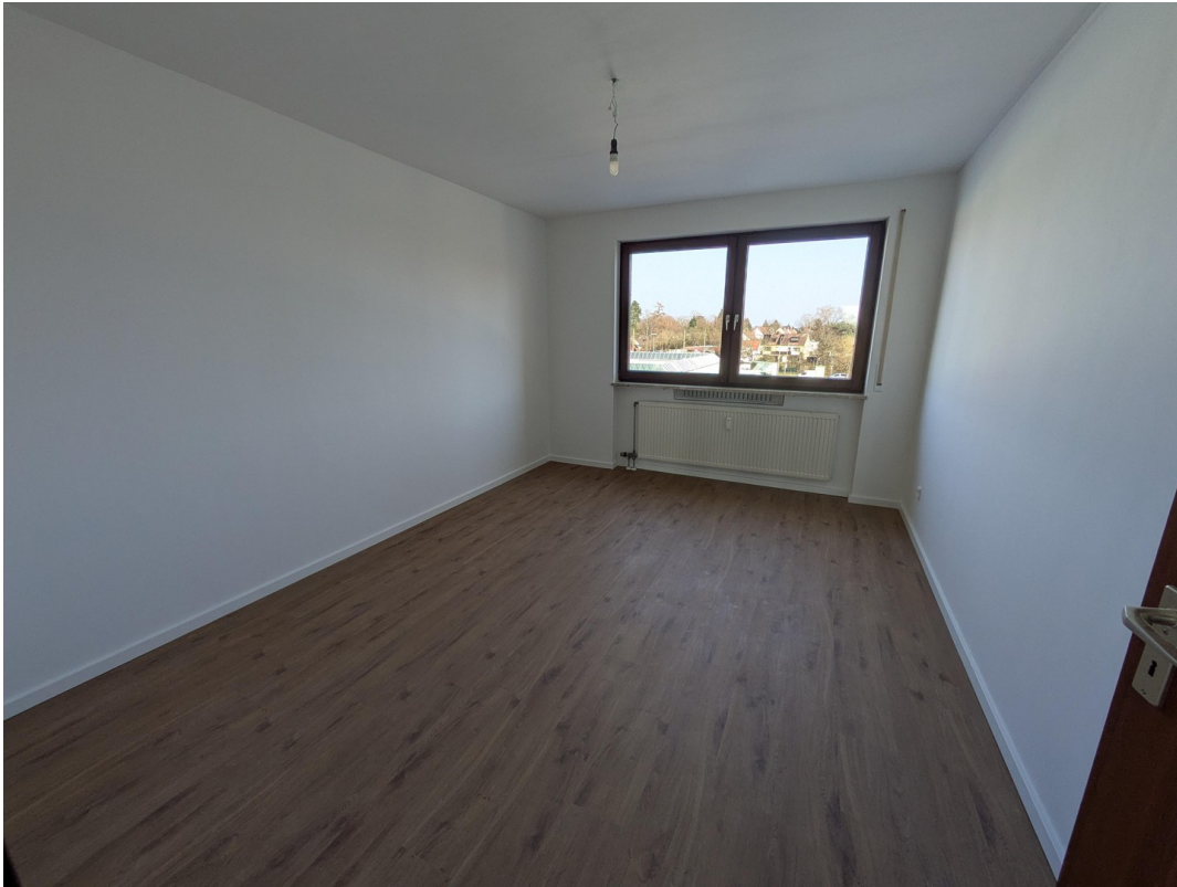
Schlafzimmer Blick 1