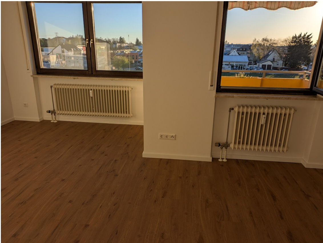
Wohnzimmer Blick 2