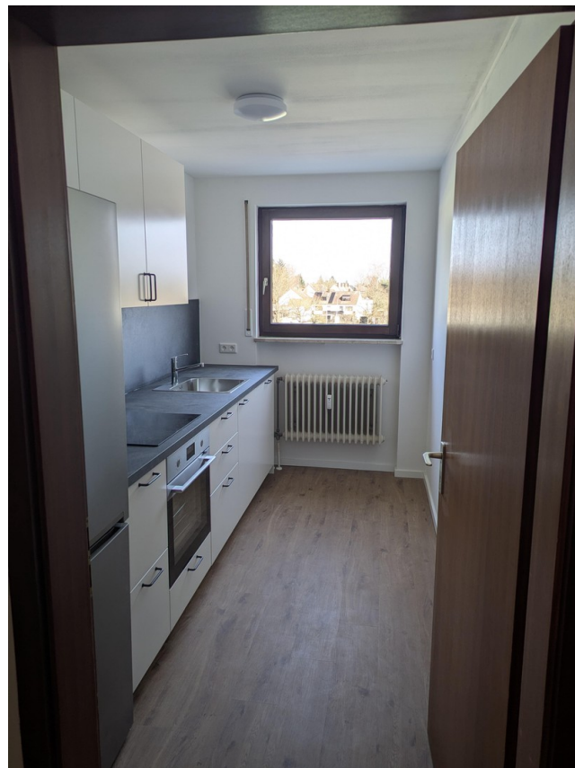
Küche Blick 1