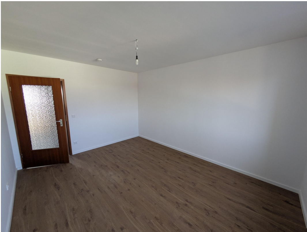
Schlafzimmer Blick 2