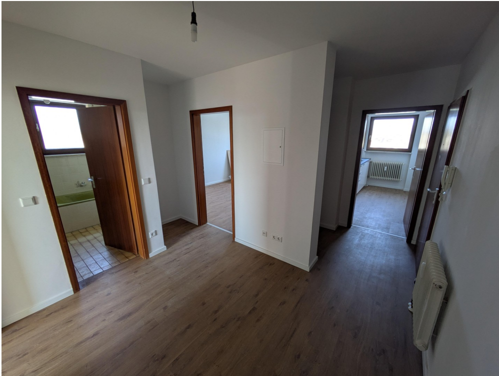
Flur Blick 1