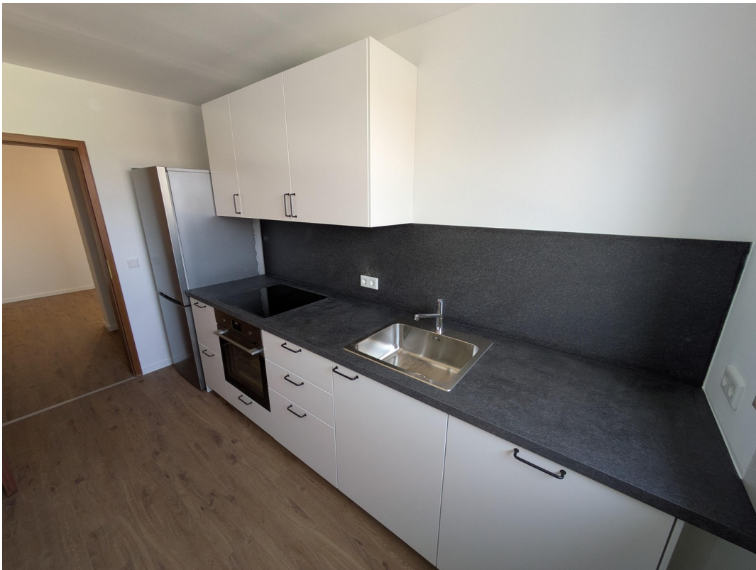
Küche Blick 3