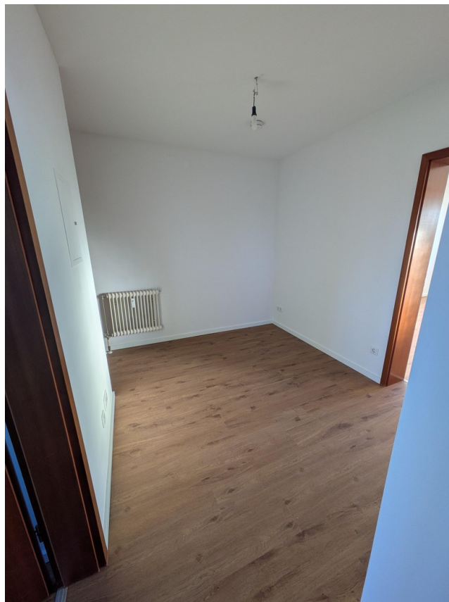
Flur Blick 2