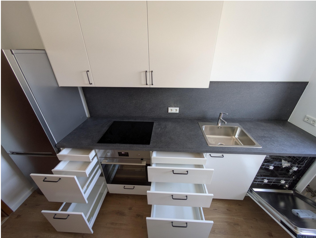
Küche Blick 2