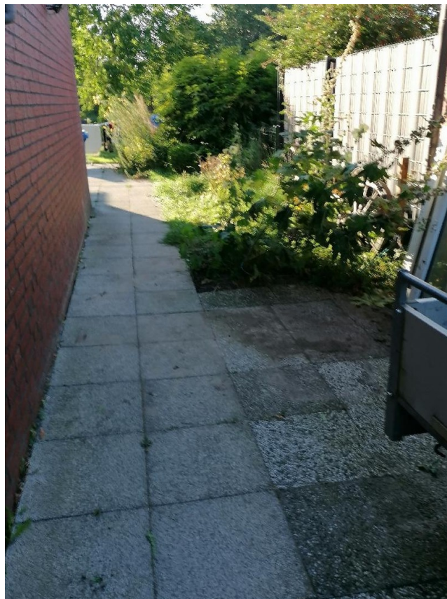
Seitl. Weg nach hinten