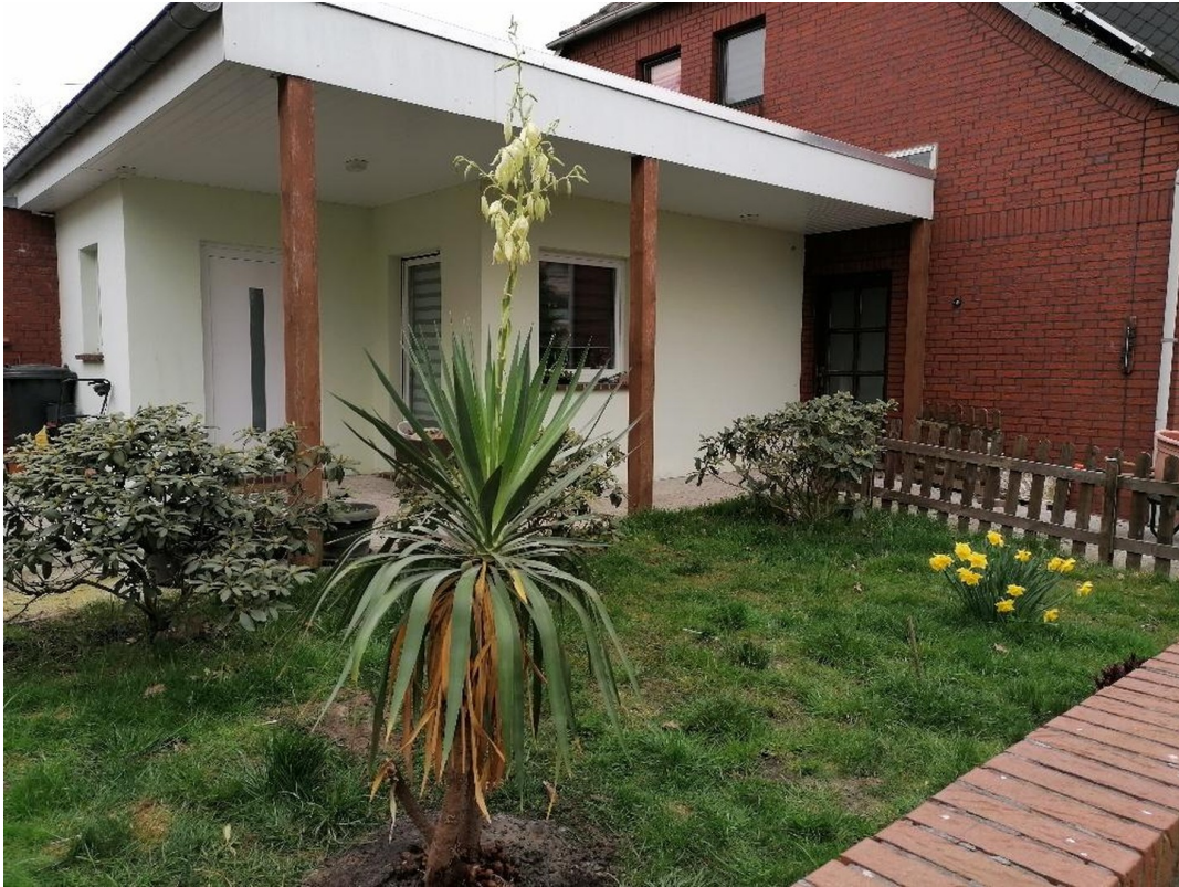
Eingang 3-Zi-Whg Bj. 2017