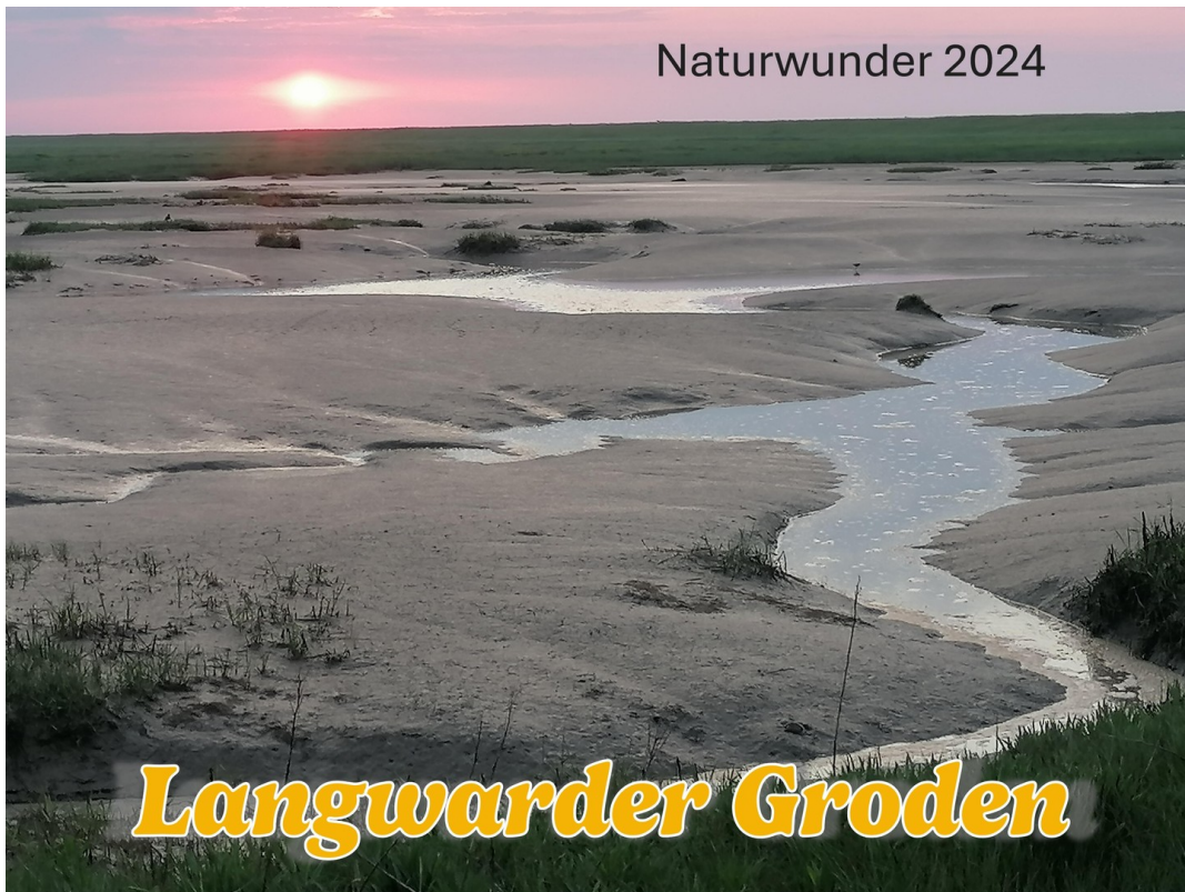
Freizeit - Natur pur