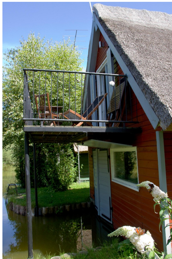
Balkon über der Mildenitz