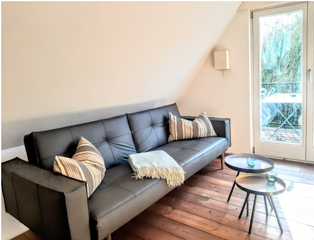
Wohnbereich im OG