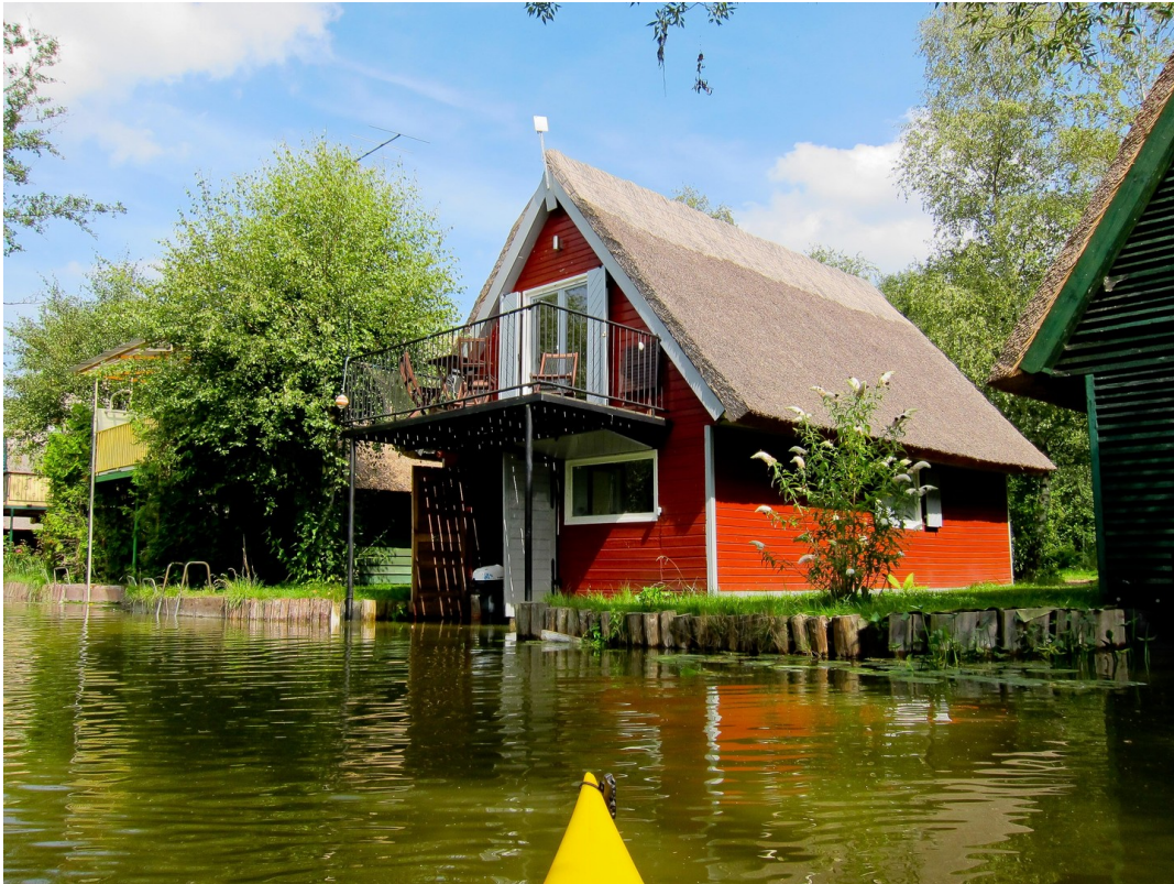
Bootshaus in Goldberg