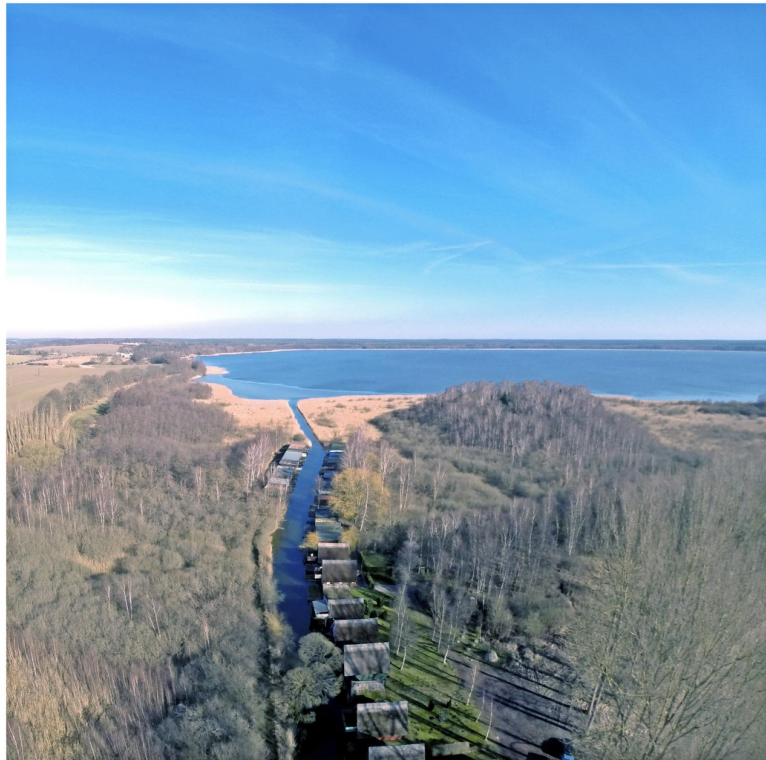
Luftbild der Bootshäuser