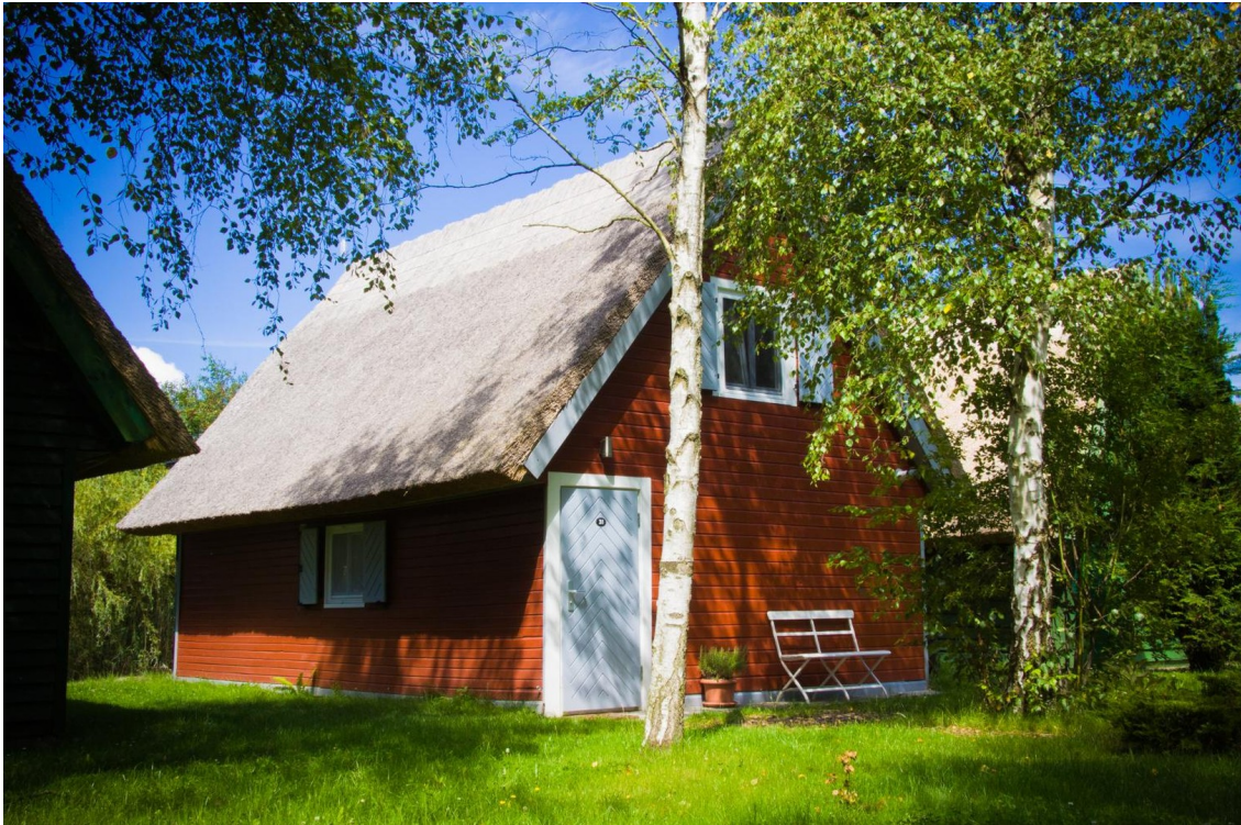
Landseite des Bootshaus