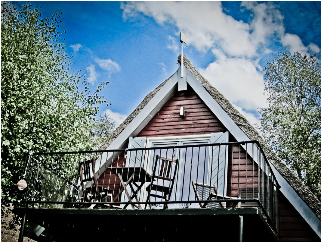
Balkon über der Mildnitz