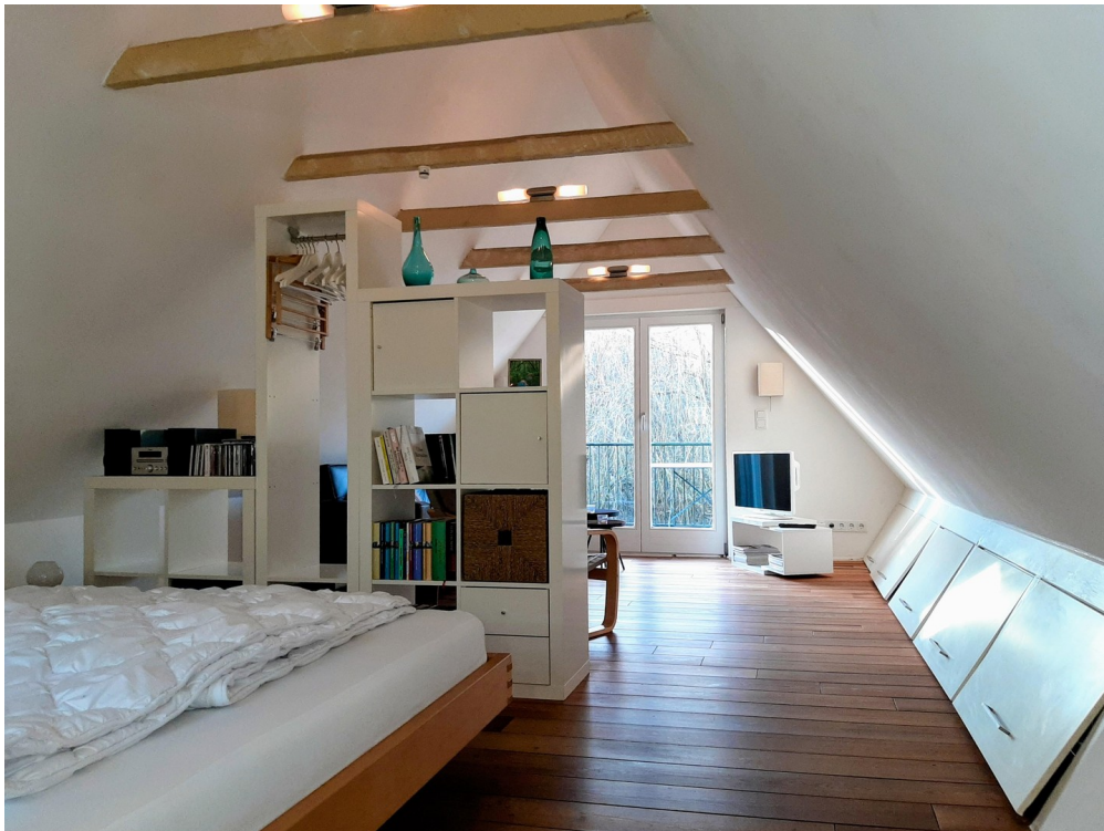
OG des Bootshaus