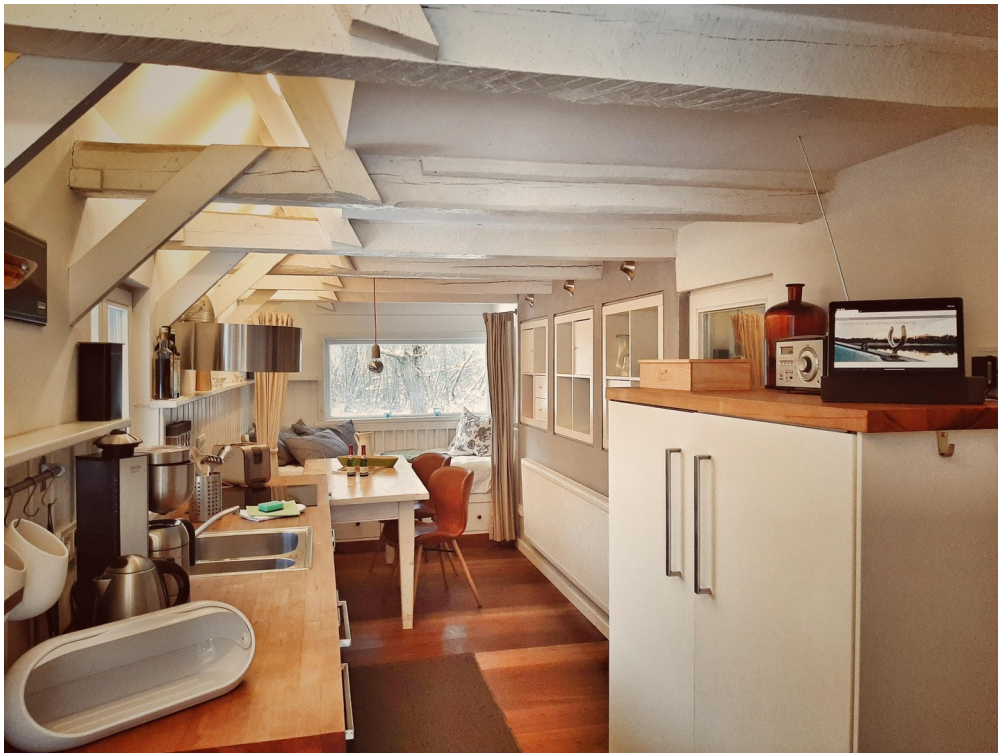
Küche im EG