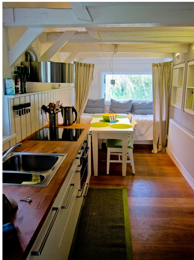
Küche im EG