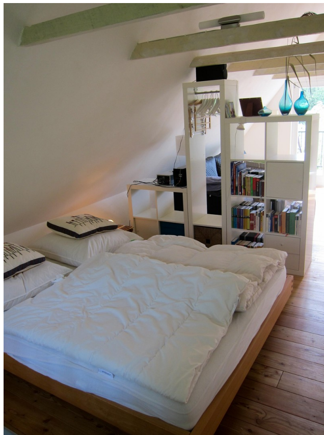
Schlafbereich im OG