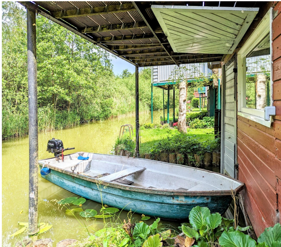
Anka - der Anelkahn