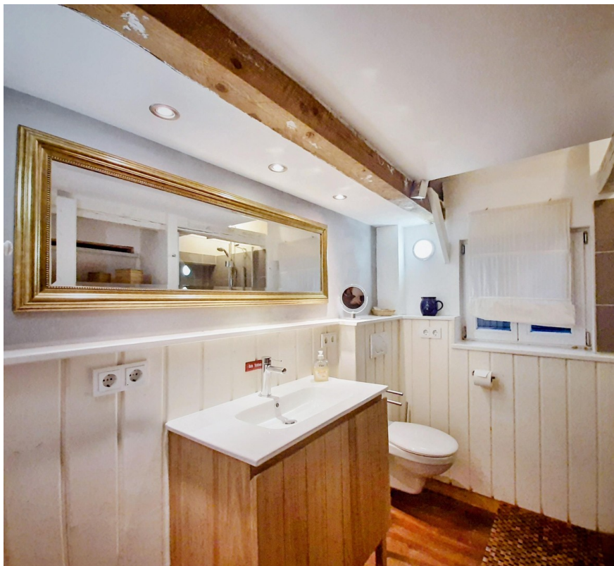
Duschbad im EG