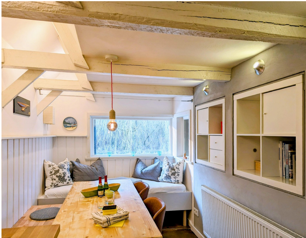
Esstisch mit Alkove