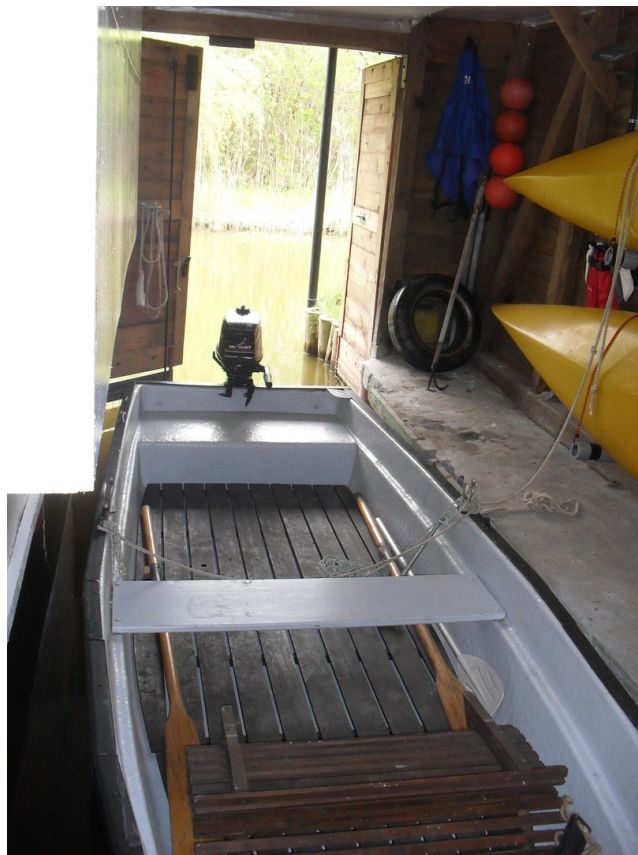
Bootsraum mit Anka und 2 Kajak