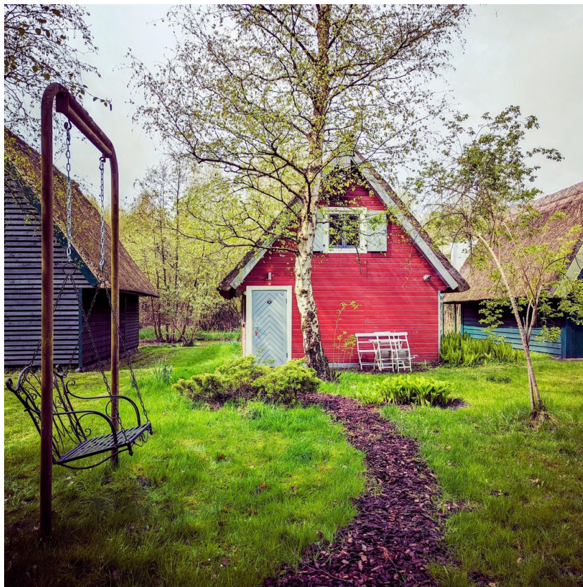
Boothaus auf Pachtland