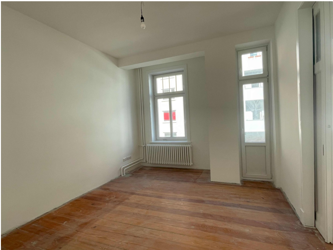
Zimmer1 Mini Balkon