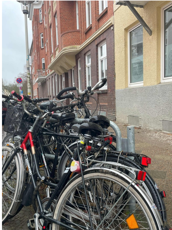
Fahrräder vorm Haus