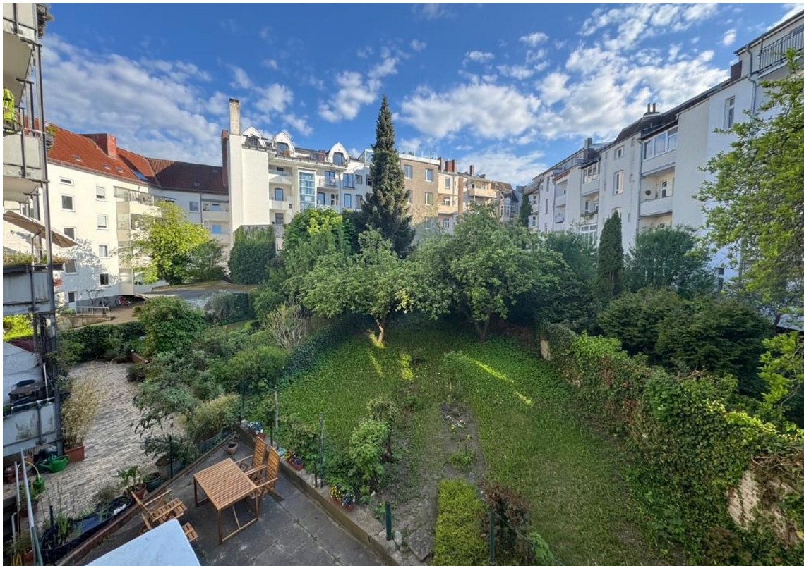
Blick Balkon Gartennutzung