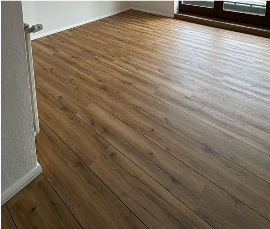
Designboden-wird grad verlegt