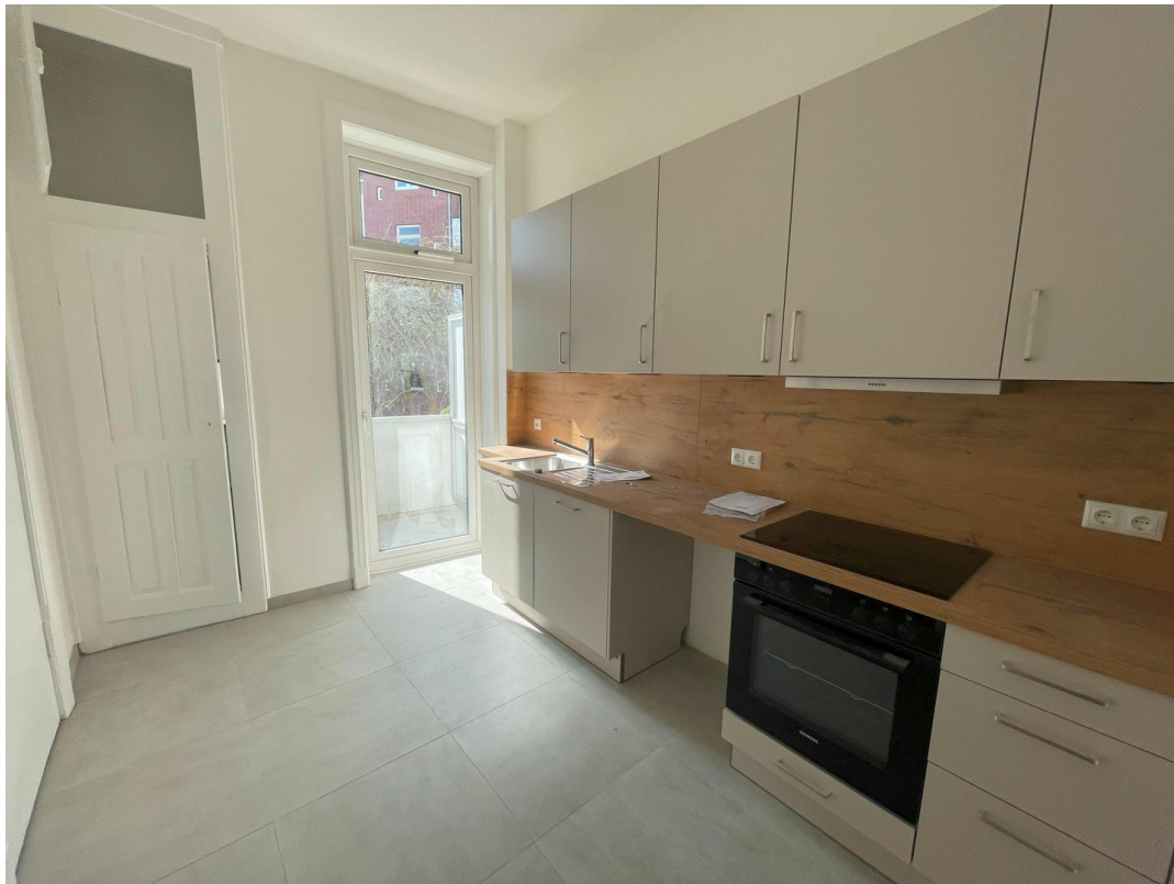
Küche Einbauschränk Balkon